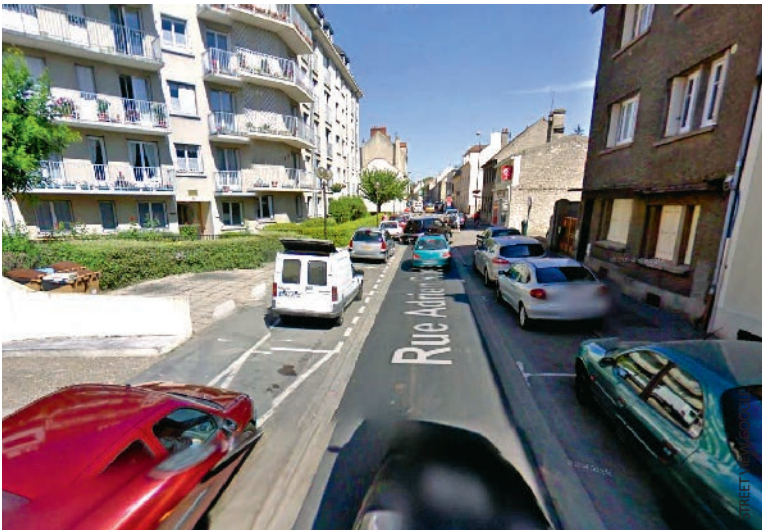
Seul le box a été brûlé lors de la vengeance.

Un homme a mis le feu à son box de parking pour se venger de son locataire dans la journée du lundi 14 décembre.