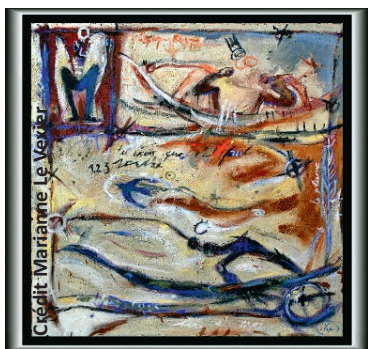
Un monde imaginaire à la limite du réel invite le spectateur au voyage.

Le vernissage de sa nouvelle exposition aura lieu le mardi 4 janvier à 18 h 30.