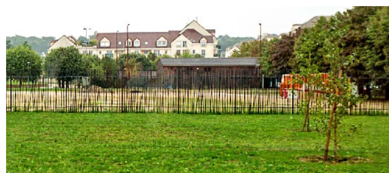
Le bâtiment sera situé derrière l'espace Claude Vanpouille (photo).

La majorité LR a voté au dernier conseil municipal la construction d'un terrain multisports couvert dans le quartier Saint-Exupéry. Il permettra les compétitions de futsal.