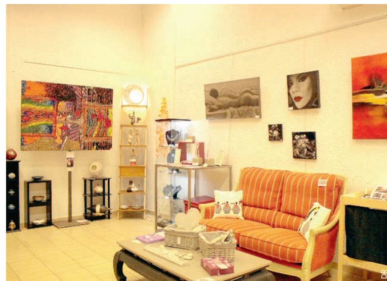
Un univers éclectique où les artistes sont mis en valeur.

Avec un panel de cinq à six œuvres, la boutique change tous les quinze jours les réalisations. « Les artistes louent l'espace pour deux mois minimum pour 50 euros. Cela permet de renouveler les œuvres et montrer l'effervescence qui existe dans ce milieu », continue le passionné d'art. Dans la même veine, des ateliers s'installeront pour que les artistes travaillent directement sur place.