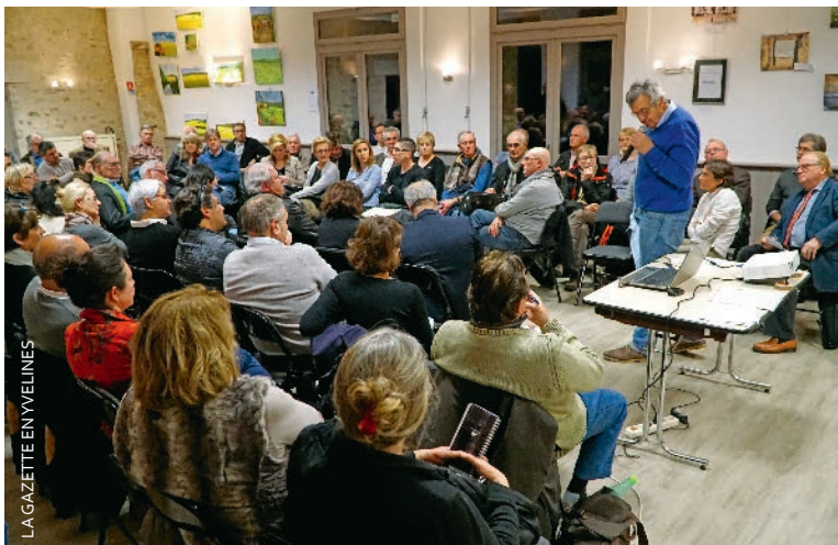
La réunion publique s'est déroulée à Brueil-en-Vexin, conjointement avec Fontenay-Saint-Père, Jambville, Montalet-le-Bois, Oinville-sur-Montcient et Sailly.

La ville a accueilli une réunion publique mercredi dernier, dans le cadre des assises de la ruralité. L'occasion était donnée à chacun de pouvoir s'exprimer sur sa conception de la ruralité.