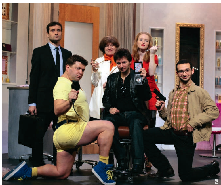
Il va falloir ouvrir l'oeil et ses oreilles au moindre détail pour découvrir le meurtrier.

Une idée de cadeau dernière minute : pourquoi ne pas opter pour une pièce de théâtre ? « Dernier coup de ciseaux » apportera de la bonne humeur le temps d'une soirée à l'espace Maurice-Béjart.