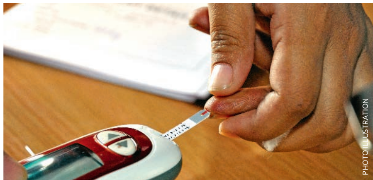
Le diabète tend à isoler les malades.

Face au diabète de type 2, certains ont du mal à vivre avec. Des ateliers pour apprendre à le gérer seront mis en place pendant six semaines en début d'année 2016, à raison d'un jour par semaine : le mardi ou le jeudi.