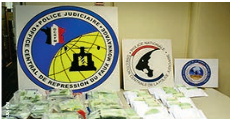
Les interpellations ont eu lieu entre le quartier de la Noé à Chanteloup-les-Vignes et celui de Beauregard à Poissy. Plus de 300 000 euros de faux billets ont été découverts.

Treize trafiquants ont été interpellés pour leur implication dans un réseau d'importation de fausse monnaie. Au total, un peu plus de 300 000 euros ont été trouvés du côté de Poissy et Chanteloup-les-Vignes.