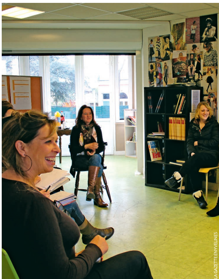
Ambiance conviviale pour motiver les jeunes.