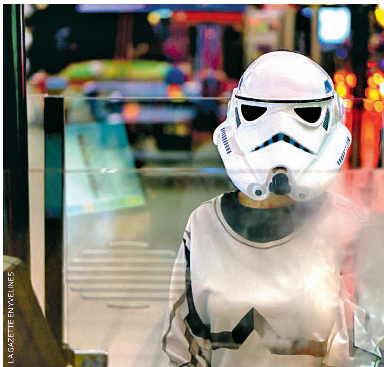
Le cinéma avait vêtu ses salariés en personnages des films.

Dans le Mantois comme partout dans le monde, les fans de la série attendaient le septième opus... et n'ont pas hésité à prendre des congés pour venir à la toute première séance.