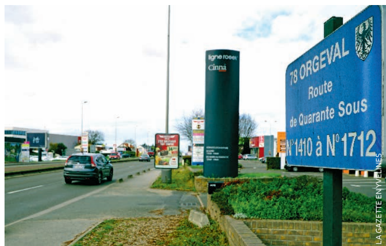
La zone d'activité s'étend sur 59,5 hectares à Orgeval et 3,5 ha à Villennes-sur-Seine. Aujourd'hui, elle compte 160 établissements et près de 1 400 emplois.

Certes ils sont jeunes mais au fond, avec leurs suggestions, ils prouvent que la solidarité revient au premier plan et savent rappeler ainsi à leurs pairs qu'ils sont à l'écoute des préoccupations des Pisciacais.