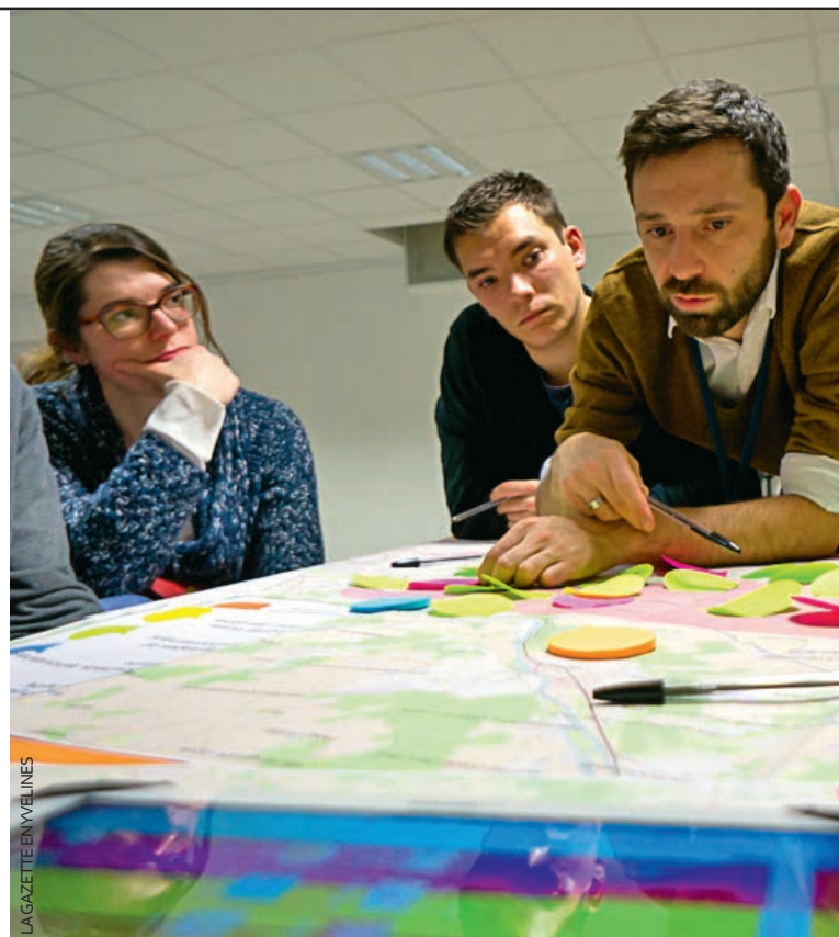
Cette réunion s'est déroulée en petits groupes, rassemblés autour de cartes où figure une ébauche du futur tracé.