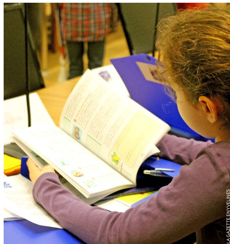
Les enfants prennent à cœur leurs nouvelles responsabilités.

La parole des jeunes prend de plus en plus d'importance, la preuve avec le premier conseil municipal des juniors, mercredi 16 décembre à l'hôtel de ville.