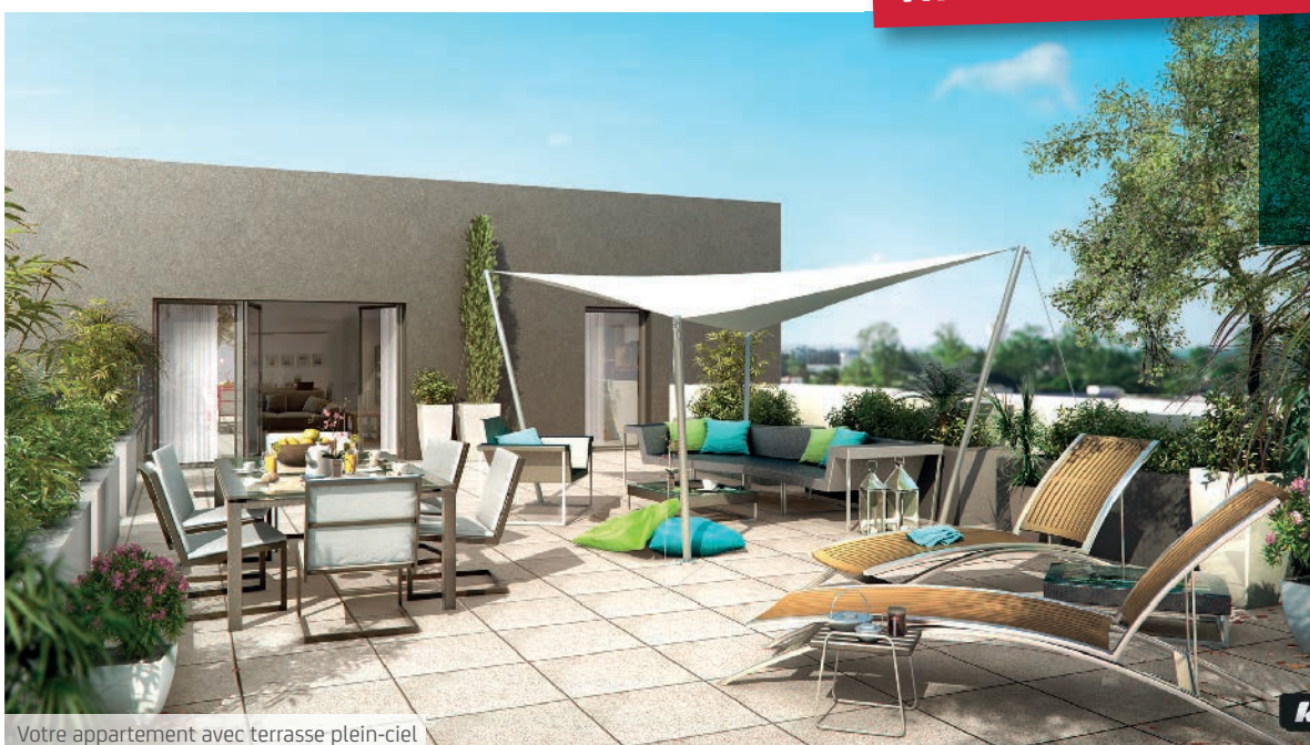
Votre appartement avec terrasse plein-ciel

ibiza - Nexity Féréal RCS Paris 334 850 690 - Illustration non contractuelle à caractère d'ambiance - Architecte : DND / Reichen et Robert & Associés - Illustrateur : Kréaction - Décembre 2015