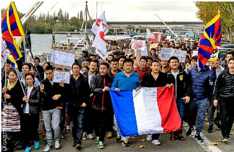
Manifestation (photo), courriers d'élus, alertes et articles de presse : la présence de nombreux Tibétains fuyant leur pays sous administration chinoise agite la confluence depuis plus d'un an.

Les Tibétains vivant dans des tentes en bord de Seine ont été relogés temporairement à l'hôtel par la préfecture, qui cherche une solution plus pérenne : accélérer leur obtention du statut de réfugié.