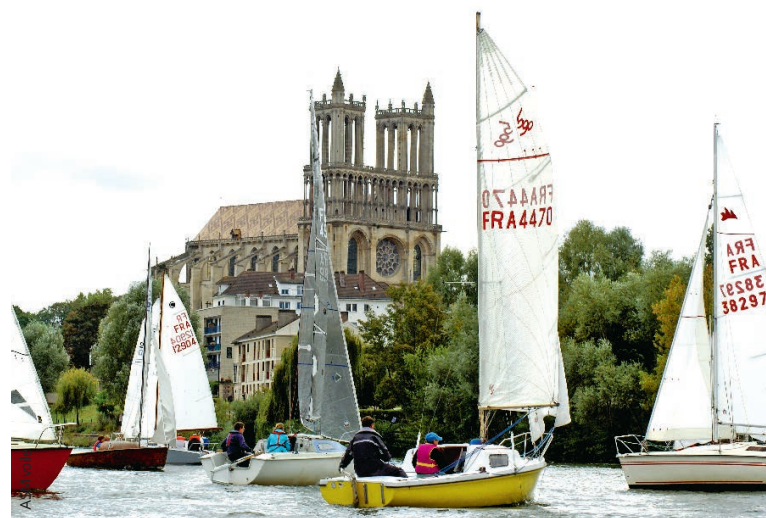
Une trentaine de participants sont attendus ce week-end.

La 10e édition d'une des régates les plus prisées d'Île-de-France s'élancera ce dimanche 20 septembre à Mantes-la-Jolie.