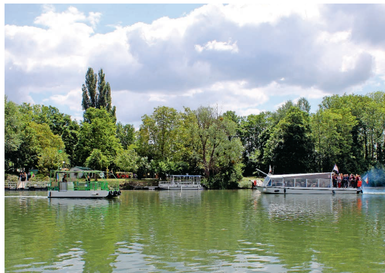
Comme à Conflans-Sainte-Honorine, des croisières seront proposées à Andrézy.

L'entrée plein tarif est de 5 euros, et gratuite pour les moins de 18 ans.