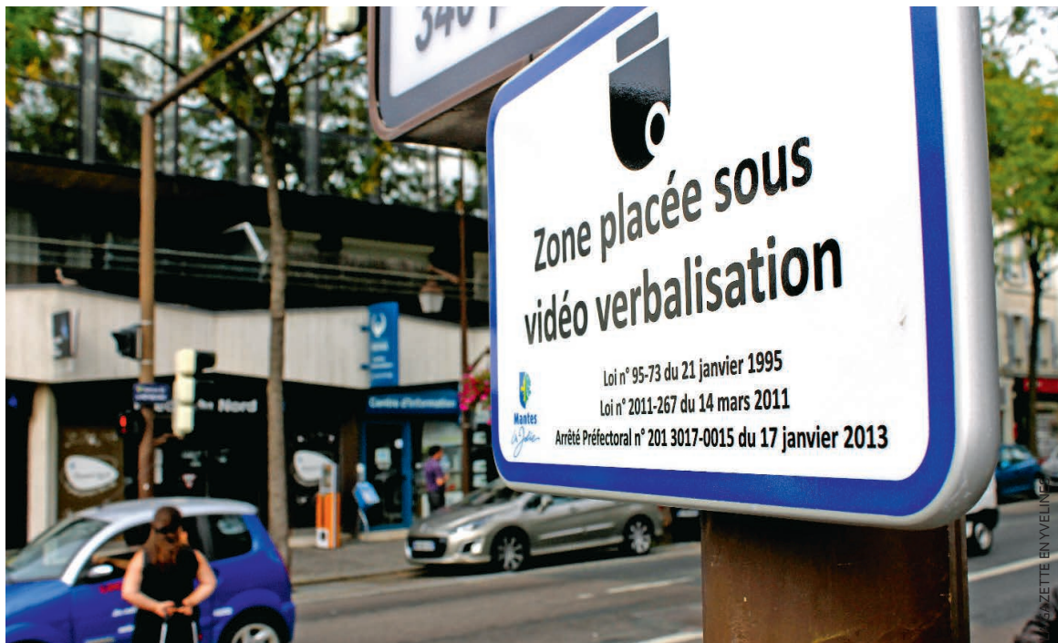
La ville de Mantes-la-Jolie affirme que « 130 procès-verbaux ont été dressés » depuis l'installation du dispositif de vidéo-verbalisation cet été.

Cette seconde phase du chantier de rénovation a coûté environ 1.8 million d'euros, dont presque 800 000 ont été pris en charge par l'Union européenne et le Conseil départemental des Yvelines.