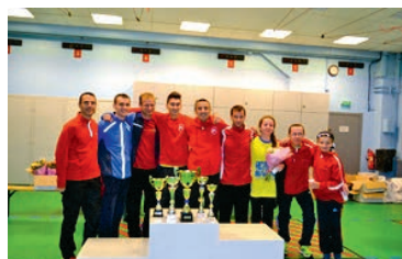
Le club d'Aubergenville en famille devant ses trophées.