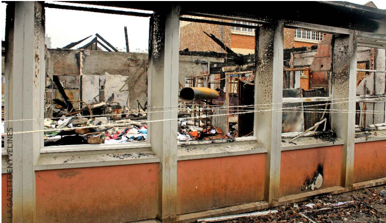
En décembre dernier, l'école muriautaine Jean Zay brûlait dans un incendie. Aujourd'hui, la ville est en passe d'aménager le pré Paul Bert pour accueillir les anciens élèves.

D'ici au premier janvier, les anciens écoliers de la maternelle Jean Zay devraient être installés dans des préfabriqués sur le pré Paul Bert. Un retour désiré dans le quartier du centre-ville, où les demandes de scolarisation sont élevées.