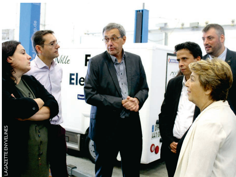
L'innovation ne fait pas tout. L'entreprise Muses connaît de vraies difficultés financières aujourd'hui.

CONFLANS-SAINTE-HONDRINE Les écologistes au chevet de Muses Les têtes de liste EELV des Yvelines aux prochaines élections régionales en Île-de-France, accompagnées d'Emmanuelle Cosse et de Corinne Lepage (Cap 21), sont venu rendre visite à Muses, entreprise de voitures électriques pour livraisons.