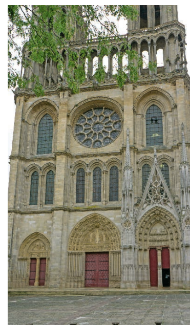
La collégiale Notre-Dame est l'une des plus importantes églises de la région parisienne.

Le musée de l'Hôtel-Dieu ouvrira lui aussi ses portes gracieusement ce week-end. Son fonds médiéval et archéologique sera accessible, ainsi que deux expositions : Claus Vahle, découvertes et citations et Pay-