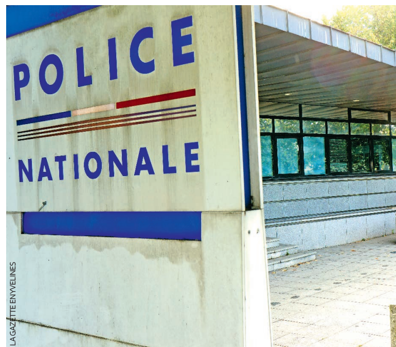
L'enquête a été menée par les effectifs de Mantes-la-Jolie.

Le commissariat de Mantes-la-Jolie vient de clôturer une enquête dont les premières plaintes remontent en août 2014. Une vaste affaire d'escroqueries en bande organisée.