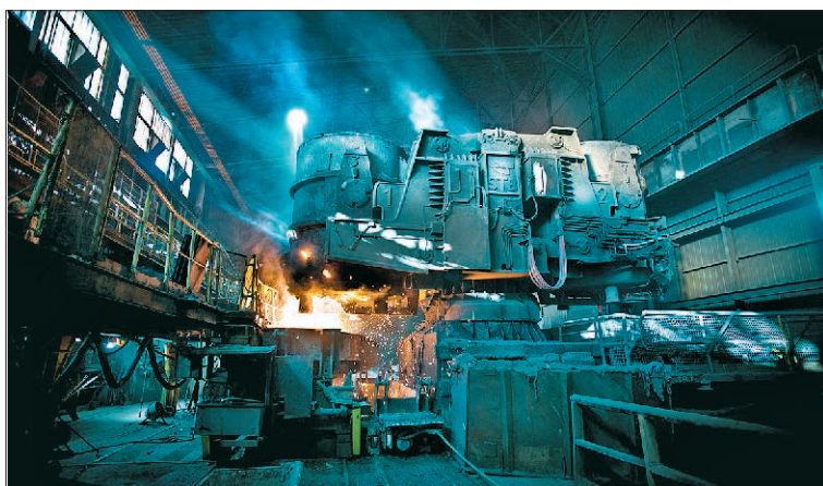
L'usine sidérurgique Iton Seine, la plus ancienne du groupe Riva Acier, emploie 230 personnes.

Elles concernent respectivement la qualité, la maîtrise de l'impact environnemental des sites, et le management de la santé et de la sécurité au travail des salariés.