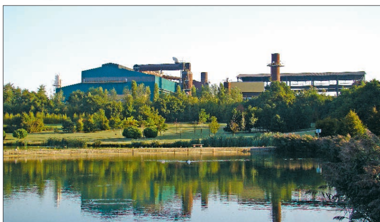
Sur le site ALPA, le processus de réduction des dépenses énergétiques a été engagé depuis longtemps.

La démarche d'amélioration de la consommation d'énergie lancée par le groupe Riva Acier sur ses deux sites de production sera bientôt certifiée par un organisme indépendant.