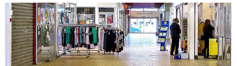
Les copropriétaires doivent diviser en deux ce centre de 6 000 m².

Si Mag 2000 n'a pas fermé à la rentrée, son existence est toujours menacée. La mairie attend le lancement des travaux promis avant l'été.