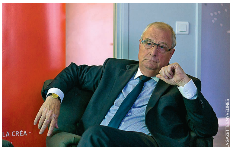
« Nous sommes en train de rompre avec ce que nous faisons par le passé en termes de développement économique. »

dispositifs d'aide, comme avec les structures existantes. Avec l'espoir avoué que cet accompagnement renforcé se répercute sur l'emploi local.