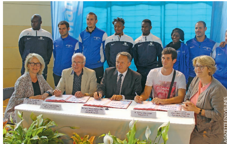
La signature de la convention s'est effectuée au gymnase Pierre Souquet.

Le secrétaire d'Etat au Sports, Thierry Braillard, est venu rencontrer les représentants des club sportifs du Mantois et signer des contrats inscrits dans le plan Citoyens du sport.