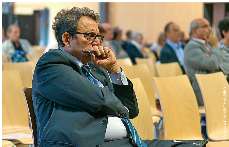
De nombreux élus étaient quelque peu perplexes lors de l'atelier consacré aux finances.