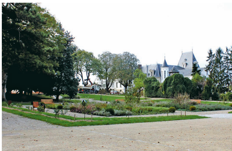
Le parc du Prieuré accueille un musée et la serre de l'Orangerie. Son belvédère offre un point de vue admirable sur la Seine.

Surplombant la Seine et installé dans le château Gévelot, le musée de la batellerie sera lui aussi en accès libre samedi et dimanche. Il sera possible d'admirer également la serre de l'Orangerie, au sein de