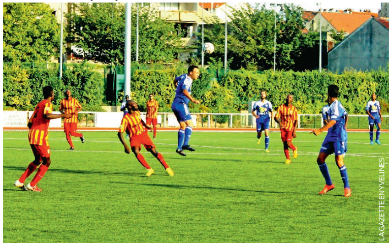
Les Mantais remontent à la sixième place du groupe A.

Après avoir obtenu un match nul face à Poissy, la semaine dernière, les Mantais se sont imposés ce week-end contre Croix (1-0).