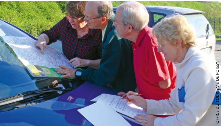
Au fil des énigmes et des questions, les participants évolueront dans les rues de la cité Saint-Louis.

LeSaxorganiseuneDjembésessionlevendredi25mars.Apartirde20h30, musiciens et danseurs pourront se rencontrer autour de la culture traditionnelle de l'Afrique de l'Ouest. Dans un esprit convivial, la jam sera ouverte à toutes les personnes qui peuvent tenir un accompagnement au djembé ou au doundoun. Pour danser, chaque participant est libre de danser comme il veut et quand il veut. L'entrée est gratuite. Un repas traditionnel malien sera proposé à partir de 19 h 30 au tarif de 7 euros, mais les places sont limitées et la réservation est donc indispensable au 01 39 11 86 21 ou resa.lesax@wanadoo.fr