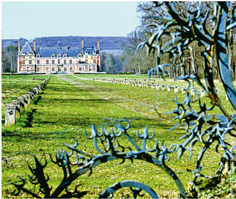
La famille Lebaudy, propriétaire de 1869 à 1955, l’avait restauré avec amour. Il est totalement dépouillé et laissé à l’abandon dans les années 1980 et 1990.

Mis en vente il y a peu, suite aux difficultés de son propriétaire actuel, le château de Sully devrait avoir un nouvel acquéreur d’ici quelques semaines. Les Rosnéens retiennent leur souffle.