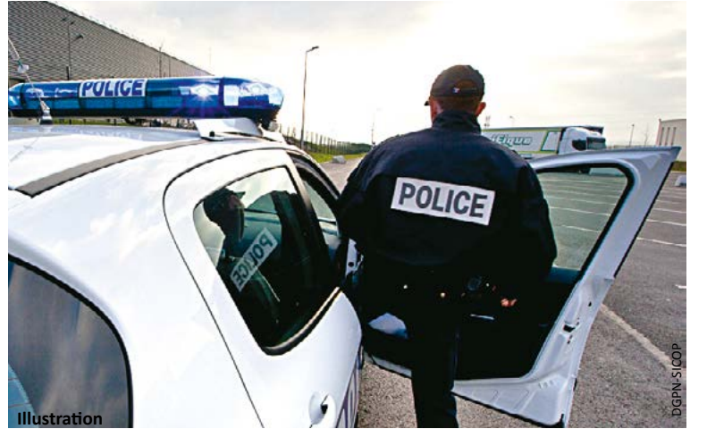
La police nationale a mobilisé 58 agents pour mener à bien l'opération de contrôles.

Le commissariat des Mureaux a mené une vaste opération de contrôles ce week-end. Cela fait suite à l'épisode durant lequel plusieurs policiers avaient été la cible de fétards sur le parking d'un club.