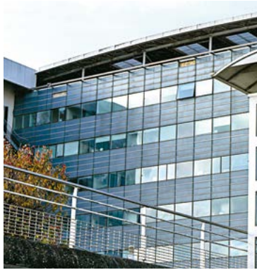
La victime a été prise en charge au centre hospitalier François Quesnay.

Un résident du foyer Adoma a été victime de coups de couteau au visage ainsi qu'à la main.