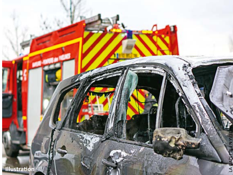
La voiture a été complètement calcinée, ce qui empêche toute identification possible.

Les sapeurs-pompiers se sont déplacés pour éteindre un feu de poubelles puis une voiture en proie aux flammes au sein du quartier du Val Fourré.