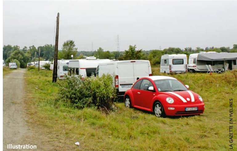
La course poursuite a mené jusqu'à un camp de gens du voyage sédentarisés.

Un homme de 23 ans a été arrêté dans un camp de gens du voyage sédentarisés. Il est suspecté de s'être livré à une course poursuite avec les autorités policières qui a par la suite légèrement dégénéré.