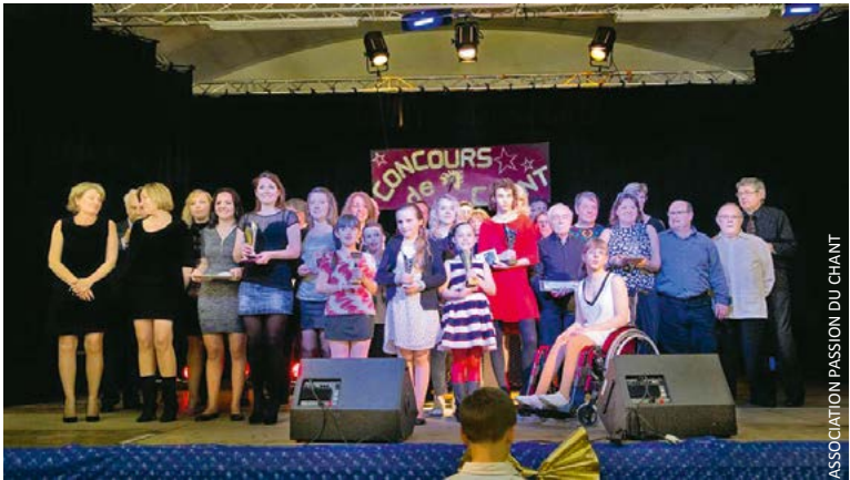
Tous les ans, les participants se pressent en nombre pour participer au concours organisé par Passion du chant. Cette année, il aura lieu le 9 avril.

Le concours de chant de Gargenville est devenu une institution avec des participants qui n'hésitent pas à venir de loin pour participer. L'édition annuelle approche à grands pas.