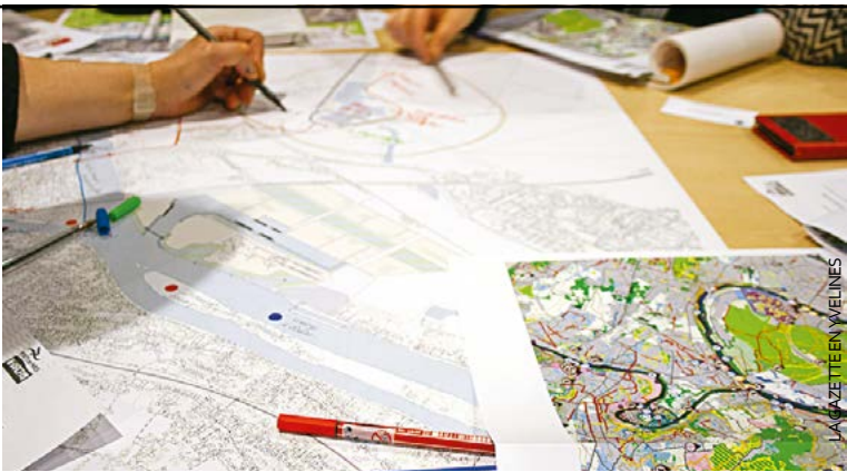
Une trentaine de personnes est venue participer à la table ronde organisée sur la thématique de loisirs, tourisme, liaisons douces et usages partagés.

Si la pollution est un sujet qui préoccupe tout le monde, celui de la préservation des milieux aquatiques et environnementaux