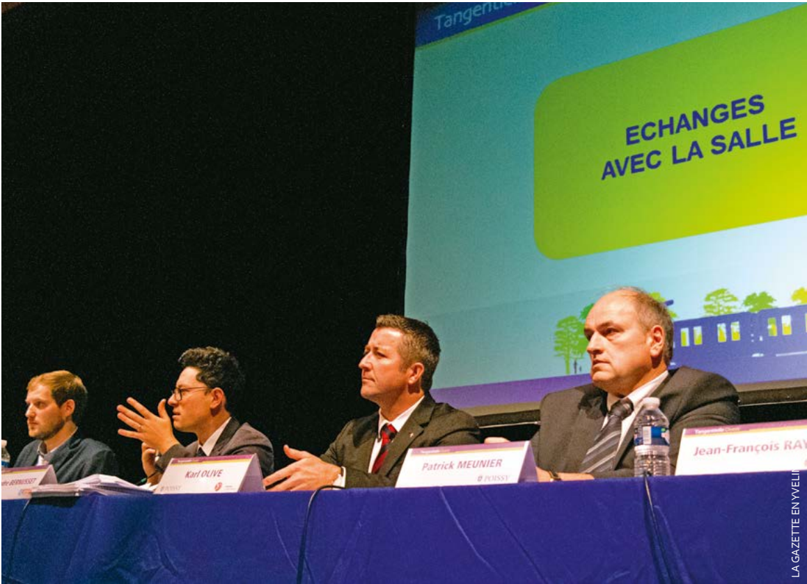
Les riverains ont pu poser leurs questions directement aux porteurs du projet de la Tangentielle Ouest et au maire de Poissy.

Le nouveau tracé urbain de la Tangentielle Ouest est jusqu’au 8 avril en concertation complémentaire pour recueillir l’avis des habitants de Poissy et des communes alentours. Des habitants qui ont pu exprimer leurs craintes lors de la réunion publique du 17 mars.