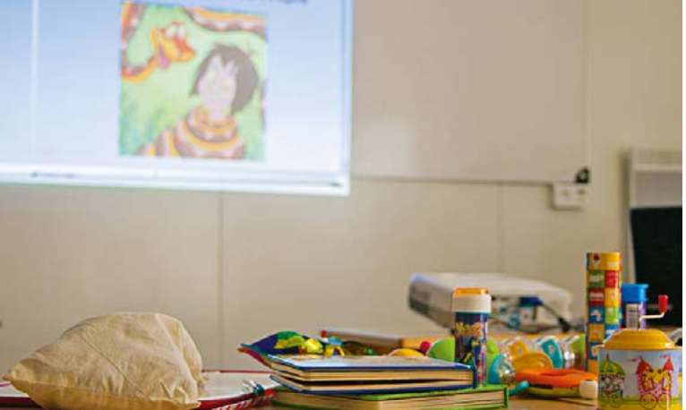
Auprès des enfants, le personnel hospitalier utilise la boîte à distraction pour stimuler les cinq sens et ainsi, réaliser des soins tout en douceur.

Plus de 200 professionnels hospitaliers des établissements de la vallée de Seine se sont réunis pour discuter notamment de la prise en charge de la douleur. A cette occasion, un retour d’expérience a été mené de la part des soignants sur les techniques d’hypnose en milieu médical.