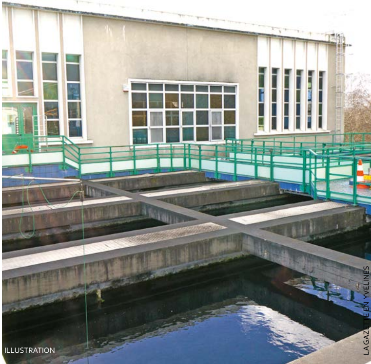
Poissy a négocié avec Suez pour que le prix de la partie production d’eau potable de la facture des utilisateurs baisse de 10 %.

Avec le nouveau contrat passé par Suez et Poissy, les habitants vont pouvoir faire des économies sur leur facture d’eau.