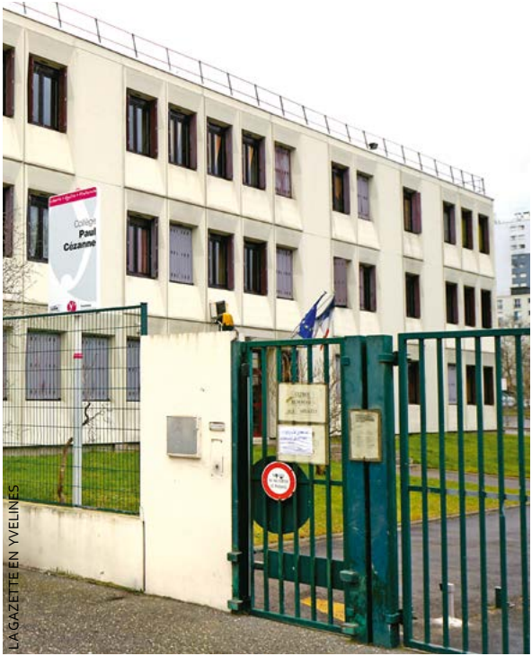
Les collèges Paul Cézanne (à gauche) et André Chénier (à droite) comptent respectivement environ 300 et 250 élèves. Ils fermeront à l’ouverture du nouvel établissement.

Ses 5 700 m² construits selon une conception « bioclimatique » doivent pouvoir accueillir 600 élèves. Le futur collège comprend un externat, une Section d’enseignement général et professionnel adapté (Segpa), une cantine, un amphithéâtre, un patio