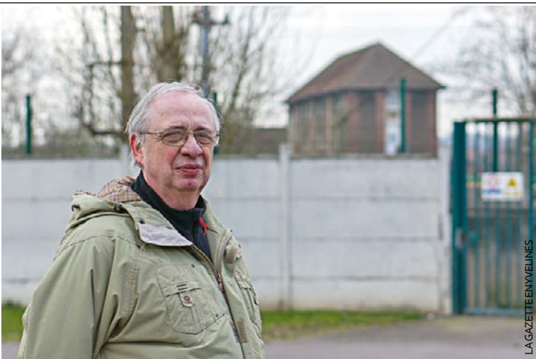
Pour ce natif de Narbonne, le syndicalisme est une affaire de famille.

La modification du territoire est directement liée à l'arrivée du port comme en atteste le remblaiement programmé de l'étang des Fonceaux, à Achères. Depuis des dizaines d'années, celui-ci était le territoire d'une communauté de pêcheurs se réjouissant de la biodiversité présente au sein de l'étang. Aujourd'hui, la centaine de pêcheurs est priée de quitter leurs cabanes car les sept hectares d'eau vont faire l'objet d'un remblaiement pour permettre l'acheminement des camions au site.