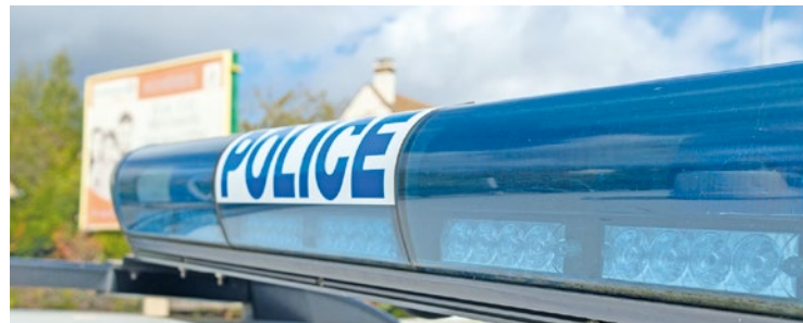
Les vérifications d'empreintes révèlent que la jeune femme est connue sous 7 autres alias.

Le 24 août, trois jeunes Muriatins entrent par effraction dans une pizzeria rue Paul Doumer. Les forces de l'Ordre ont pu interpellé les brigands ainsi que leur butin mais ils n'ont pu être jugés, faute de créneau disponible pour une comparution immédiate.