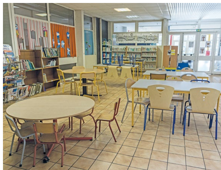
Pour tous les observateurs, élus comme fédérations de parents d'élèves, la situation est jugée « catastrophique » et surtout quasiment jamais vue.

Pour le Val-Fourré c'est l'abondance : 222 millions d'investissements !!! Oui vous avez bien lu... mais comme pour la caserne ce sont pour l'essentiel des réhabilitations payées par les loyers des locataires et des subventions nationales, régionales, départementales ; quant aux projets strictement municipaux ils sont prévus... après 2026 c'est-à-dire une fois les municipales passées. Vous avez bien compris, la politique municipale c'est du cinéma : on nous programme « Que la fête commence » et ça finira par « La Grande Illusion ». ■