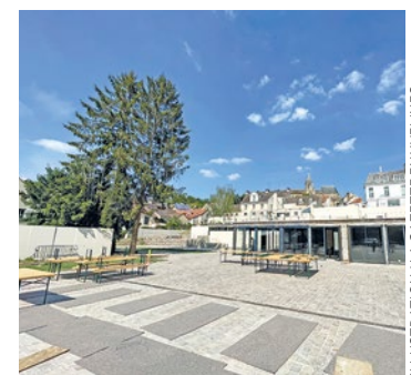
Bien que la place ait déjà accueilli bon nombre de festivités après ses travaux, cette soirée sera l'occasion de l'inaugurer officiellement.

pour proposer une oasis de fraîcheur lors des chaudes journées d'été ». Celle-ci se dote d'une esplanade, d'un espace culturel, d'un restaurant, d'un artisan chocolatier, ou encore d'un nouveau commerce de bouche et d'un brasseur local. Cette soirée sera également l'occasion pour la Ville de célébrer les 56 ans du jumelage avec la commune allemande de Seligenstadt. ■