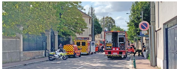
La femme alitée et gravement malade n'a pu être sauvée des flammes.

Le 30 août, un incendie criminel se déclare au 3bis route de Houdan dans un cabinet de dentiste. Si le mari a pu s'extirper des flammes, sa femme n'a pas eu cette chance.