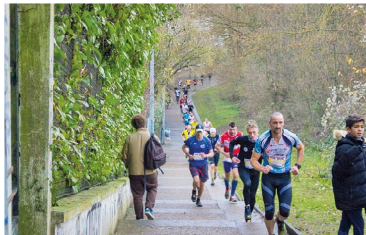
Rendez-vous au stade Auguste Delaune pour le départ de cette journée mémorable.

journée mémorable, à 9h pour la course d'1,5 km, à 9h45 pour les 4,5 km, puis à 10h30 pour les 12 km. L'inscription est obligatoire pour tous les participants : celle-ci peut se faire en ligne (trail-des-loups-2023.onsinscrit.com/accueil.php), ou sur place le jour J avec un supplément de 2 euros. Un certificat médical est nécessaire pour la course de 12km. Pour plus d'informations, vous pouvez contacter l'adresse serge.jegou29@gmail.com. ■