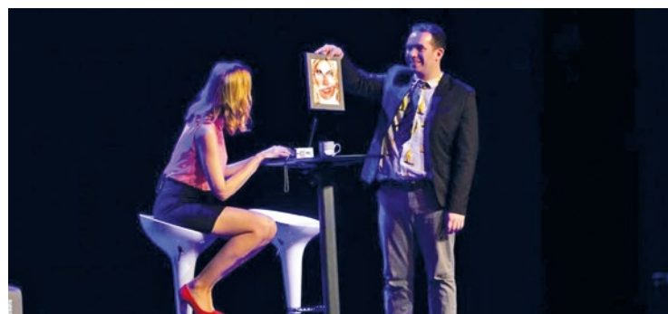
Les tarifs s'élèvent à 10 euros pour les adultes, et à 5 euros pour les moins de 12 ans.

Les tarifs s'élèvent à 10 euros pour les adultes, et à 5 euros pour les moins de 12 ans. L'achat des places s'effectue en mairie, ou bien sur place dans la limite des places disponibles. Pour plus d'informations, vous pouvez contacter le service festivités à l'adresse festivites@mezieres78.fr , ou par téléphone au 01.30.9556.58. ■