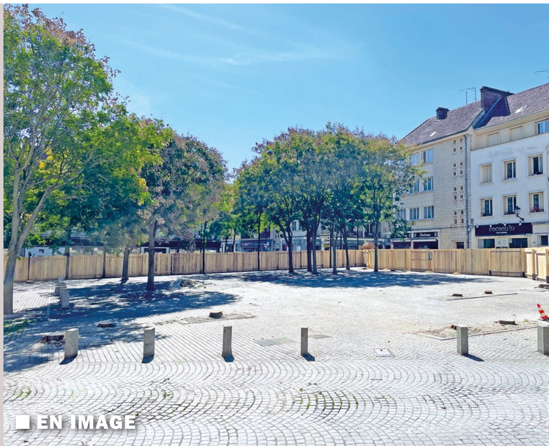
■ EN IMAGE

« Riverains, n'oubliez pas de vous renseigner sur les règles de stationnements mises en place à cette occasion » prévient la municipalité sur son site internet. Une fois sur place, vous pourrez profiter des nombreux stands à disposition, ainsi que de la buvette et du coin restauration, qui seront gérés par les bénévoles du comité des fêtes. Et si vous souhaitez vous-même exposer, le bulletin d'inscription est à retrouver sur le site de la Mairie. ■