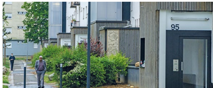
Une réunion publique donnera le top départ de cette concertation, le 21 septembre à 19h au restaurant du complexe sportif Marcel Cerdan.

Une concertation préalable à la transformation du quartier pisciacais sera mise en place du jeudi 21 septembre au samedi 21 octobre.