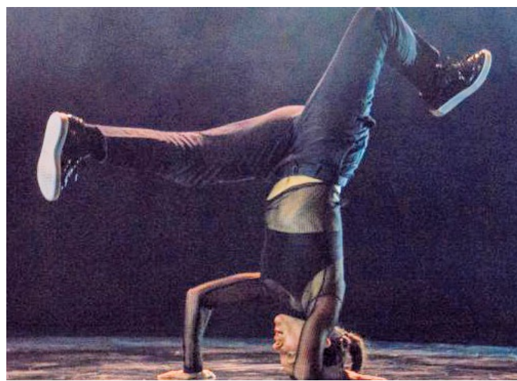
Rendez-vous à 19h pour assister à la soirée, qui sera accessible uniquement sur réservation.

mettra le breakdance à l'honneur avec des battles en 1 contre 1 et 5 contre 5, devant un jury d'experts et au son d'un mix réalisé en live par le DJ Victaz. Des show chorégraphiques et des showcases seront également de la partie entre les différents affrontements. Rendez-vous à 19h pour assister à la soirée, qui sera accessible uniquement sur réservation : il vous suffit de contacter le 01.77.49.28.78 pour accéder à la billetterie. ■