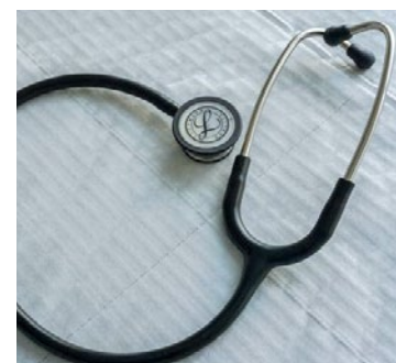
Pour obtenir des renseignements sur la mutuelle communale, rendez-vous au Forum des associations le 9 septembre prochain sur le stand du CCAS.

Pour obtenir des renseignements sur la mutuelle communale, rendez-vous au Forum des associations le 9 septembre prochain sur le stand du CCAS. ■