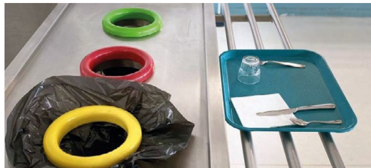
Le personnel de cantine, les animateurs et les services de la Ville ont été formés afin d'organiser systématiquement cette nouvelle forme de tri.

La Ville d'Épône poursuit sa stratégie de développement durable en collectant et valorisant les biodéchets issus de ses cantines.