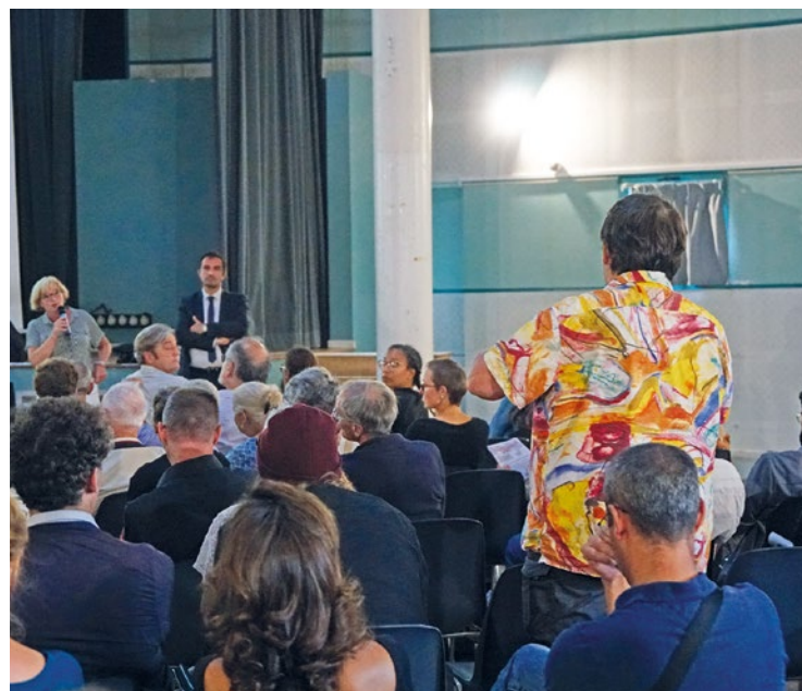
Cette rencontre, qui a rassemblé plusieurs dizaines de personnes, était l'occasion pour le Département des Yvelines de présenter en détail le projet aux riverains.

Les travaux de la future liaison entre la RD30, au niveau d'Achères, et la RD190, à hauteur de Triel-sur-Seine, vont bientôt démarrer. Et ce malgré le dialogue de sourd qui oppose les habitants et le Département. Un projet pour le moins controversé qui provoque l'ire des riverains, notamment à cause du fameux « pont d'Achères » qui traversera la Seine.