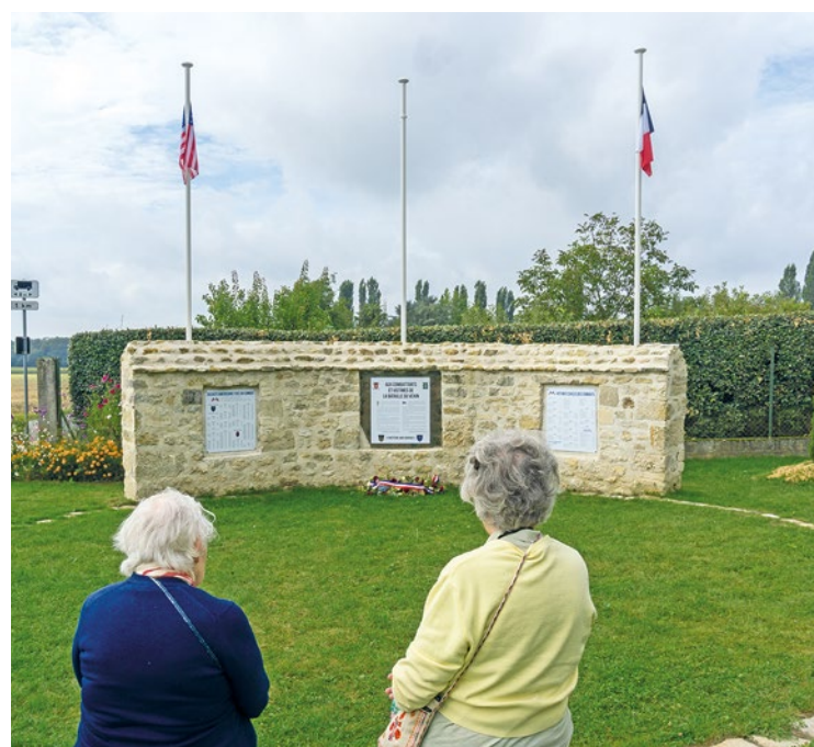
Une centaine de figurants rejoueront la bataille du Vexin, étape essentielle de la Libération des Yvelines.

Durant le week-end du 9 septembre, une commémoration de la bataille du Vexin, bataille mémorable de la libération des Yvelines durant la seconde guerre mondiale. Plusieurs véhicules d'époque seront présents.