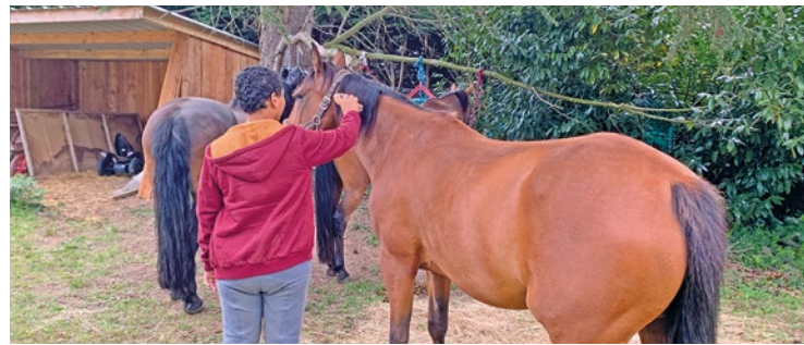
Avec Equiprev, les jeunes reprennent confiance en eux en s'occupant des chevaux.

Toutefois il ne faut pas non plus voir Equiprev uniquement comme une promenade de santé, les canassons pouvant même aider les encadrants. « Par exemple Gucci est très craintif, ce qui est très bien pour les personnes