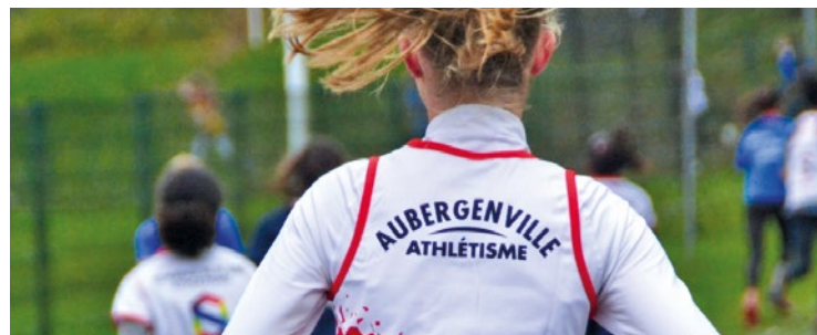
Les deux premiers entraînements seront gratuits pour permettre aux nouveaux de se tester.

Ce mardi 5 septembre, c'est la reprise pour les licenciés du Club Athlétique d'Aubergenville, qui espère poursuivre sa dynamique positive grâce à l'effet JO.