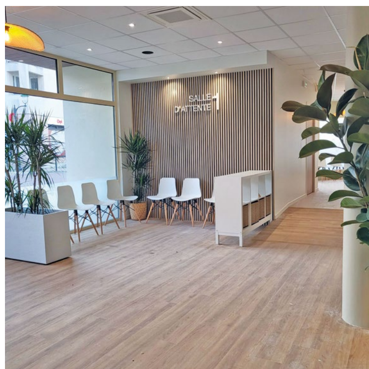
Ce nouveau centre abritera de nombreux professionnels de santé dont un pédiatre, un médecin généraliste, un neuropsychologue, un ostéopathe ainsi que deux infirmières.

Tant attendue par les habitants, la nouvelle maison médicale de Vernouillet devrait ouvrir ses portes à la mi-septembre.