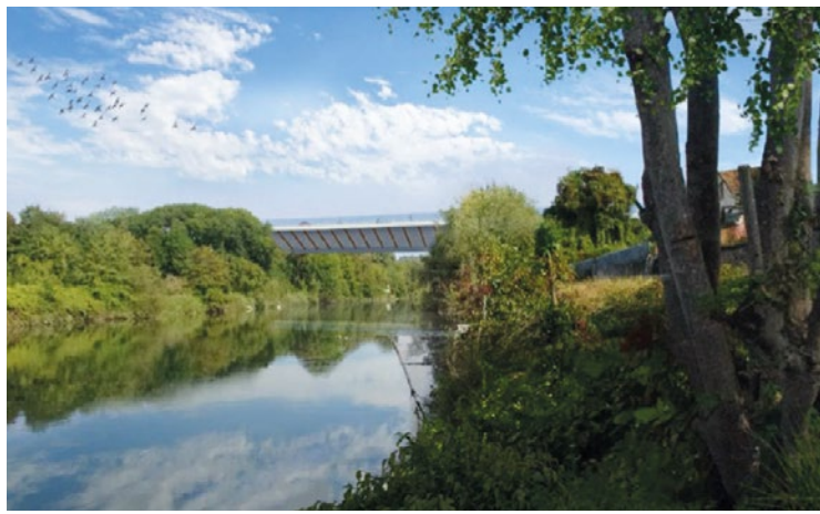
Premières esquisses du pont d'Achères.

À l'arrivée, pas de miracle : cette réunion publique n'aura pas réussi à apaiser les tensions entre deux camps qui paraissent plus irréconciliables que jamais. En témoignent les dégradations constatées dès le lendemain, sur le chemin de halage de Carrières-sous-Poissy : des messages d'opposition au projet ont été appliqués sur plus de 80 mètres, à l'aide d'une peinture permanente. Impossible, donc, de réparer les dégâts sans refaire toute la zone dégradée, ce qui devrait coûter pas moins de 20 000 euros. Un tarif d'autant plus salé quand on sait que cette portion de route a été rénovée pas plus tard que cet été, pour la modique somme de 70 000 euros. Si les pouvoirs publics espéraient une accalmie, nul doute que la gronde est bien partie pour durer. ■