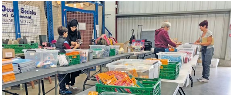
De nombreuses familles franchissaient encore la porte du 151 rue Jean Jaurès à quelques jours de la rentrée, tandis que la vente se poursuit jusqu'à ce jeudi 7 septembre.

Outre les fournitures scolaires, cette vente organisée dans les locaux de l'association muriautaine proposait même de quoi se chauffer, avec des baskets ne dépassant pas 8€, et de quoi se couvrir, en témoignent les vestes de seconde main proposées entre 1 et 3 euros. De nombreuses familles franchissaient encore la porte du 151 rue Jean Jaurès à quelques jours de la rentrée, tandis que la vente se poursuit jusqu'à ce jeudi 7 septembre. ■