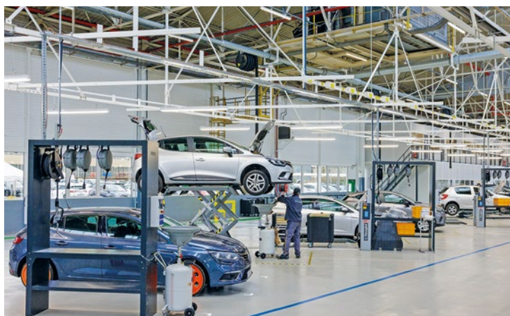
En 10 jours, un véhicule ancien passe par 19 étapes afin de sortir presque comme neuf.

Toutefois il ne faut pas voir cela comme des prestations de bon samaritain. Certes Renault travaille avec ses concessionnaires afin d'éviter d'envoyer trop de véhicules à la casse, mais un montant maxi-