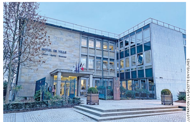
Sur les 4 niveaux de service disponibles, la Ville a décidé de conserver un des niveaux les plus complets. L'enveloppe qu'elle percevra de la part de la communauté urbaine pourrait alors alléger la charge du service sur les foyers mantais en baissant l'impôt.

À lui désormais d'harmoniser ses paroles avec ses actes et de baisser les impôts des Mantais. ■