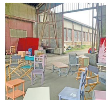
Librairie solidaire, vente de copeaux de carton, réparation de vélo, la friche industrielle du 62 rue de la Haye va devenir une entreprise à but d'emploi.