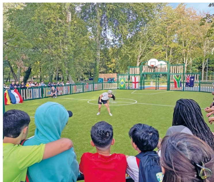
Ce nouveau terrain de sport se situe près du gymnase Coubertin et du collège Jean Zay.