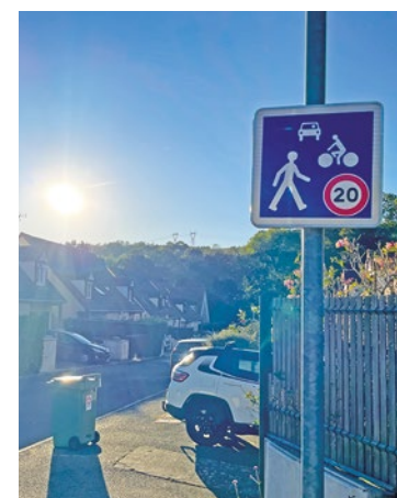
Dans cette nouvelle zone, ce sont les piétons qui auront la priorité sur les cyclistes et les automobilistes, afin de renforcer la sécurité des usagers de la voie publique et de réduire la vitesse de circulation.

municipaux et d'échanger sur les problématiques et leurs idées pour améliorer la qualité de vie dans les différents quartiers de la ville. ■