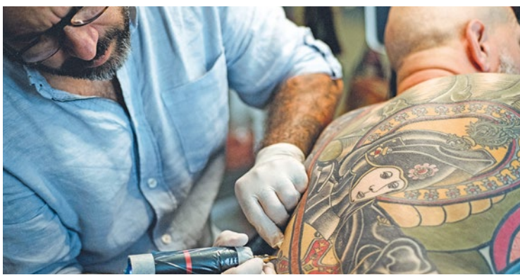
Sa clientèle vient aussi bien de l'Hexagone que des 4 coins du monde afin de bénéficier de ses services de tatoueur spécialisé en dessin de vitraux. En témoigne son voyage à Jérusalem, en juillet, où il est allé tatouer des pèlerins.

Au programme, un tour de France culinaire de la Normandie à l'Occitanie en passant par la Bretagne ou la Savoie. Plusieurs animations sont également prévues comme de la danse, des chansons et des jeux afin que cette soirée soit mémorable. Pour tout renseignement complémentaire, n'hésitez pas à appeler au 06.16.81.37.72 ou en écrivant un mail à soiree21octobre2023@gmail.com . ■