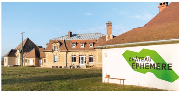
Bien que la soirée soit gratuite et ouverte à tous, il est conseillé de réserver votre place en ligne sur chateuephemere.org .

Viendra ensuite Theodora, qui proposera un live électro pour terminer la soirée avec ses sonorités à la fois mélancoliques et dansantes, organiques et synthétiques. Bien que la soirée soit gratuite et ouverte à tous, il est conseillé de réserver votre place en ligne sur chateuephemere.org . ■