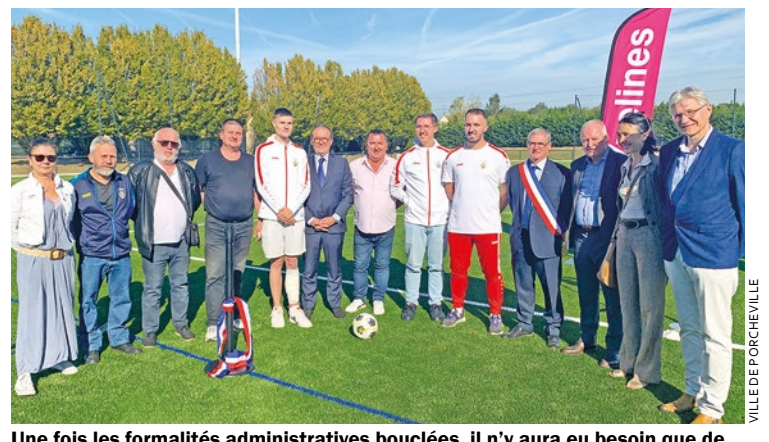
Une fois les formalités administratives bouclées, il n'y aura eu besoin que de 2 mois de travaux, en août et septembre, pour que soit installée la pelouse flambant neuve.

Tant de nouveauté qui ne sont pas passées inaperçues auprès des férus de foot : le FC Porcheville a enregistré une augmentation de 50 % de ses licenciés pour cette nouvelle saison. ■