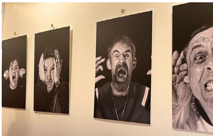
Cette série de portraits de résidents et professionnels posera ses bagages à la mairie d'Ecquevilly du 16 octobre au 3 novembre. L'exposition est gratuite.

de fabrication de sabre laser le 25, ou un concours de costumes le 28. Vous pourrez même vous initier au combat de sabres ! Les places sont limitées, alors rendez-vous sur le site de la ville pour découvrir le programme détaillé, et inscrivez-vous à l'atelier de votre choix via l'adresse mediatheque@carrieres-sous-poissy.fr ou par téléphone au 01 39 22 36 55. ■