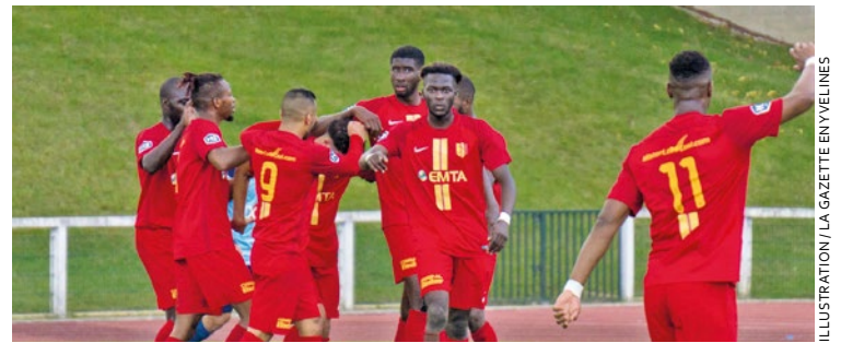
Retour au championnat de R1 ce week-end avec une rencontre face à l'équipe 2 du Paris 13 Atletico.

Aux Mureaux, cependant, on cherche toujours à remporter sa première victoire en National 3. C'est cette fois du côté de Dives Cabourg que les Muriautins se sont cassés les dents : ils reviennent cependant avec un point (1-1). Le premier succès sera peut-être pour le dimanche 22 octobre, date de la rencontre face à Saint-Lô. ■