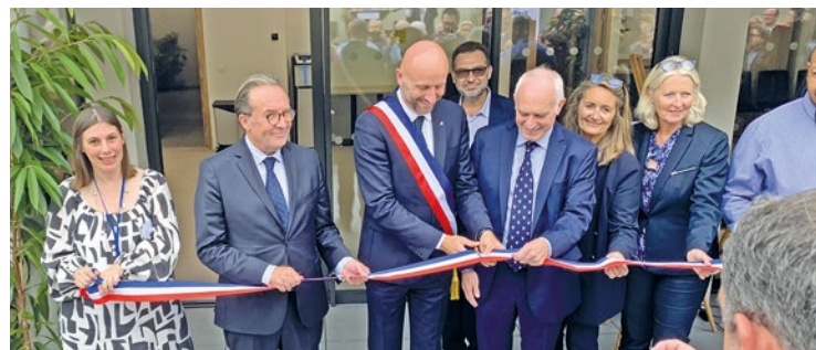
10 millions d'euros ont été nécessaires pour construire l'EANM Hubert François-Dainville.

Il n'est évidemment pas le seul à profiter de l'établissement. Sa capacité d'accueil est prévue pour 58 personnes, répartie de cette manière : 45 places en internat dont 30 destinées à accompagner des adultes déficients intellectuels et/ou psychique travaillant et 15 adultes non travailleurs, 13 places d'accueil de jour dédiées aux adultes non travailleurs. Un endroit où tout est mis en œuvre pour que chacun trouve son équilibre et son bien-être psychique. ■