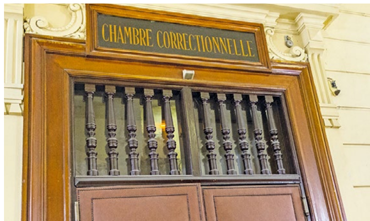
Après plusieurs années d'enquête, le directeur est passé devant le tribunal correctionnel de Versailles la semaine dernière.

Pour les autres faits, le directeur a également nié les faits : « Tout le monde se servait du véhicule, il était utilisé par tous pour le transport des enfants, les courses. Et pour mes amendes, je les payais ! » La procureure a requis une peine d'amende de 10 000 euros dont la moitié avec sursis et l'interdiction d'exercer pendant cinq ans au poste de directeur au sein de cette association alors que la défense de l'accusé a plaidé la relaxe. ■