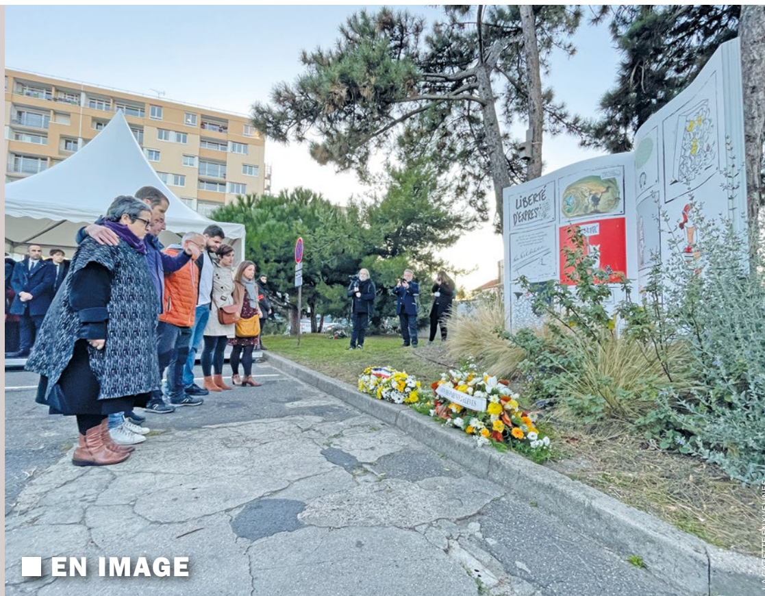
■ EN IMAGE

Les billets ne coûtent que 3€, et l'entrée est gratuite pour les moins de 13 ans. L'intégralité des dons récoltés sera reversée à La ligue contre le cancer du sein ainsi qu'à la Note rose. Pour vous inscrire, rendez-vous sur la page HelloAsso de l'Association Gargenvilloise d'Intérêt Collectif. ■