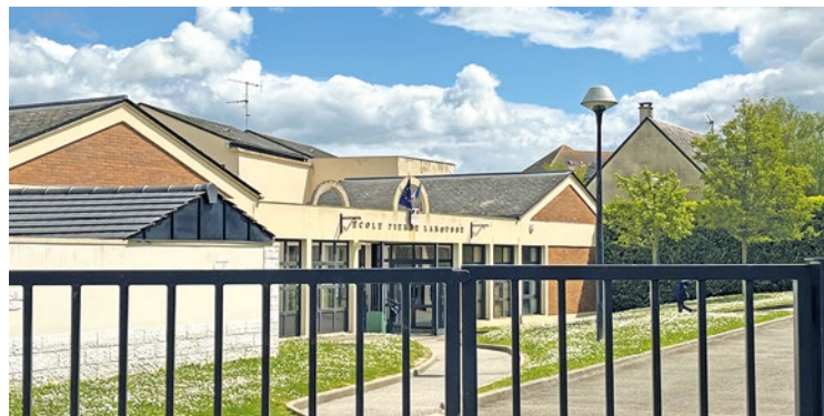
Insultes, coups, Mia a vécu un véritable calvaire durant ses deux mois de scolarisation à l'école Pierre Larousse.

L'équipe municipale appelle donc à la plus grande vigilance et enjoint ses habitants à poursuivre les signalements. D'ailleurs, d'après certains commentaires présents sous le post Facebook indique qu'ils pourraient être finalement 5 ou 6, avec des gilets jaune ou orange. Ils tenteraient de faire la même chose sur la commune de Chanteloup-les-Vignes. ■