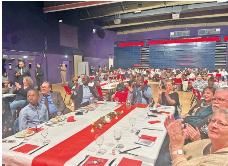
Depuis 10 ans, École & Culture aide les jeunes des alentours à trouver leurs voies professionnelles.

Dix ans, ça se fête, non ? En tout cas, du côté de l'association École & Culture, on compte bien mettre les petits plats dans les grands pour cette grande occasion.