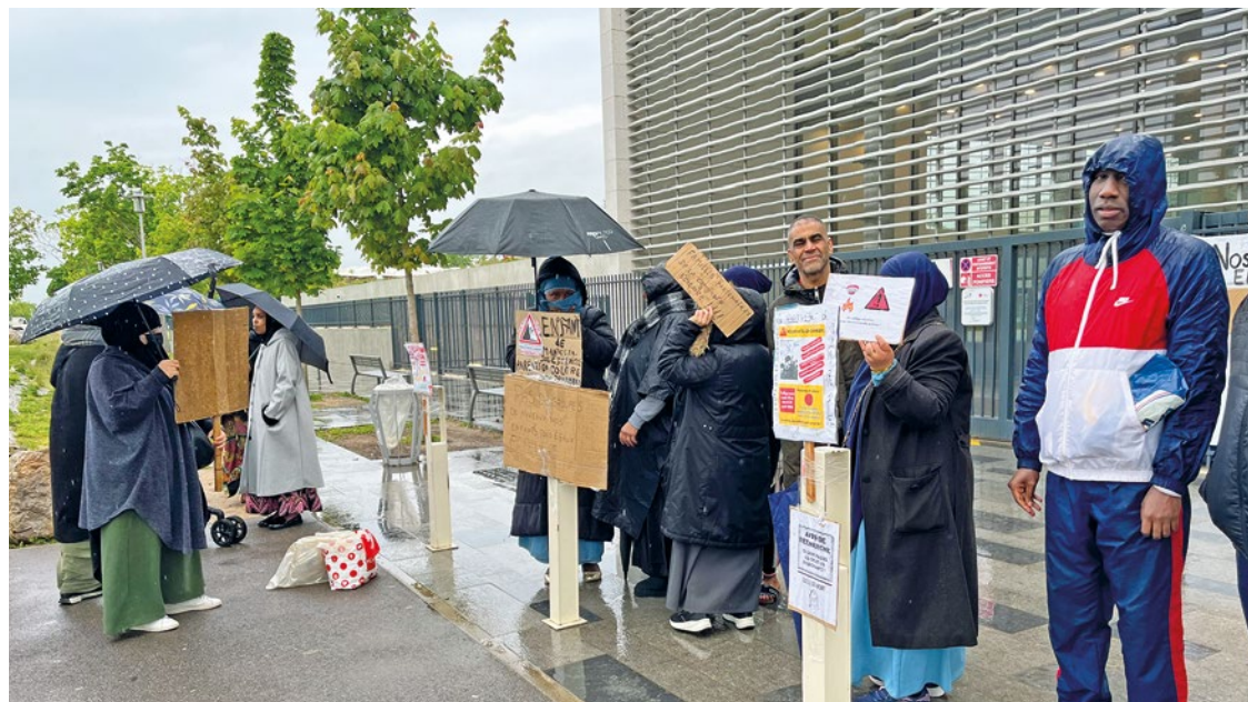
Après février, une nouvelle action « collège mort » était organisée le 29 et 30 avril à l'appel des représentants de parents d'élèves.

L'appel des représentants d'élèves a été bien entendu puisque le 29 avril, il n'y avait qu'une soixantaine de collégiens dans l'après-midi, tandis que le lendemain, ce chiffre ne montait qu'à une centaine. « Nous savons que nos quartiers sont difficiles, mais je suis persuadée qu'une co-construction entre la direction et les familles permettrait d'avoir de bons résultats » résume une maman. ■