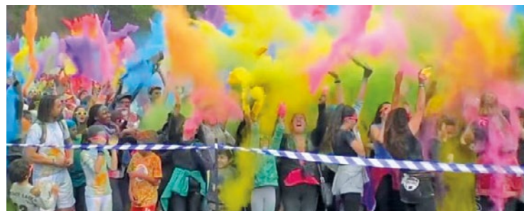
Un échauffement collectif sera donné à 15h45 avant le grand départ à 16h.

Un échauffement collectif sera donné à 15h45 avant le grand départ à 16h. Après la course, un set musical clôturera la journée avec DJ Roof, Conflanais et ancien sportif de haut niveau. ■