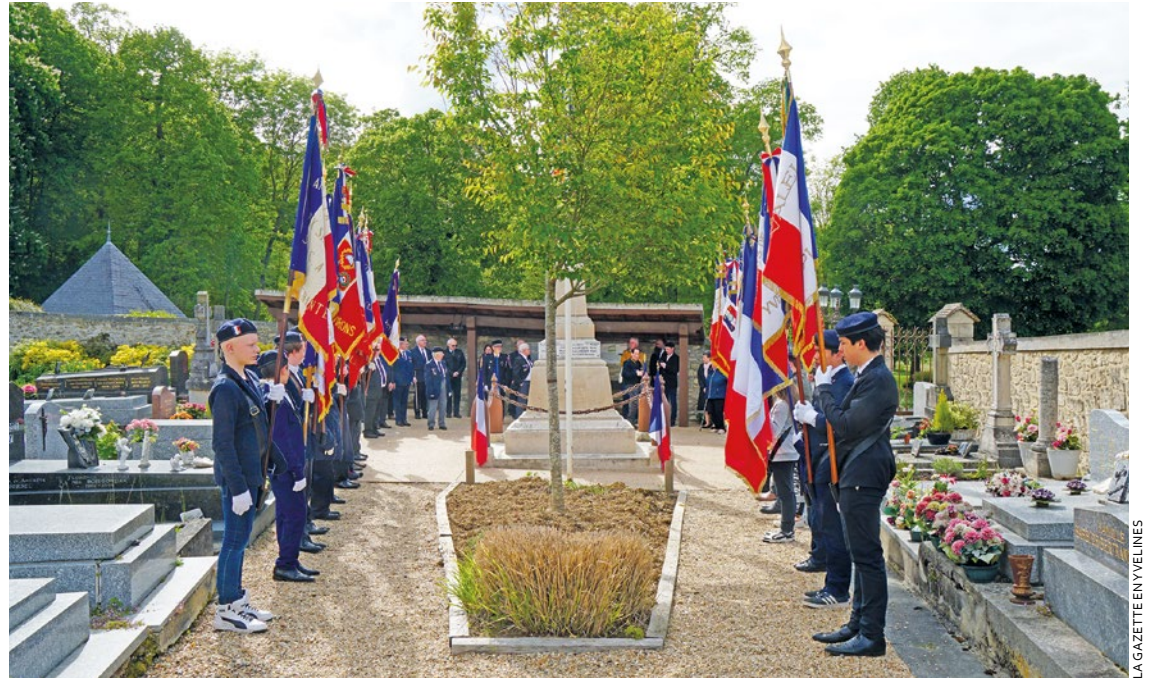
C'est sous le regard plein de fierté des parents que les porte-drapeaux en herbe se sont dirigés vers le cimetière et le monument aux morts, pour une cérémonie exécutée en conditions réelles.

Après la théorie et la distribution de leur béret et de leurs gants – indispensables pour un bon porte-drapeau –, les participants sont passés à la pratique avec le