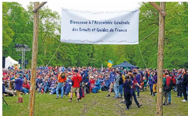
De nombreux stands et conférences ont ainsi été déployés tout le week-end sur le sujet, afin d'alimenter cette prise de conscience collective, mais aussi de parfaire l'accompagnement des guides en prenant en compte cette problématique.

c'est sa double capacité d'à la fois transposer les jeunes dans un autre univers, dans la forêt autour d'un feu avec ses amis, mais aussi de leur apprendre des compétences qui vont leur être utiles dans le monde pour être en confiance, en résilience, pour qu'ils retrouvent du plaisir là où ils en ont perdu. Car si c'est juste pour créer une bulle hors du temps, ça ne marchera pas, ça leur offrira juste un répit, mais derrière, ils vont replonger dans les galères ». En tout cas, le confinement semble avoir été un déclencheur pour de nombreuses familles : depuis le Covid, ce sont pas moins de 10000 adhérents qui ont rejoint les Scouts et guides de France. ■