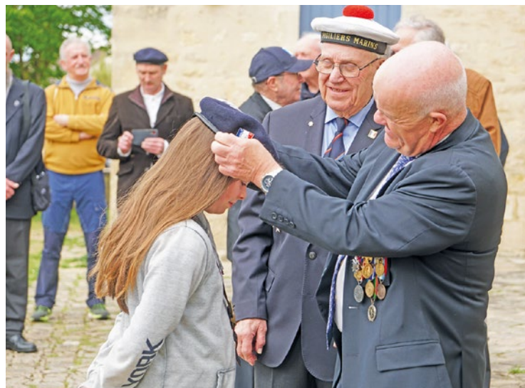
Après la théorie et la distribution de leur béret et de leurs gants, les participants sont passés à la pratique avec le maniement des étendards, aux côtés des anciens.