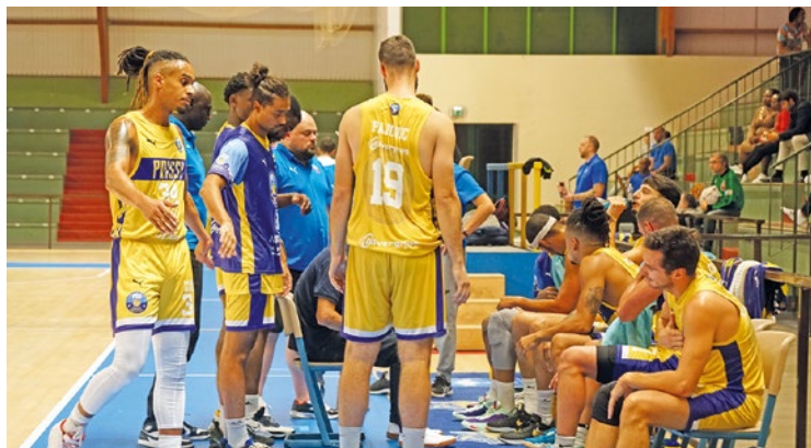
À l'arrivée, les Yvelinois bouclent la saison à la 6 ème place de la poule C, avec 7 victoires et 6 défaites.

À l'arrivée, les Yvelinois bouclent la saison à la 6 ème place de la poule C, avec 7 victoires et 6 défaites, à seulement 1 point d'une place permettant le maintien. Un dénouement d'autant plus cruel qu'il s'est déroulé devant un public venu en nombre : l'entrée était gratuite pour le match le plus important de l'année. ■