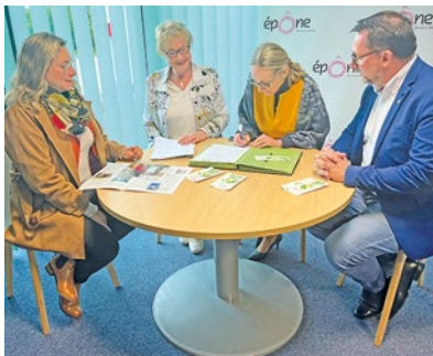
Depuis 2022, la Ville d'Épône a mis en place une charte éco-responsable à destination des entreprises locales.

Toutes ces actions ont permis à Foxy Graph de signer le 30 avril la charte C3E mise en place en 2022 par la Ville. Cette charte éco-responsable de bonnes pratiques leur permettra durant deux ans de bénéficier d'un accompagnement adapté, toujours dans l'optique de raver la norme ISO 26000. ■