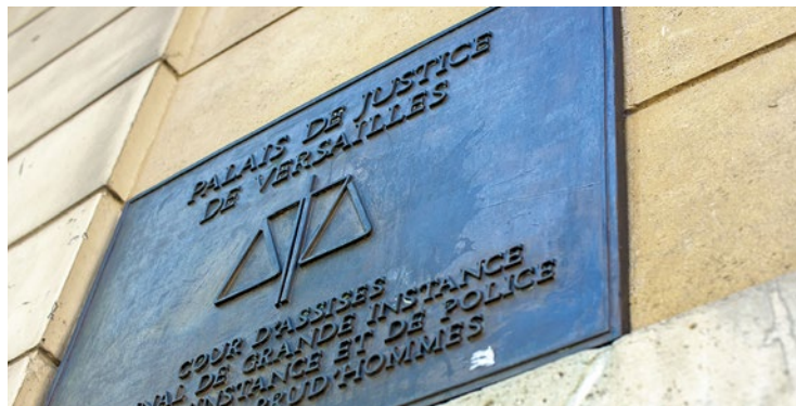
Durant l'audience, le presque cinquantenaire utilise la panoplie du mari violent cherchant à se dédouaner.

Il insiste également qu'il préfère revenir la voir afin qu'elle ne devienne pas hystérique à cause de sa consommation de cannabis. « Elle devrait être également dans le box des accusés » scande l'homme de 47 ans. Le président de la cour ne se laisse pas avoir et le condamne à 20 mois de prison dont 8 avec sursis. ■