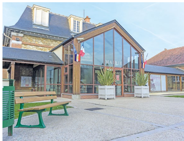
La Ville insiste sur sa volonté de placer les habitants « au cœur de l'action municipale ».

pour y réfléchir dans le cadre du tout premier budget participatif initié par la Mairie de Vernouillet.