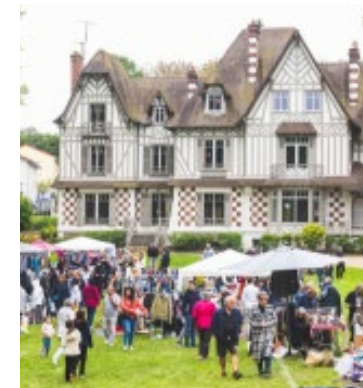
Si vous avez besoin de faire le tri chez vous, il est toujours possible de s'inscrire en tant qu'exposant lors du vide-grenier.

auprès du guichet unique aux horaires d'ouverture jusqu'au samedi 18 mai. Derniers prérequis : une pièce d'identité, un avis d'imposition au nom et prénom de l'exposant, et une carte grise du véhicule qui accèdera au site le jour J. ■