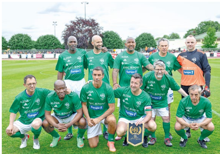
Le Variétés s'est finalement imposé 4-1 dans une ambiance chaleureuse.