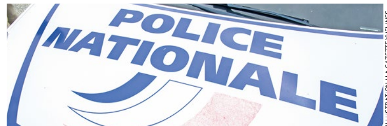
Arrivant rapidement sur les lieux, les forces de l'ordre réussissent donc à coffrer le voleur. Il expliquera son geste à cause de sa précarité.

Le 11 décembre 2023 puis le 30 avril dernier, un étranger de 23 ans a cambriolé l'appartement d'un septuagénaire. Une récidive qui a permis à la police de lui mettre la main dessus. Il a été condamné par le tribunal de Versailles à 12 mois d'emprisonnement ainsi qu'une interdiction de territoire pour 10 ans.