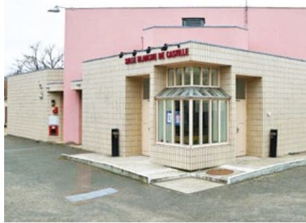
VILLE DE POISSY

Le Conservatoire de Poissy prendra le relais les 1 er et 2 juin, avant que vienne le tour de la troupe Venapaje, des Jeux dits de la Bruyère, puis enfin de la compagnie L'Aventurine et de La comédie de la vie. Pour retrouver le programme dans son intégralité, rendez-vous sur le site de la municipalité (ville-poissy.fr). ■