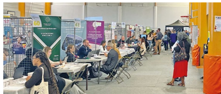
La semaine prochaine, des offres seront accessibles au sein de deux salons de l'emploi, un organisé en physique, et l'autre en ligne.

Le lendemain, la Ville de Poissy lancera de son côté l'édition en ligne de son Tremplin pour l'emploi. Alternances, jobs d'été, CDD, CDI, intérim... Il y aura des offres pour tout le monde, dès le 15 mai via le site de la municipalité (ville-poissy.fr). ■