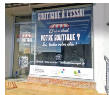
FÉDÉRATION NATIONALE DES BOUTIQUES À L'ESSAI

Secrétaire médicale de formation, Nadège rêvait de devenir fleuriste depuis l'enfance. En 2020, elle décide de passer son CAP fleuriste puis lance son activité pour des prestations d'événements où elle travaille depuis son domicile. Elle tenait