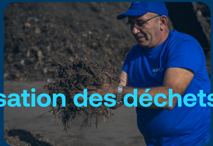
Valorisation des déchets