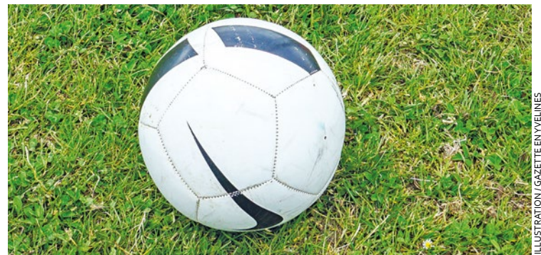
Arrêté le 23 mai, le Limayen nie d'abord les faits durant son audition, évoquant « des indemnités de bénévoles en liquide » mais il finit par reconnaître les faits.

À l'issue de la mesure de sa garde à vue, le quarantenaire est remis en liberté et devra se rendre au tribunal pour une comparution sur reconnaissance préalable de culpabilité le 1 er juillet et à une convocation par officier de police judiciaire le 22 octobre. ■