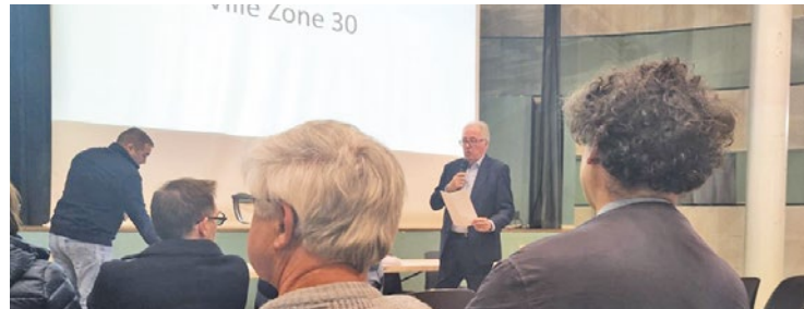
Pas de trottinette ni vélo électrique en libre-service dans Achères. Les habitants ont voté « contre » à 66,5 %.

Depuis Novembre 2023, les habitants d'Achères pouvaient répondre à la question « Pour ou contre des trottinettes et vélos électriques en libre-service » sur l'application Achères et vous. Le « non » l'a emporté à hauteur de 66,5 %.