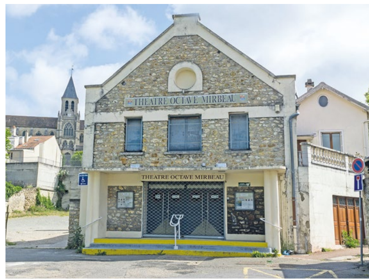
L'entrée est proposée à 10 euros en tarif plein, et 5 euros en tarif réduit.

mercantilisme des dirigeants dans ces conflits, la violence à l'endroit de la jeunesse, la position parfois peu enviable de la femme dans notre société et surtout l'amour et le quotidien tumultueux des rapports amoureux. Tour à tour véhément et sarcastique mais aussi tendre, admiratif et toujours enclin à la rigolade, Boris Vian apparaît ici sous un jour à la fois intense, sérieux et immanquablement drôle. Pour réserver, cela se passe par téléphone auprès du service culture de la commune, au 06 19 45 36 06, ou par mail à l'adresse culture@triel.fr . ■