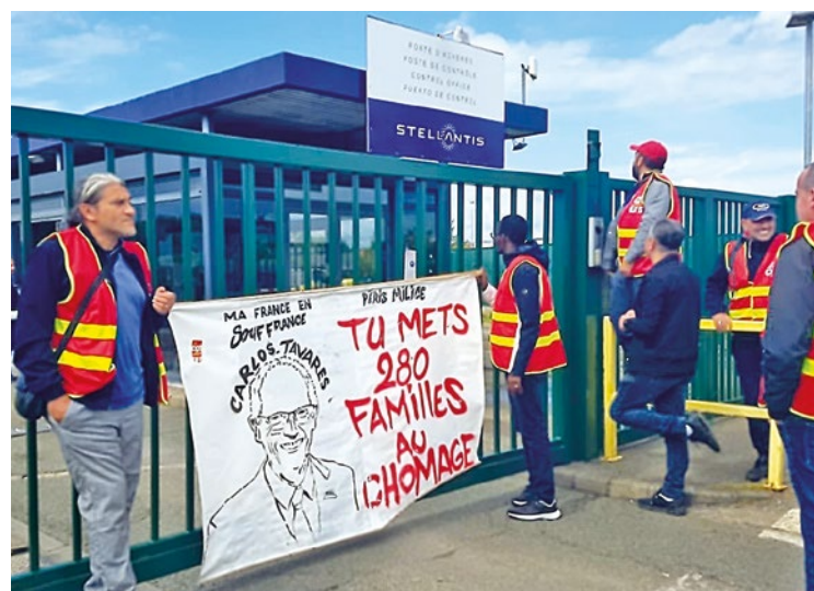
Les membres de la CGT MA France ont trouvé portes closes lors de leur arrivée au siège de Stellantis.

France ont fait entendre leur voix du côté de Poissy, devant les grilles du siège pisciacais de Stellantis,