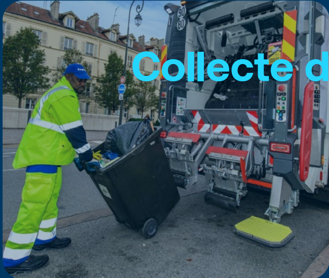
Collecte des déchets