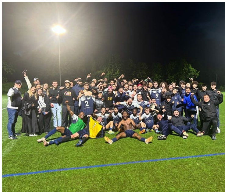
Avec 47 points, Le FCVO est assuré de boucler la saison à la tête de la poule A de D3, tandis que la dernière journée se déroule ce dimanche 2 juin.

L'équipe senior du FCVO est promue en D2, après son match à domicile face à Rosny-sur-Seine. Avec 47 points à une journée de la fin, ils ne peuvent plus être rattrapés en tête de la poule A de D3.