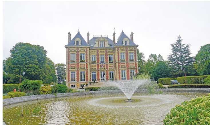
L'affaire pourrait se poursuivre devant le tribunal judiciaire de Versailles car un commissariat enquête sur des cas de harcèlement moral au sein de la Mairie.