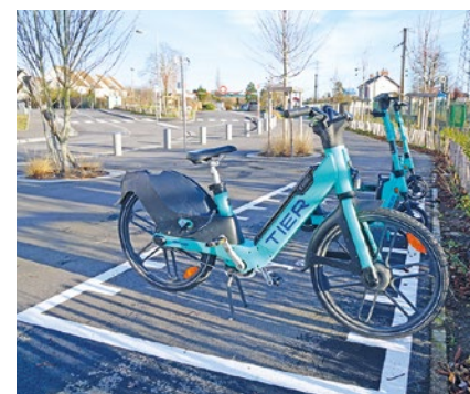
597 utilisateurs uniques ont été recensés sur l'année dans la commune, pour un total de 4496 kilomètres parcourus.

mètres par trajet. Sur une même distance, une voiture essence aurait émis 562 kg de CO 2 . Des chiffres plutôt positifs pour un lancement, bien que le dispositif soit toujours la cible de critiques venant de riverains agacés par la prolifération de ces nouveaux modes de déplacement sur l'espace public. ■