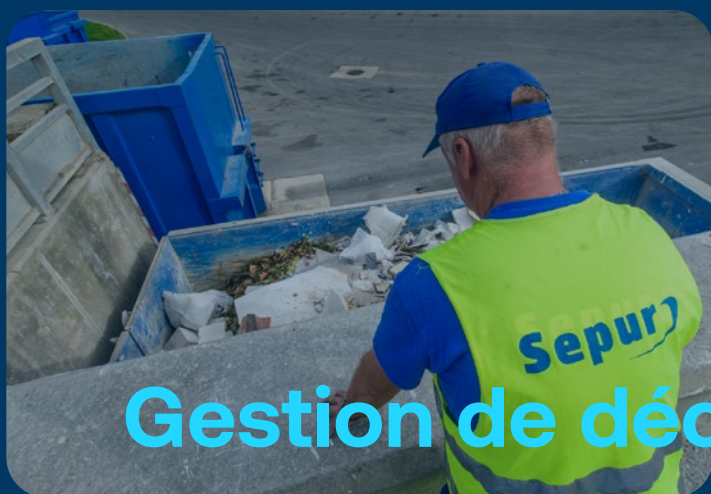
Gestion de déchetterie