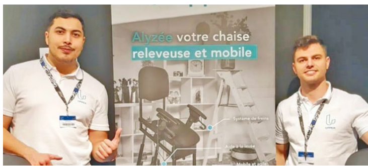
La chaise est éligible à l'allocation personnalisée d'autonomie (APA) et à la prestation de compensation du handicap (PCH).

Son fonctionnement est simple. Pour que la personne assise dans le siège puisse se mettre jusqu'à 45 degrés par rapport à la position standard, elle doit enclencher les freins présents sur les roues arrière