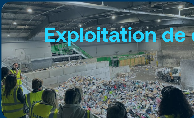
Exploitation de centres de tri