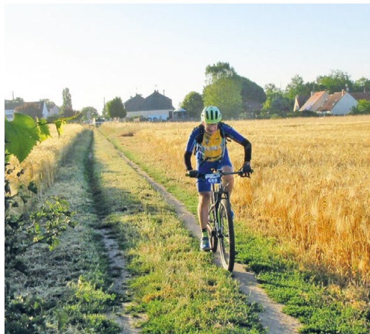
Les tarifs vont de 7 à 10 euros pour les licenciés, et de 9 à 12 euros pour les non licenciés.

Les inscriptions peuvent se faire en ligne sur le site de l'association ( www.helloasso.com/associations/velo-club-issou/ ), ou directement sur place lors de la phase de départ. Les participants partent juste après leur inscription, durant cette tranche horaire. ■