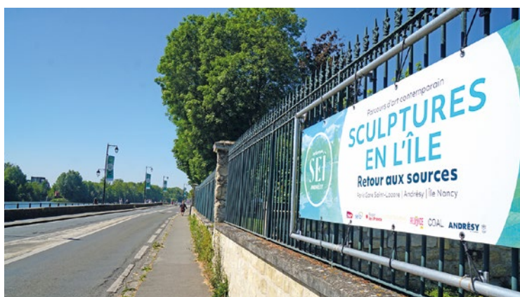
Sculptures en l'île représente pas moins de 120 000€ de budget pour la commune, soit 1/6 ème de l'ensemble des économies à effectuer pour sauver les finances de la Ville.

22h au parc du château. Pour faire partie des artistes de ce spectacle participatif, un jeu-concours est disponible jusqu'au 26 mai sur l'application « Rosny-sur-Seine, ma ville ». Enfin, le bouquet final aura lieu sous les coups de 23h, avec un spectacle de 200 drones qui illumineront le ciel rosnéen. ■