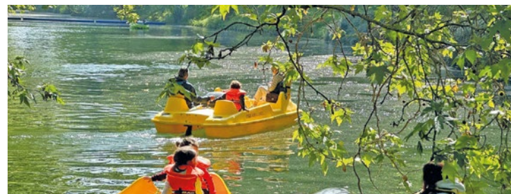
Comme lors de chaque fête de la nature, les balades en pédalos sur l'étang du parc Meissonier ont fait fureur.

Comme lors de chaque fête de la nature, les balades en pédalos sur l'étang du parc Meissonier ont fait fureur : il y avait 1 h d'attente, l'après-midi, pour embarquer sur l'eau et profiter du beau temps printanier. Un « succès fou » pour la Ville et une bien belle après-midi pour les Pisciacaises et Pisciacais à la main verte. ■