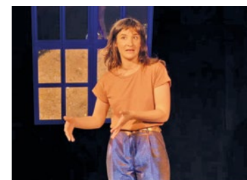
Dans son spectacle, l'artiste se confie difficilement sur de nombreux sujets personnels et sensibles.

La bande dessinée « Quand je serai grande, je serai Patrick Swayze » liée au spectacle aura aussi droit à une suite, comme elle nous l'a confié. Aussi, animée par de nombreux projets, elle écrit actuellement une série audiovisuelle traitant du thème de la crise de la quarantaine. ■