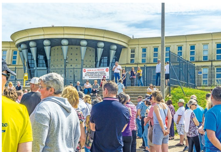
Avant la concertation de l'État, la Ville organise son propre débat public au gymnase Marie-Amélie Le Fur ce vendredi 31 mai.

Avant cette date, il invite les Magnanvilloises et Magnanvillois au gymnase Marie-Amélie Le Fur pour organiser son propre « grand débat public », ce vendredi 31 mai. Organisé à partir de 19h30, il rassemblera élus et habitants du territoire pour « un vrai tremplin démocratique » qui doit permettre d'ouvrir le débat et le dialogue. Pour ensuite en faire le compte-rendu à l'État, malgré un dialogue qui semble plus rompu que jamais. ■