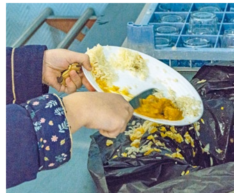
Les biodéchets sont déversés dans des seaux qui sont ensuite vidés dans des bacs extérieurs fermés.

les semaines par le prestataire en charge de la collecte qui assure leur valorisation sous forme de compost. « Le résultat de cette opération bénéficie aux agriculteurs, aux paysagistes et aux particuliers », précise la municipalité. ■