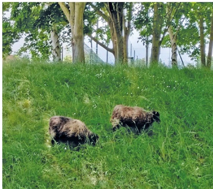
Cette méthode est de plus en plus utilisée dans une variété d'espaces, des parcs municipaux aux terrains d'entreprise et aux espaces verts des universités.

2 nouveaux moutons ont pris leurs quartiers dans un enclos de la commune pour proposer une alternative durable à la tonte traditionnelle, à deux pas de la rue... du Pré-aux-Moutons.