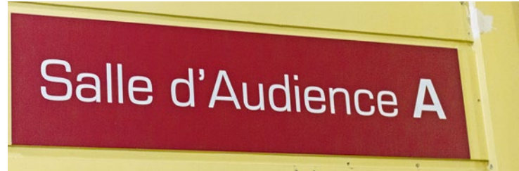
Les 5 victimes devront être indemnisées à hauteur de 2 000 euros chacune.

Entre février et avril, trois hommes procédaient à des vols à la fausse qualité avec un modus operandi bien ficelé. Toutes les victimes appartenaient au quatrième âge. Toutefois, leurs larcins ne leur ont rien rapporté hormis 6 à 18 mois de prison.