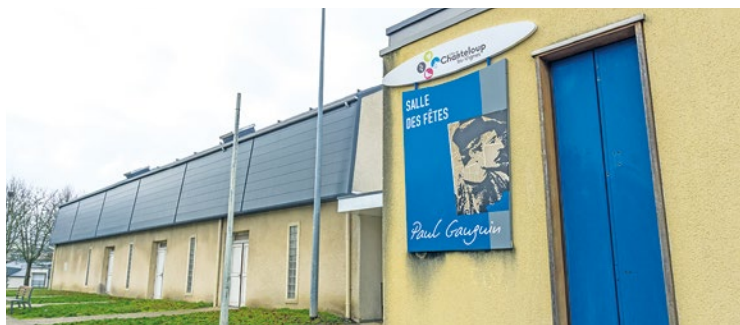
Si la majeure partie de ces représentations se feront sur invitation, des dates sont bel et bien ouvertes à tous, comme le spectacle « L'enfant de la lune », le dimanche 23 juin à 13h30 à l'espace culturel Paul Gauguin.

Si la majeure partie de ces représentations se feront sur invitation, des dates sont bel et bien ouvertes à tous, comme le gala de danse de l'AVEC, le samedi 8 juin à 18h au Phénix, et le spectacle « L'enfant de la lune », le dimanche 23 juin à 13h30 à l'espace culturel Paul Gauguin. Pour retrouver le programme dans son intégralité, rendez-vous sur le site de la Ville ( chanteloup-les-vignes.fr ). ■