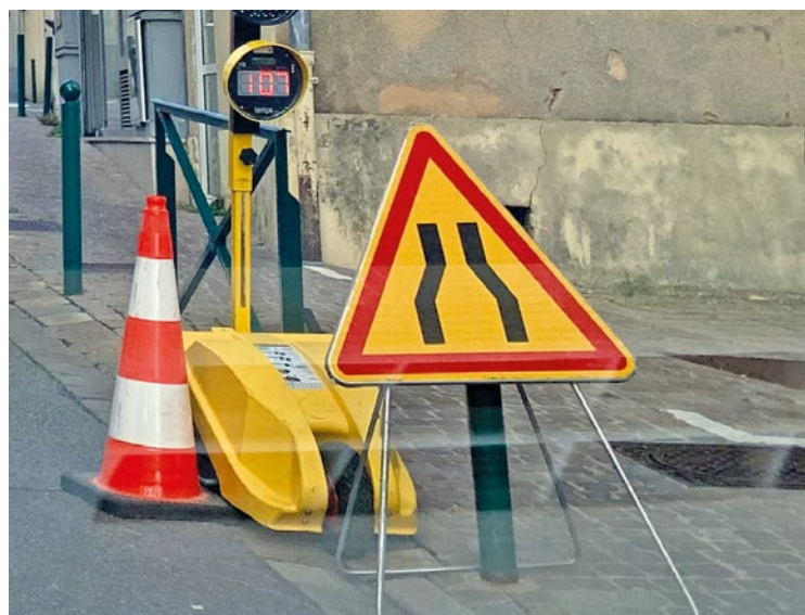
Des chantiers sont lancés dans les secteurs des Cèdres, de l'hôtel de Ville et des Brosses.

Enfin, dans le secteur des Brosses, des travaux sont prévus à Mantes-la-Ville, boulevard Roger Salengro, à l'intersection de la rue des Pincevins et la rue de l'ouest. Une restriction de circulation sur une voie est prévue avenue de l'Europe, à l'approche du carrefour, à partir du 8 juillet pour une durée de 45 jours. ■