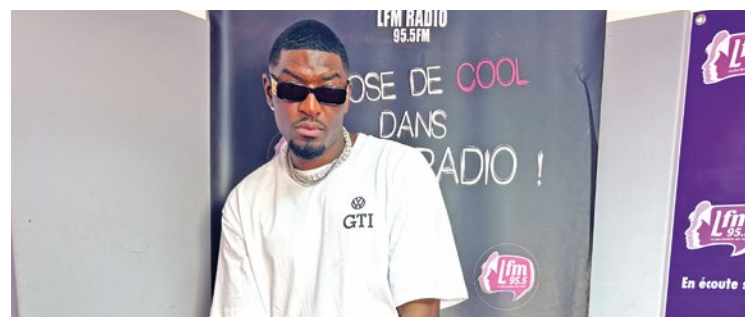
Stone flexance enchaîne ses concepts de plus en plus novateurs, de ses freestyles « La cabine » en passant par le « Flexance TV Show ».

« Level up » du lundi au vendredi de 16h30 à 19h30 sur les ondes du 95.5 FM présentée par Popo.