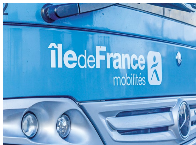
Dans la nuit du jeudi 30 au vendredi 31 mai 2024, un bus Mercedes-Benz « Citaro » était dérobé dans le dépôt de la société RC Mantois. Par la suite, ce véhicule est localisé à Pacy-sur-Eure (Eure).

Durant son procès, le jeune homme de 18 ans a expliqué ses motivations : « Se faire un peu d'argent pour en profiter par la suite. » Des propos qui n'ont pas dû plaire au juge présent lors de cette audience puisqu'il a été condamné à 18 mois de prison avec incarcération immédiate et une interdiction du territoire yvelinois pendant 5 ans à sa sortie. ■