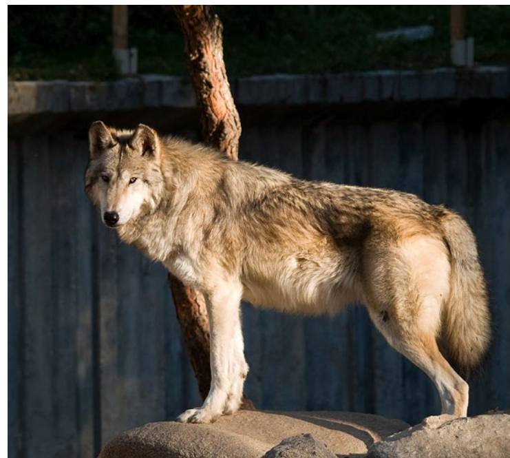
Alors qu'elle passait le week-end au zoo de Thoiry avec sa mère et sa fille, une femme de 37 ans a été attaquée par des loups Mackenzie.

« Elle espère que son cas serve à établir des standards suffisants en matière de sécurité dans ce parc animalier pour que plus jamais cela ne se reproduise », a déclaré Me Ouhioun au Parisien. ■