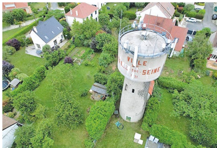
Sur les 2100 m 3 d'eau qui alimentent quotidiennement la ville de Triel, 1700 m 3 viennent du château d'eau de Pissefontaine.

C'est pour cette raison que la communauté urbaine Grand Paris Seine et Oise (GPSEO) entreprend, en collaboration avec la municipalité de Triel-sur-Seine, des travaux de rénovation depuis le mois d'avril. Ce chantier, qui nécessite un investissement de 850 000 euros, va permettre la création d'une station de pompage le long de l'avenue de la forêt pour alimenter les réservoirs de l'Hauttil, ainsi que la rénovation des cuves du château d'eau. D'autres ouvrages similaires sont concernés : suite au diagnostic du réseau d'eau potable réalisé par GPSEO en 2017, il est apparu que 10 réservoirs d'eau nécessitent des travaux de rénovation. 5 en bénéficieront en 2024, et 5 autres en 2025. ■