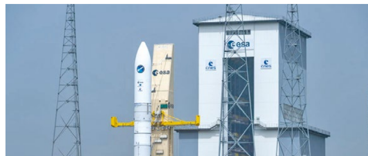
Le lancement est prévu entre 20h et 23h (heure française) à Kourou, en Guyane.

Léo Lagrange des Mureaux, dans la ville où la fusée a été en partie conçue et assemblée. Celui-ci doit être effectué entre 20h et 23h. L'enjeu est de taille : Ariane 6 doit permettre à l'Europe de rattraper son retard sur ses concurrents, dont fait partie la société Space X d'Elon Musk pour les États-Unis. Avec son nouveau lanceur, Ariane Group espère atteindre 12 lancements par an. ■