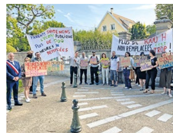
À l'école Jules Vernes, c'est 7 semaines de cours qui n'ont pas pu être données à cause des heures perdues.