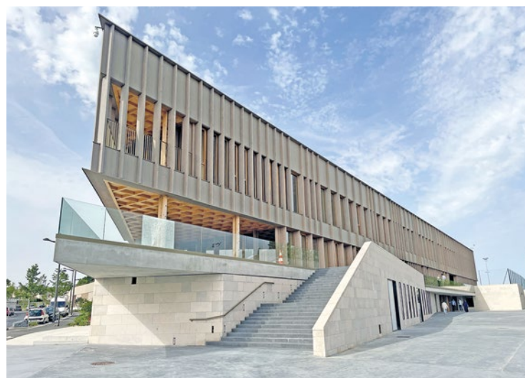
205 m² de panneaux photovoltaïques permettent de fournir plus de 25% des besoins en électricité du bâtiment.

Car si la fonction première du pôle Léo Lagrange est bien l'éducation, les élèves ne seront pas les seuls à arpenter les couloirs de ce nouvel