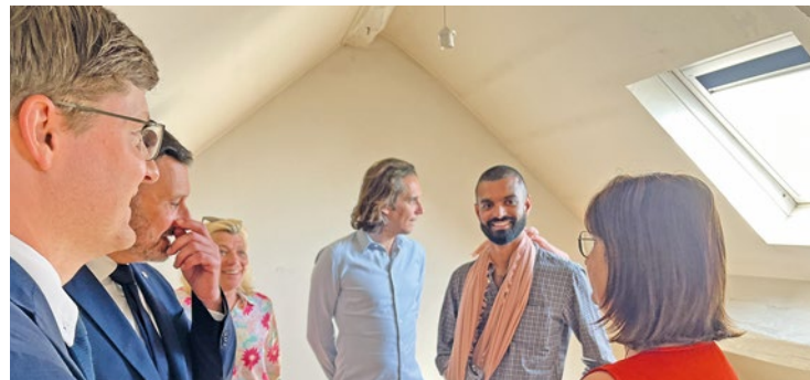
La maison du Refuge de Verneuil-sur-Seine permettra d'accueillir 4 jeunes LGBT+ rejetés par leur famille.

La maison vernolienne est donc là pour pallier cela. Les futurs résidents ne paieront comme loyer qu'un petit pourcentage de leur ressource, ce qui permettra