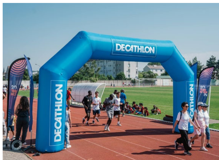
Après le centenaire du cercle de la voile une semaine plus tôt, cette journée était un nouveau marqueur de l'engagement de la commune pour les JO et tout ce qui les entoure.

Que ce soit en courant ou en marchant, de nombreux habitants se sont prêtés au jeu du « Grand paris 2024 km » des Mureaux, le mercredi 26 juin. Un événement sportif et convivial qui avait pour but de fédérer à quelques semaines des Jeux Olympiques de Paris.