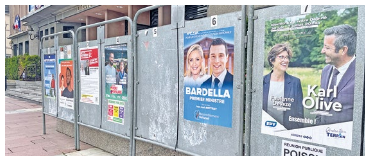
La participation a atteint 71,42 % sur la circonscription, un bond de 20 points par rapport à 2022.