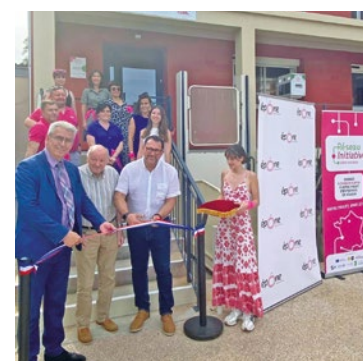
Le réseau Initiative Seine Yvelines a quitté ses locaux des Mureaux pour s'installer à Épône.

Auparavant le réseau Initiative Seine Yvelines était aux Mureaux, à l'Espace de l'Economie et de l'Emploi, 38 Avenue Paul Raoult. ■