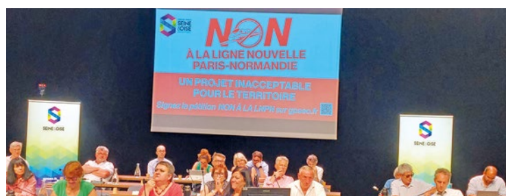
En parallèle, une pétition a été lancée pour permettre aux habitants de se mobiliser, eux aussi, contre le projet.

En parallèle, une pétition a été lancée pour permettre aux habitants de se mobiliser, eux aussi, contre ce qu'elle juge être « un projet aussi coûteux pour les finances publiques de la France que dévastateur pour le territoire ». Pour signer la-dite pétition, cela se passe sur www.change.org/p/non-a-la-ligne-nouvelle-paris-normandie-lnpn-ensemble-sauvons-notre-territoire . ■