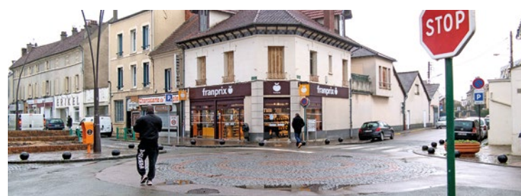
Un temps d'échange sera proposé à la suite de la présentation.

sera présent pour exposer sa vision du centre-ville et les travaux qui seront mis en place. Un temps d'échange sera proposé à la suite de la présentation, pour permettre aux Limayennes et Limayens de donner leur avis et de soumettre leurs interrogations aux différentes parties prenantes. Si vous êtes intéressés, direction le 5 avenue du président Wilson mercredi prochain. ■