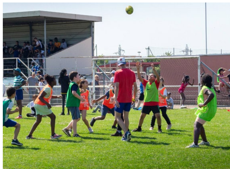
60 classes, allant du CP au CM2, se sont prêtées au jeu pour ce grand tournoi scolaire.

Le mardi 25 juin se déroulait le tournoi scolaire du club de rugby de Limay, au complexe Auguste Delaune, rassemblant 1047 élèves pour une journée sportive et conviviale.