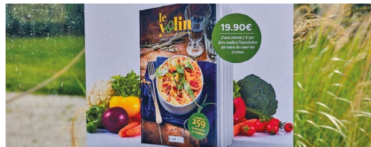
Chaque page présentant une recette, une commune, et trois bonnes adresses d'artisans, commerçants, maraîchers, éleveurs, producteurs ou entreprises des métiers de bouche.