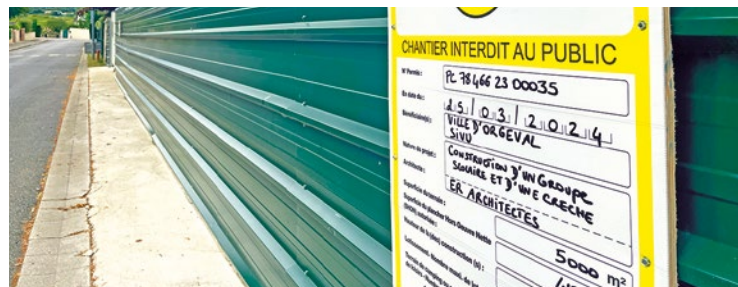
Pour rappel, le chantier avait déjà été stoppé il y a 1 an juste après son lancement, car le PLUi n'avait pas encore été modifié.

Le projet va-t-il bien voir le jour ? En tout cas, Hervé Charnallet ne compte pas abdiquer. « Nos avocats travaillent déjà à l'analyse de la décision afin de déterminer les prochaines étapes à suivre », affirme le maire. L'équipe municipale et les services restent mobilisés pour relancer les travaux dans les meilleurs délais. Pour rappel, le chantier avait déjà été stoppé il y a 1 an juste après son lancement, car le PLUi n'avait pas encore été modifié. ■