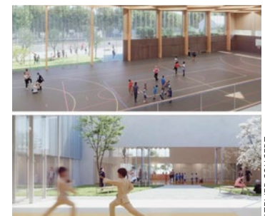
Le gymnase s'articulera autour d'un patio central pensé comme « un poumon vert » pour faciliter le passage des utilisateurs.

est articulé autour d'un patio central faisant office de « poumon vert » et qui permettra d'organiser la circulation des usagers. Le cabinet d'architecture précise également qu'un gros travail de transparence a été fait pour que la lumière pénètre parfaitement le bâtiment. ■