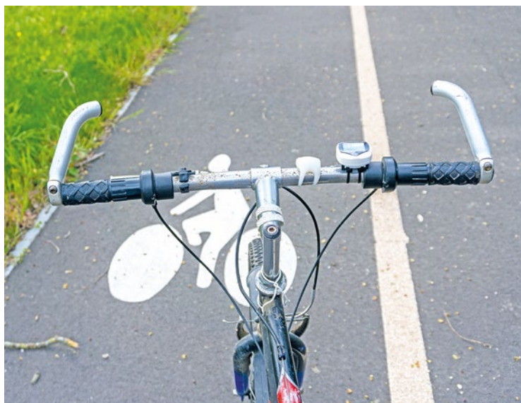
Pour retrouver l'ensemble des aménagements prévus dans le détail, rendez-vous sur ville-villennes-sur-seine.fr.

« Pour les réunions d'arbitrage, la Municipalité était accompagnée par les associations Collectif villennois pour la transition (CVT) et Villennes initiatives et écologies (VIE) », précise la Ville. Parmi les futurs aménagements, on retrouve des marquages au sol sur le chemin des Groux, la route de Marolles, ou encore les rues du Pré-aux-Moutons, de la Clémenterie, de Breteuil ou de Médan, mais aussi la création de sas vélo, comme sur l'avenue du Général de Gaulle, l'avenue Georges Clémenteau et le chemin du Pré-au-Seigneur. Un double-sens cyclable avec marquage au sol sera également mis en place dans la rue Marcel Mirgon. « Certains aménagements proposés par GPSEO n'ont pas été retenus pour cause de futurs travaux ou parce que jugés accidentogènes », ajoute la municipalité. Les travaux débiteront au mois de septembre. ■