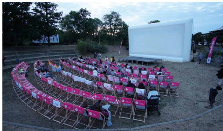
Pour la toute première fois, Yvelines Ciné sera prolongé au-delà de la période estivale.

L'Extraterrestre » de Steven Spielberg au Parc de la mairie de Mézysur-Seine, ou « Le Monde de Nemo » du studio Pixar à l'Espace de verdure de Courgent, vous ne pouvez pas vous tromper (sauf si vous optez, ce soir là, pour « Bohemian Rhapsody » à Aulnay-sur-Mauldre).