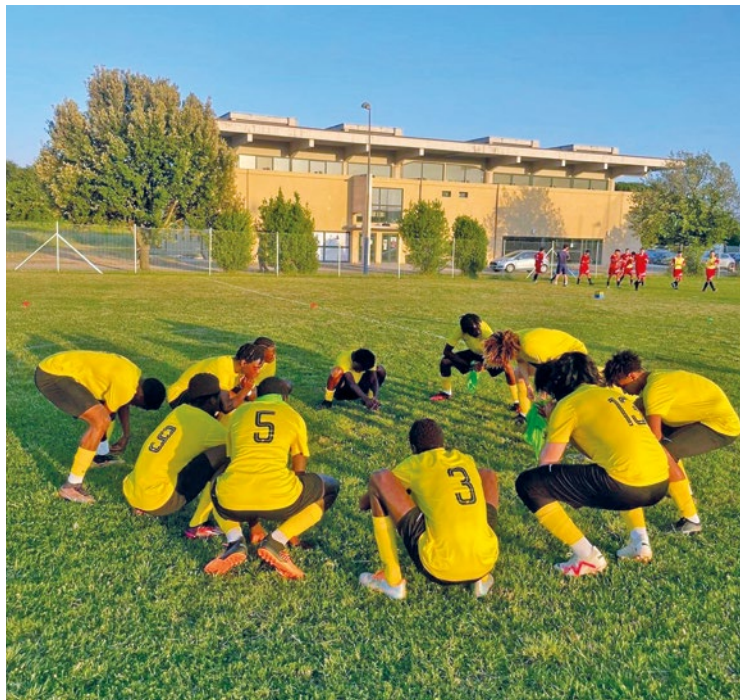
Le tournoi était ouvert aux jeunes âgés de 12 à 18 ans.

Du 30 juin au 5 juillet dernier, 13 jeunes issus de tous les quartiers de Mantes-la-Ville ont participé au tournoi de football Italy World Games .