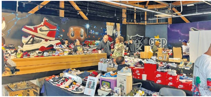
Comme l'édition précédente, le Sneakers Yvelines Event a connu une magnifique ambiance tout au long de la journée.

LFM a suivi le déroulement complet du Sneakers Yvelines Event qui se déroulait le week-end du 6 juillet au centre commercial Mon Beau Buchelay. Organisateurs, exposants, visiteurs, tous se sont confiés au micro d'LFM.