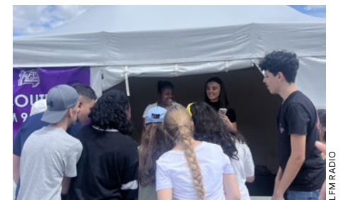
La Colonie de Vanves en train de jouer à « Complète les paroles ».

De nombreuses activités vous attendent tout au long de l'été avec la LFM radio Summer Challenge !