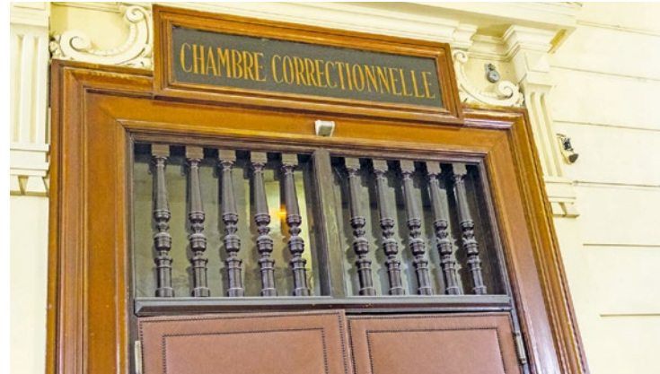
En s'étant trompés, ils ont précipité leur arrestation. Jugés au Tribunal, ils se retrouvent finalement condamnés à 12 mois d'emprisonnement dont 6 avec sursis.

Pour récupérer l'argent qu'une de leurs connaissances leur devait, trois Élancourtois sont partis le 4 juin en pleine nuit. En cherchant le bon appartement, ils se sont trompés et ont sonné chez une voisine. Qui finira par appeler la Police en entendant que la situation dégénère.