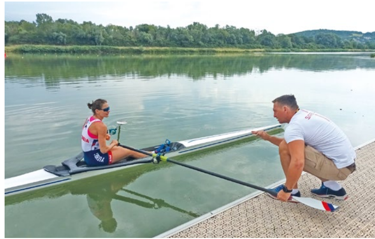
Certaines villes ont même déjà commencé à accueillir des athlètes, comme Mantes-la-Jolie et son stade nautique Didier Simond.

Que ce soit à Mantes-la-Jolie, Poissy ou Saint-Germain-en-Laye, de nombreux athlètes olympiques passeront une partie de leur été dans le département pour se préparer à leurs épreuves. Tour d'horizon.