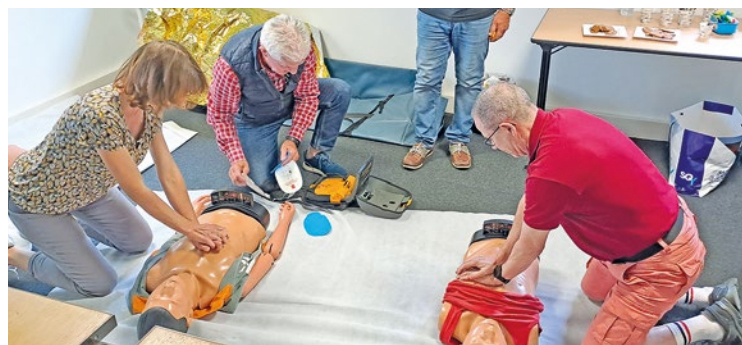
La Gazette a rencontré certains bénévoles à l'occasion d'une session de formation consacrée aux gestes de 1 er secours.

Du côté de l'Agglomération, on met notamment en avant la diversité des profils des bénévoles. « On a tout, des plus âgés, des moins âgés », souligne SQY, évoquant aussi une bonne répartition entre hommes et femmes. Le 3 juillet, une cinquantaine de bénévoles étaient encore recherchés de manière à atteindre les 550. Plus de 1100 personnes étaient initialement inscrites auprès de l'Agglomération mais les désistements et les nouveaux besoins ont amené à rouvrir un processus de recrutement. Les bénévoles de SQY tourneront autour des différents sites du territoire saint-quentinois (en plus de la gare et la fan zone). Ils bénéficieront d'un lieu de vie à la gare et au Bénévoles center. Pour postuler aux dernières places restantes, rendez-vous sur sqyjetlesjeux.fr. ■