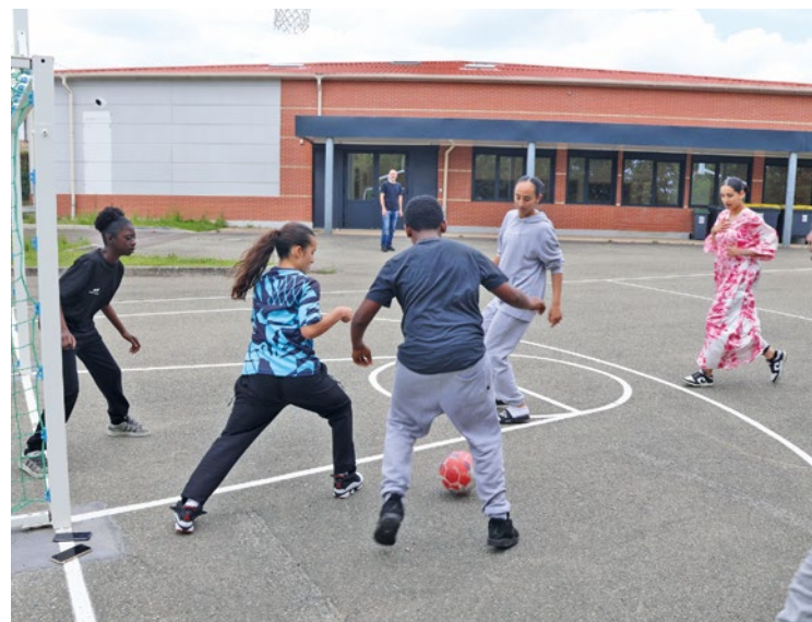
Pour s'inscrire, il suffit de remplir le dossier disponible sur le site de la Mairie (chanteloup-les-vignes.fr).