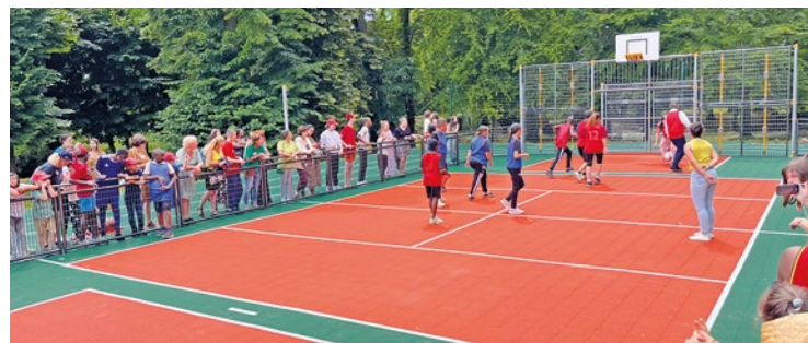
Dès son inauguration, le terrain multisport adapté de l'IME Alfred Binet a vu les jeunes organiser une partie de football.