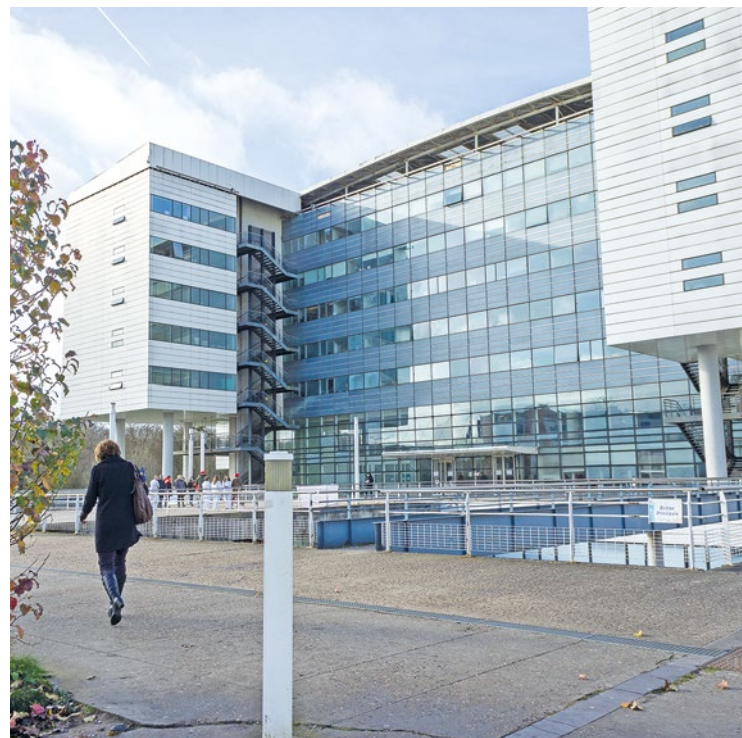
La moitié des accouchements prévus d'ici le 28 juillet devraient être délocalisés.

Le centre hospitalier François-Quesnay de Mantes-la-Jolie a annoncé qu'aucun accouchement de nuit ne serait possible jusqu'au 28 juillet prochain, suite à deux arrêts maladies au sein de ses équipes.