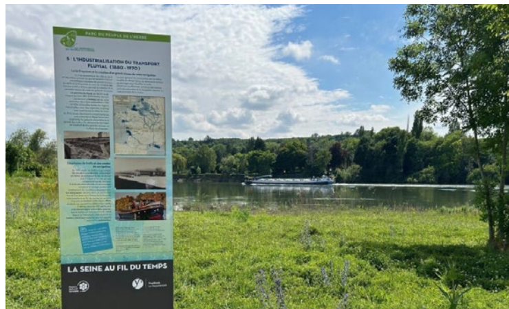
Pour attirer les visiteurs en cette période estivale, le Département des Yvelines propose également sur ce site un large panel d'activités en lien avec la protection de la biodiversité.

Pour attirer les visiteurs en cette période estivale, le Département des Yvelines propose également sur ce site un large panel d'activités en lien avec la protection de la biodiversité. Il y multiplie les activités de sensibilisation accessibles à tous, que ce soient des sorties nature, des expositions temporaires ou des œuvres éphémères. ■