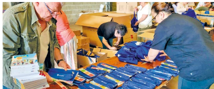
Aucun document ne sera demandé sur place, hormis la carte d'identité de l'un des parents.

La municipalité distribuera gratuitement un kit de rentrée scolaire, à la fin du mois d'août, pour chaque enfant scolarisé dans les écoles publiques élémentaires de Carrières-sous-Poissy.