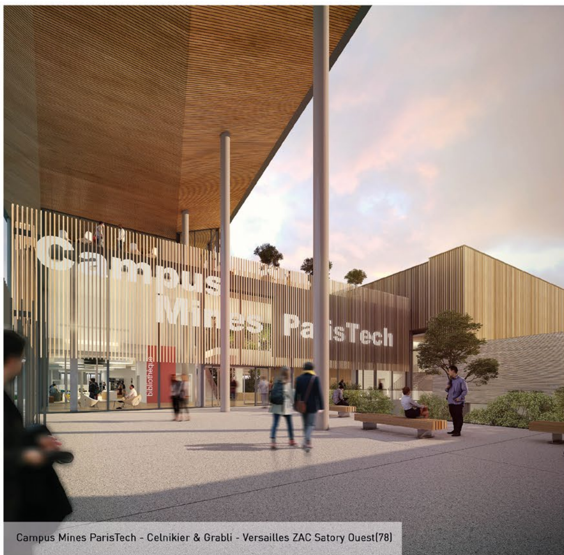
Campus Mines ParisTech - Celnikier & Grabli - Versailles ZAC Satory Ouest(78)