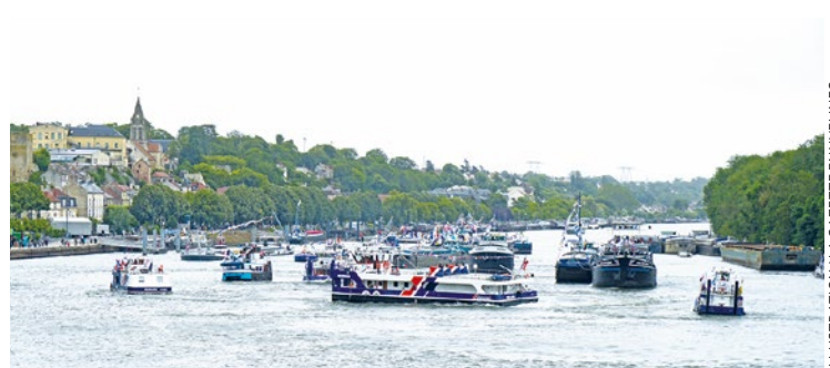
La croisière « Batellerie et éclusage » vous permet d'embarquer sur le Tivano, célèbre vedette qui conduit chaque année la procession fluviale du Pardon de la batellerie.

L'Office de tourisme intercommunal Terres de Seine propose, depuis dimanche et jusqu'au 15 septembre, des croisières autour de trois thématiques liées au territoire.