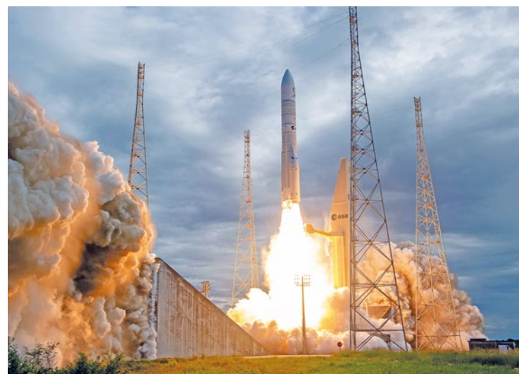
Ce premier vol d'Ariane 6 marque le retour de l'Europe dans la course à l'espace.

Et ce n'est que le début, car le carnet de commandes du géant européen se remplit. 6 lancements sont déjà programmés pour l'année 2025, de quoi occuper les ingénieurs muriaux. « Il va falloir