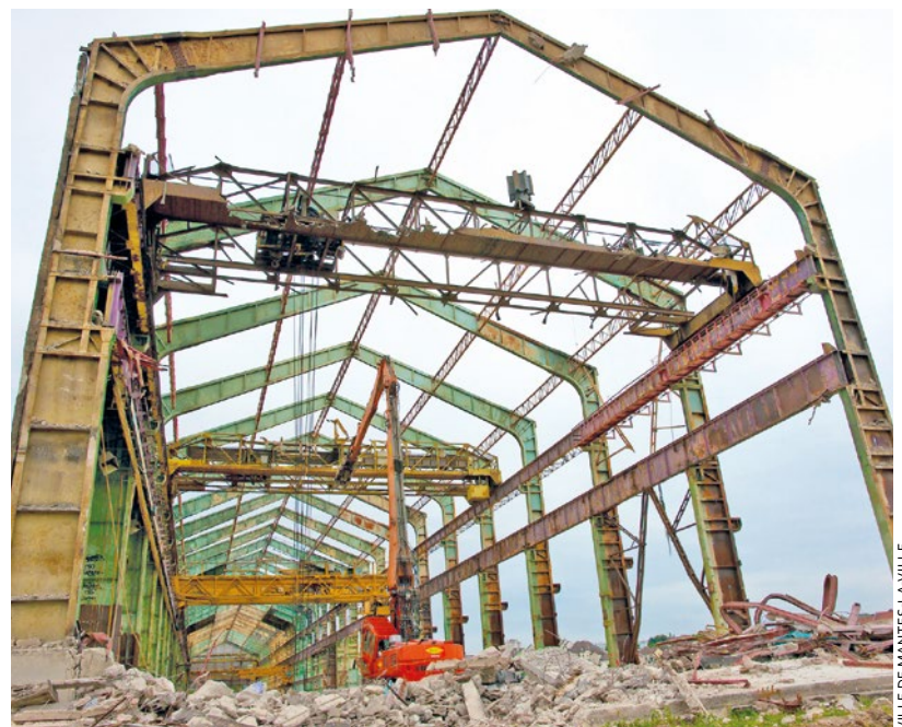
La nouvelle Halle Sulzer s'apprête à devenir un véritable lieu de vie et de passage dans le quartier.

Les travaux de la Halle Sulzer suivent leur cours à Mantes-la-Ville, si bien que seule sa structure métallique tient encore debout. Le chantier devrait durer jusqu'à la fin de l'année 2026.