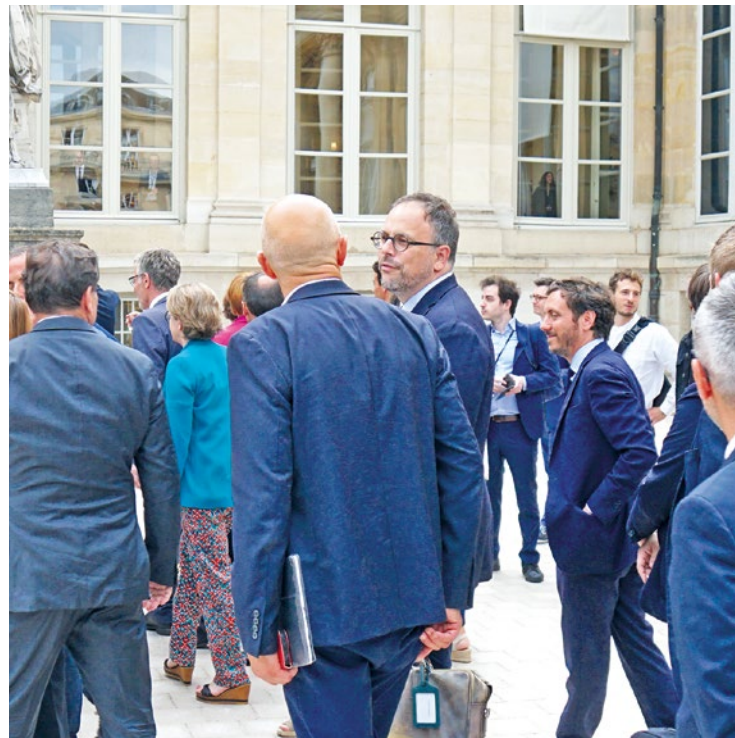
Auparavant ministre, Aurélien Rousseau a pu « revoir des personnes qu'il avait déjà cotoyé ».

Suite à leur élection en tant que député, Dieynaba Diop et Aurélien Rousseau ont découvert le Palais Bourbon pour la première fois en tant qu'élus. Alors que la composition du gouvernement reste nébuleuse, les deux parlementaires savent que le chemin est encore long pour amener de la stabilité.