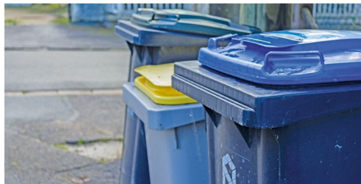
Plusieurs solutions s'offrent aux habitants concernés, dont le dépôt des déchets verts en déchetterie.

Les déchets végétaux peuvent également être déposés dans l'une des 11 déchetteries accessibles en Vallée de Seine. Pour rappel, la déchetterie de Limay, en travaux quelques jours début juin pour modernisation, proposera à partir du 5 août le nouveau système d'accès par lecture de plaques d'immatriculation. ■