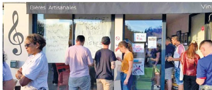
D'après le propriétaire du bar La TRBL, la police municipale vérifierait chaque soir que son établissement ferme aux horaires indiqués sur les arrêtés municipaux.