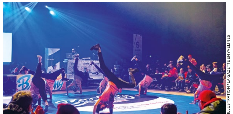
Les inscriptions se feront sur place de 12h30 à 14h, la présélection de 14h à 15h30, et enfin, les battles de 15h30 à 18h.

lera, parmi d'autres animations, le Poissy contest. Celui-ci permettra à qui le souhaite de faire parler ses talents en breaking : devant un jury, des battles de hip-hop seront organisés avec à gagner, 500 euros pour les plus de 18 ans, et une enceinte Bluetooth pour les moins de 18 ans. Les inscriptions se feront sur place de 12h30 à 14h, la présélection de 14h à 15h30, et enfin, les battles de 15h30 à 18h. L'événement est organisé par La Source, structure de la Mairie dédiée à la jeunesse, et par l'association Tous en Seine. ■