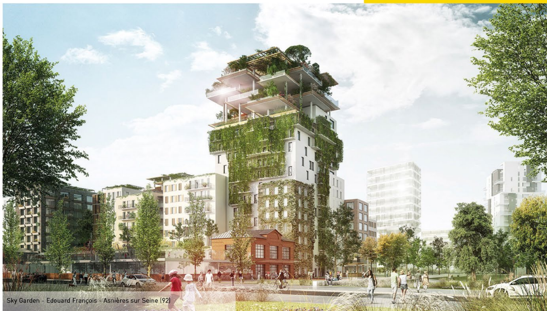
Sky Garden - Edouard François - Asnières sur Seine (92)