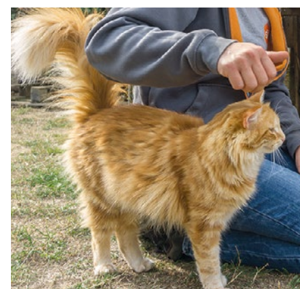
Depuis le début de l'année, l'association a déjà pris en charge 50 chats, dont 25 chatons, avec une majorité de chats sociables.

l'impunité qui prime ». À l'aube des départs en vacances, « SOS Matous » s'inquiète des millions d'abandons à venir et insiste qu'il devient « urgent que le Gouvernement rende obligatoire la stérilisation des chats », comme cela est déjà le cas dans nos pays voisins qui sont l'Espagne et la Belgique. ■