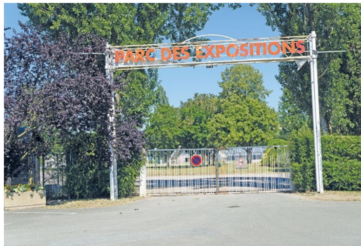
L'événement est organisé chaque année par l'association Bulles de Mantes et la Ville de Mantes-la-Jolie.

« Par respect pour les auteurs qui se déplacent loin de chez eux et de leur famille pour venir promouvoir leurs albums à Mantes-la-Jolie, nous vous incitons fortement à ne leur faire dédicacer que des albums que vous aurez achetés sur le stand de la librairie du festival, où vous trouverez les seuls titres que l'auteur a demandés pour dédicacer », précise toutefois l'association Bulles de Mantes . Le prix d'entrée est fixé à 3 euros, tandis que l'événement est gratuit pour les moins de 16 ans. ■