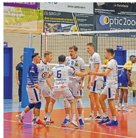
Une belle revanche pour le CAJVB, qui avait raté les play-offs pour 1 petit point l'année dernière.

25-12, 15-8). Une belle revanche pour le CAJVB, qui avait raté les play-offs pour 1 petit point l'année dernière. Ils seront cette fois-ci au rendez-vous pour tenter d'accéder à l'étage supérieur, forts d'une belle troisième place et d'une dynamique positive. ■