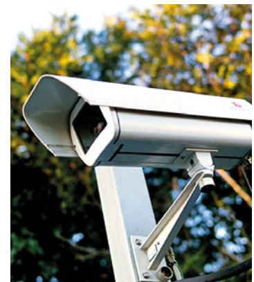
Triel-sur-Seine, Magnanville, Saint-Martin-la-Garenne... Nombreuses sont les communes de la Vallée de Seine à investir dans la vidéoprotection.

majeurs, notamment contre la délinquance et les dépôts sauvages, un fléau subi par de nombreux Triellois » insiste la municipalité. Pour donner votre avis sur le sujet, rendez-vous sur le site internet station.iliwap.com/fr/public/78624 . ■