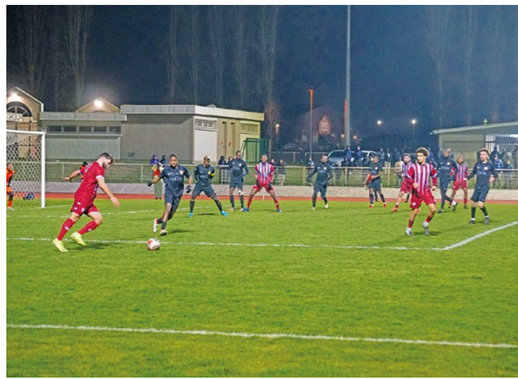
Le FC Mantois et l'OFC Les Mureaux retrouveront les terrains le 29 mars, après la trêve.

Les deux clubs de la Vallée de Seine ont connu un week-end morose en R1, avec deux matchs nuls sur le terrain de Saint-Brice pour le FC Mantois, et de Cergy-Pontoise pour les Muriautins.