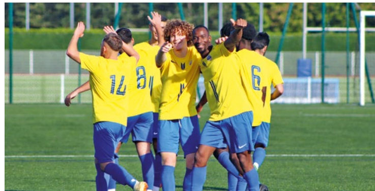
La municipalité s'est rapprochée du président démissionnaire pour le convaincre de finir la saison au sein du club.

« Cette transition, assurée dans un climat apaisé et de confiance réciproque, garantit à chacun des joueurs et de leurs familles, des entraîneurs, à l'encadrement et à l'ensemble du personnel que le club poursuivra ses efforts et son développement, bénéficiant de l'entier soutien municipal », peut-on lire dans le communiqué daté du 11 mars. À l'heure où nous écrivons ces lignes, le Poissy FC est en tête du classement de D1. ■