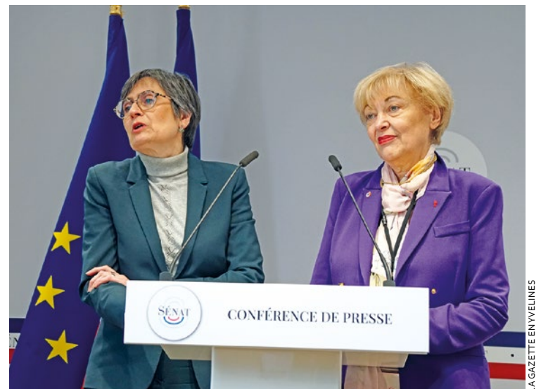
Pour les sénatrices Ghislaine Senée et Pascale Gruny, l'IA peut permettre d'automatiser des tâches bien souvent fastidieuses.

La sénatrice des Yvelines, Ghislaine Senée, a réalisé un rapport avec sa consœur de l'Aisne Pascale Gruny sur l'utilisation de l'intelligence artificielle au profit des collectivités territoriales. Détection des fuites d'eau, robot conversationnel, gestions des déchets, les champs d'applications sont vastes. Mais pour cela, il faudra veiller à la souveraineté des données et former le personnel.