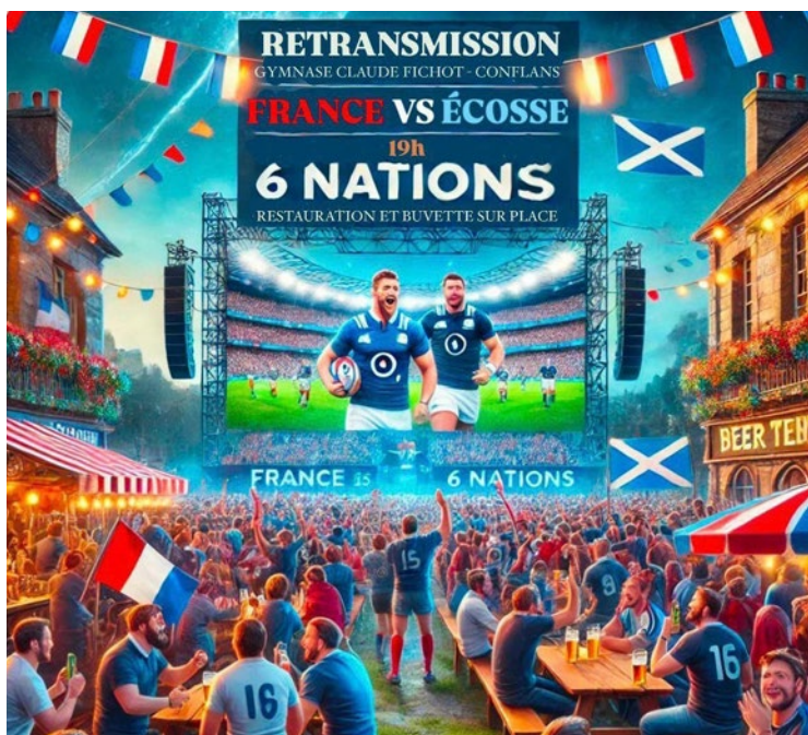
Exemple d'application les plus vues actuellement, des affiches d'événements culturels réalisées grâce à de l'intelligence artificielle.