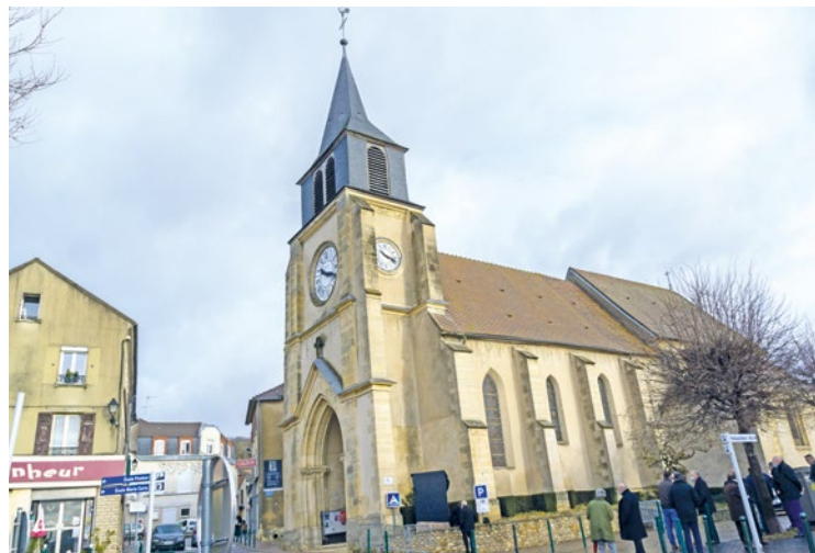
L'étude réalisée à l'aide d'une modélisation 3D a permis de mettre en lumière des « pathologies évolutives menaçant l'intégrité du bâtiment ».

« Le rapport souligne que ces dégradations sont en constante évolution et qu'elles exigent une intervention immédiate pour garantir la préservation du patrimoine », a déclaré la maire, Catherine Arenou. De ce fait, l'église Saint-Roch est fermée au public depuis le 10 mars, et jusqu'à nouvel ordre. Des études complémentaires vont désormais être engagées afin de programmer des travaux conservatoires, qui auront pour but de stabiliser l'édifice. ■