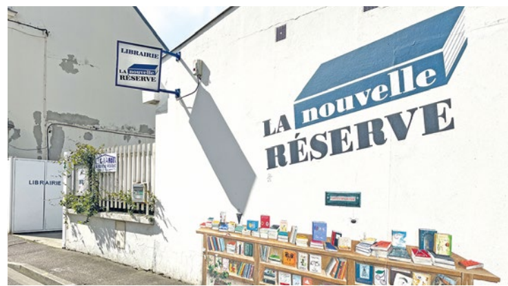
Pour connaître les détails de cette journée, ainsi que les modalités de réservation, direction le site de la librairie ( lanouvellereserve.fr ).