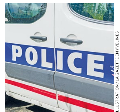
Même dans la voiture de police, il menaçait toujours de « fumer » le jeune homme de 21 ans.

Durant son audition, il reconnaît les faits en précisant que l'arme exhibée était factice et qu'il s'en était débarrassé. Le 7 mars, il est présenté au tribunal judiciaire de Versailles et écope d'une peine d'emprisonnement de 18 mois dont 6 avec sursis probatoire pendant 2 ans. ■