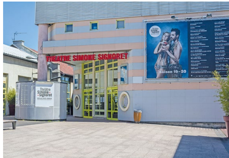
4 concerts sont au programme de cette édition du festival.

Pendant les deux derniers week-ends du mois de mars, l'association Jazz au confluent organise son festival annuel Jazzenville , entre le conservatoire George Gershwin et le théâtre Simone Signoret de Conflans-Sainte-Honorine.