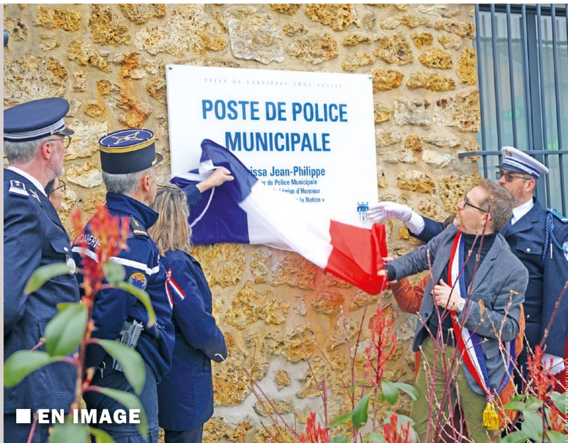
■ EN IMAGE

Pour les habitants de Mantes-la-Jolie à la recherche d'un emploi ou d'une formation, il faudra se tourner vers la Journée des opportunités, le mercredi 9 avril de 9h30 à 16h30 à l'Agora. Des recruteurs seront sur place pour présenter leurs offres d'emploi, tandis que des formations adaptées seront proposées selon votre projet professionnel. ■