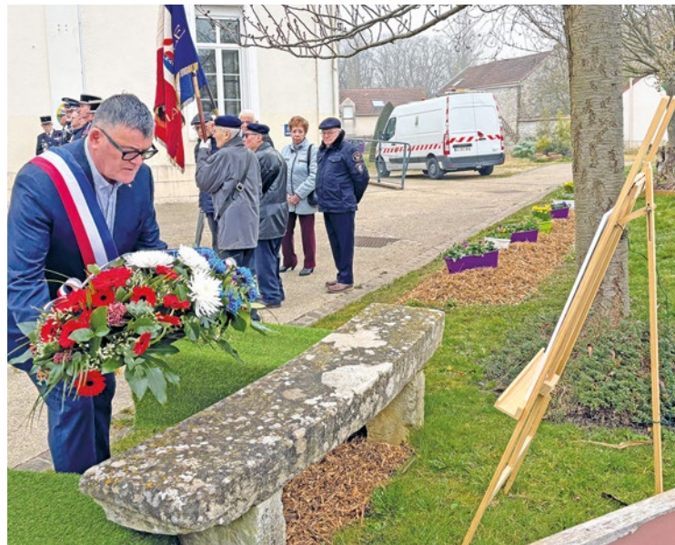
Des gerbes de fleurs ont été déposées en hommage aux victimes du terrorisme à l'issue des prises de parole.