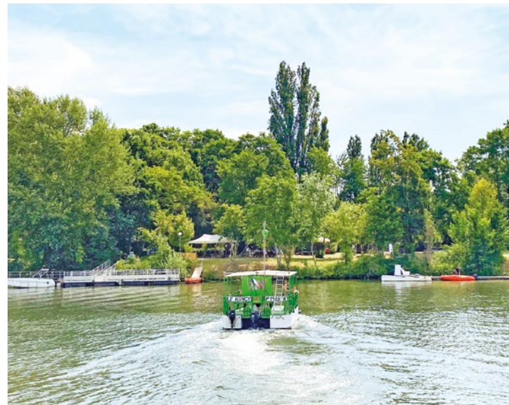
Pour retrouver la totalité des événements, rendez-vous sur fetedelanature.com.

ADIV Environnement propose une exposition géante de photographies animalières sur les grilles des écoles de la commune, tandis qu'à Carrières-sous-Poissy, la Maison des insectes organise une journée portes ouvertes le 24 mai. Mais c'est du côté d'Andrésy qu'on retrouve le plus d'animations avec, pêle-mêle, une visite guidée naturaliste le long des quais de Seine le 21, une balade à la découverte de l'île Nancy le 22, ou encore un comptage citoyen des oiseaux de la commune les 23 et 24 mai. Pour retrouver la totalité des événements, rendez-vous sur fetedelanature.com. ■