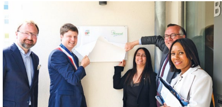
Présent pour l'occasion, Patrick Mignola, ministre chargé des relations avec le Parlement, a souhaité en conclusion « longue vie et longues aventures humaines à ce quartier ».

À l'occasion de la fin des travaux entamés en 2022, une journée d'animations était organisée samedi dernier à la cité cheminote de Verneuil-sur-Seine, en présence des riverains et des élus.