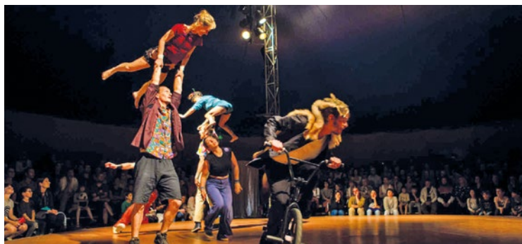
Le spectacle, d'une durée de 1h15, est accessible à un tarif allant de 8 à 15,50 euros.

Imaginé par la compagnie du Cirque Exalté, ce spectacle haut en couleurs fait vibrer le public partout où il passe grâce à son énergie sauvage qui mène rythme, rock et mythologie. De quoi chambouler notre vision du cirque ! Pour prendre votre place lors de sa venue en terres vernoliennes, cela se passe sur la billetterie en ligne du Théâtre de la Nacelle (reserver.gpseo.fr), par mail à l'adresse accueil.lanacelle@gpseo.fr ou par téléphone au 01 30 95 37 76. D'ailleurs, le billet d'entrée au spectacle donne l'accès gratuit au parking, mais aussi au site de l'île des loisirs où de nombreuses activités vous attendent. ■