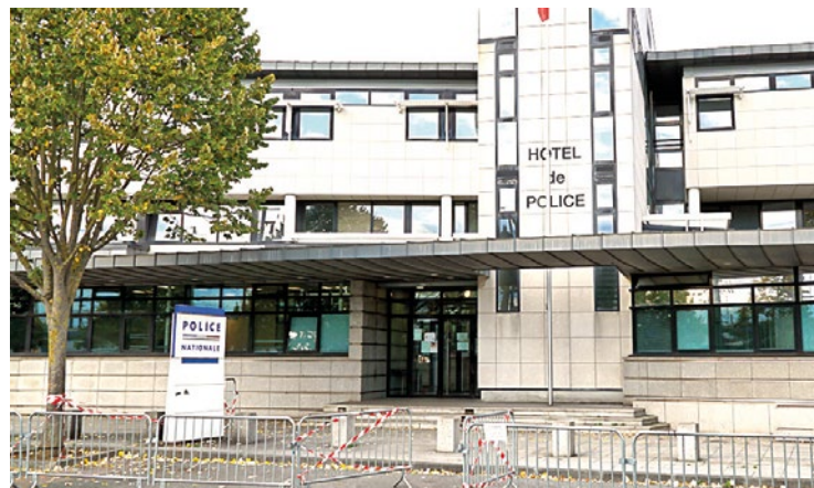
Contacté par le Parisien , le maire-adjoint n'a pas souhaité s'étaler sur les raisons de cette découverte.

en cas de pression sur la gâchette, lâche un gaz contenu dans une cartouche. Elle est classée dans la catégorie D, ce qui permet son achat en vente libre. Même si l'identité de l'adjoint n'a pas été révélée, il est décrit par le Parisien comme « sans histoire » et n'ayant jamais été au centre de menaces quelconques. Cependant, l'atmosphère autour du conseil municipal de Mantes-la-Jolie se tend de plus en plus alors que les échéances des élections municipales se rapprochent. ■