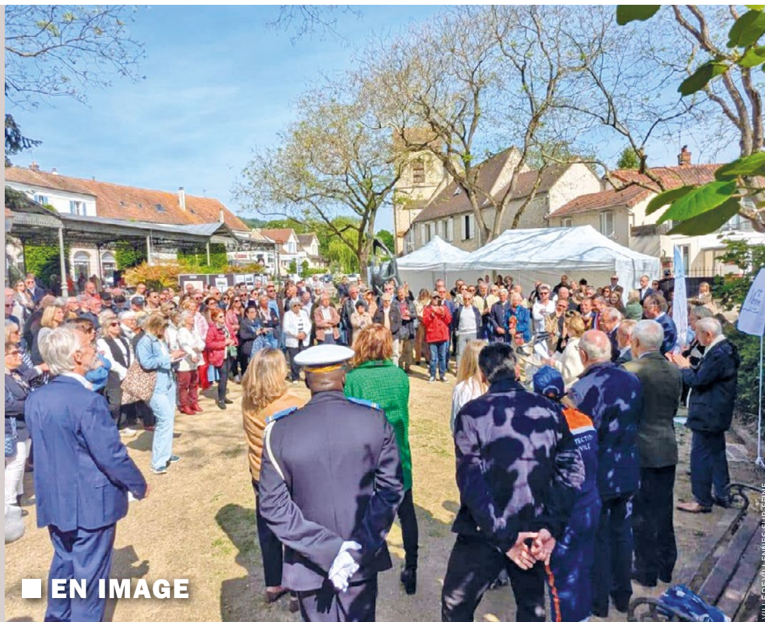
■ EN IMAGE

Les demandes doivent être déposées sur le site mesdemarches.ile-defrance.fr (chercher « Installation de récupérateurs d'eaux pluviales ») au plus tard dans les 3 mois suivant l'installation de l'équipement. Les demandes sont acceptées jusqu'au 31 décembre 2025. ■