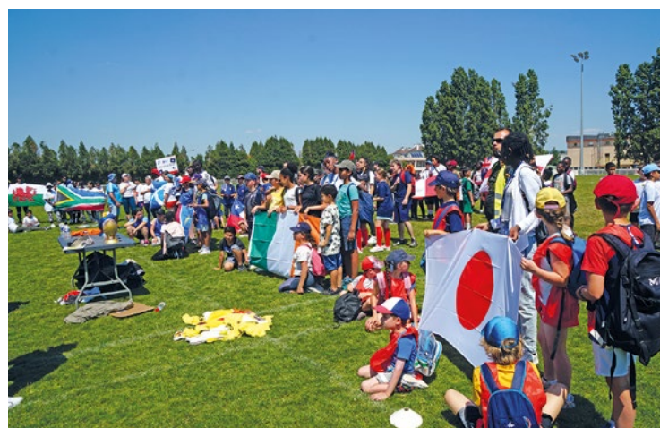
La première édition de Drop en Seine avait vu le jour aux Mureaux en 2023, année de la dernière coupe du monde.

de gagner cette coupe du monde locale. Le coup d'envoi des rencontres sera donné à partir de 10h, avec une cérémonie de remise des récompenses prévue pour 16h. En marge de l'événement, d'autres animations et jeux annexes seront proposés aux enfants. Car il est bien là, le but de cette journée : s'amuser et découvrir une nouvelle discipline, pas se challenger. ■