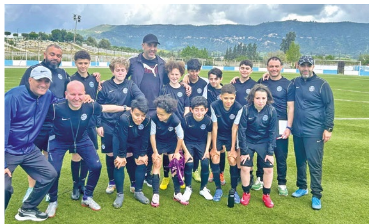
Un voyage riche en apprentissage pour les jeunes footers.

Jusqu'au samedi 3 mai, les jeunes du club de football achérois ont posé leurs valises en Algérie dans le cadre du partenariat noué avec le club local ACDBK.