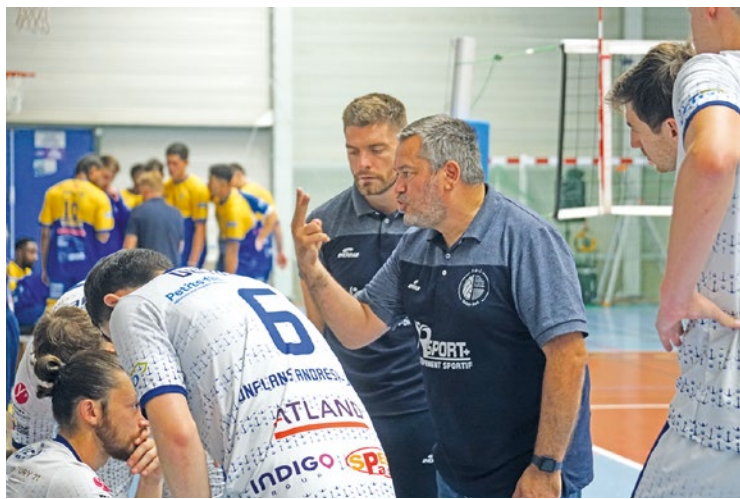
Le CAJVB compte 8 points au classement de cette phase de play-offs.

On savait que l'entente Conflans-Andrézy-Jouy, qui peut déjà être fière de sa saison, ne serait pas promue en division supérieure et ce malgré une place acquise en play-offs. Accusant trop de retard sur le Rennes Étudiants Club, les Yvelinois peuvent donc finir la saison sans la pression du résultat. Toutefois, cela ne semble pas leur être bénéfique, bien au contraire. Après la raclée reçue à domicile par Chalon-sur-Saône, le CAJVB n'a pas fait le poids sur le terrain du leader, samedi dernier. Bien qu'ils ne se soient pas laisser faire, les Corsaires ont été battus 3 sets à 0 (25-18, 25-20, 25-22), et pointent désormais à la 5 ème place du classement des play-offs, avec 3 victoires pour 5 défaites. Il leur reste deux rencontres pour redresser la barre avant la fin de la saison : ce samedi 3 mai face à Arles, qu'ils ont battu à l'aller, puis à Chalon-sur-Saône. ■