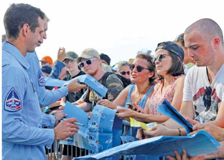
Compétition de voltige, simulateurs de vol, baptême de l'air... Il y aura de quoi s'envoyer en l'air, le dimanche 18 mai.

On a toutefois une mauvaise nouvelle à vous annoncer : la Patrouille de France ne sera malheureusement pas de la partie cette année, suite à l'accident survenu le 25 mars dernier, quand deux avions