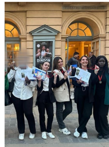
Il s'agissait de la troisième édition du concours d'éloquence des lycées professionnels.

qui terminent respectivement à la première et troisième place. Les élèves du lycée Saint-Vincent-de-Paul (Versailles) complètent le classement. ■