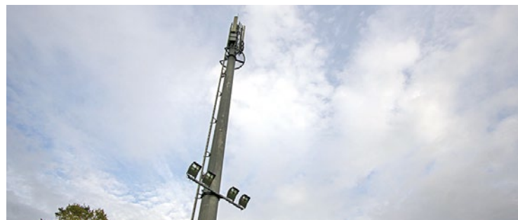
À l'heure où nous écrivons ces lignes, la pétition accessible sur le site change.org cumule plus de 60 signatures.

Pour rappel, les deux municipalités ont ouvert la porte, ces derniers mois, à l'implantation et à la mutualisation d'antennes 5G sur le territoire communal. L'objectif ? Éviter que les opérateurs téléphoniques ne négocient avec des propriétaires privés, et que les habitants ne se retrouvent avec plusieurs pylônes à quelques centaines de mètres de distance. ■