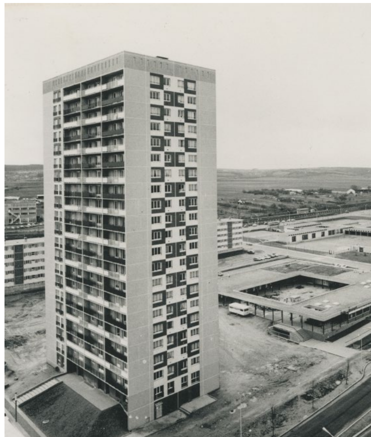
Alors que Mantes-la-Jolie commençait à s'urbaniser, la tour Vega surplombait déjà le quartier du Val-Fourré.

Construite dans les années 70, la tour Vega, la plus haute de Mantes-la-Jolie, sera détruite en 2027. Le bailleur social avait organisé une exposition en avril pour que les habitants puissent témoigner des bons comme des mauvais côtés de cet immeuble.