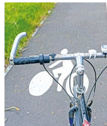
Pour retrouver l'ensemble du programme, rendez-vous sur maivelo.fr .

commune. À quelques kilomètres de là, à Achères, on trouvera un circuit vélo pour enfants, un atelier de réparation SNCF/Vélo Services et permis vélo au skatepark. Outre ces animations, des communes organisent elles aussi leur propre challenge Mai à vélo qui consiste à parcourir le plus de kilomètres collectivement. ■