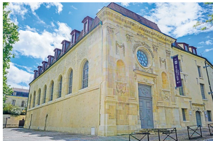
Cette vaste exposition a reçu le soutien de l'Ambassade du Maroc.

soirée du samedi 3 mai qu'il faut noter dans son calendrier avec le grand défilé et la retraite aux flambeaux à travers les rues de la commune. Le départ sera donné à 20h30 sur l'avenue Thiers, avec une arrivée prévue vers 22h sur la place du 8 mai 1945. ■