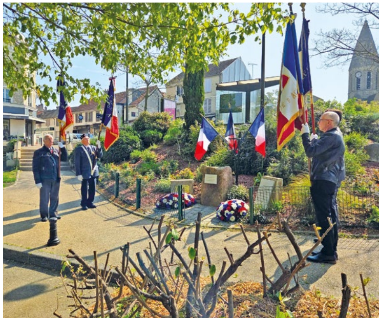
À Achères, un hommage a été rendu devant la stèle de la déportation.