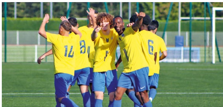
Le FC Poissy affrontait le FC Villennes-Orgeval en demi-finale ce dimanche. Après 120 minutes de jeu, ce sont les Pisciacaïs qui se sont imposés lors des tirs aux buts, 4 à 3.

« Avant leur départ, les jeunes sportifs ont reçu les encouragements chaleureux du maire, très attaché à ce type d'initiative favorisant l'ouverture au monde, les valeurs du sport et l'amitié entre les peuples, a souligné la Mairie d'Achères. Il a salué l'engagement du club et des encadrants dans l'organisation de ce séjour porteur de sens ». ■