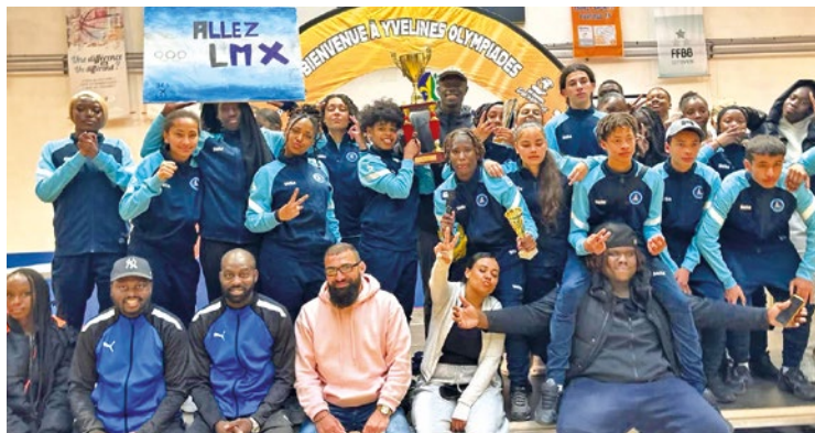
Les jeunes des Mureaux qui célèbrent leur victoire avec le trophée

Après le succès de la première édition l'année passée, l'association Au Service Du Monde revenait avec la deuxième édition des Yvelines Olympiades à Mantes-la-Jolie ces 24 et 25 avril. Un événement sportif, festif et citoyen placé sous le signe du partage, de la compétition et de la sensibilisation.