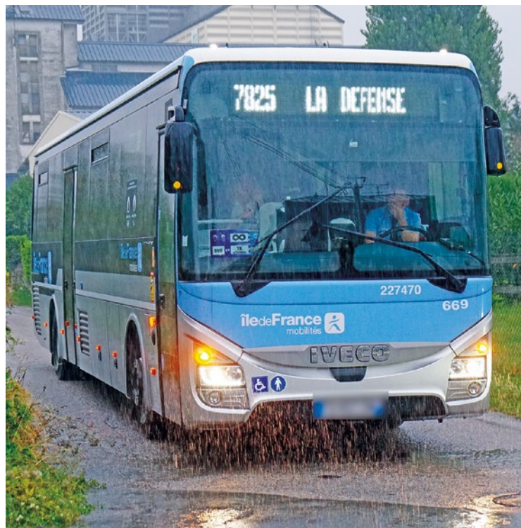
Pour la Mairie, cette nouvelle ligne de bus permettra au territoire de se connecter davantage aux gares du futur RER E.

La Municipalité a annoncé le 31 décembre 2025 qu'une ligne Express A14 reliera Rosny-sur-Seine à La Défense. Elle sera effective lors de l'arrivée d'Eole en 2027.