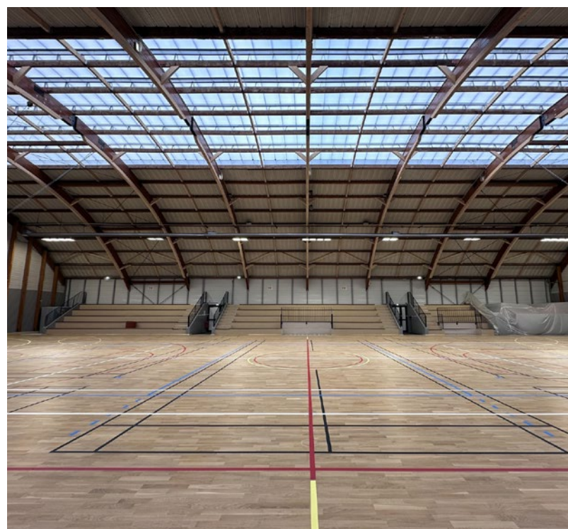
VILLE DE VERNEUIL-SUR-SEINE

La municipalité a remis en état le parquet et les tracés du gymnase Pierre de Coubertin, dont les travaux ont pris fin pendant les fêtes de fin d'année.