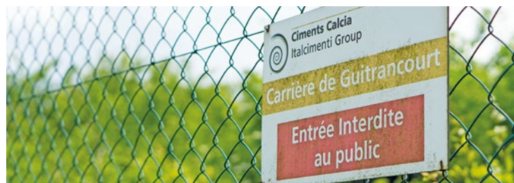
Si le site est historiquement celui de la carrière Calcia (Heidelberg), c'est aujourd'hui l'activité de stockage de déchets gérée par Veolia qui est au cœur des débats, les deux industriels étant liés par la remise en état du site.

La population peut s'exprimer sur ces évolutions jusqu'au 29 janvier pour la carrière et jusqu'au 19 février 2026 pour le volet déchets. Deux permanences clés permettront de rencontrer le commissaire-enquêteur : le 16 janvier à la mairie d'Issou (14h30-17h30) et le 12 février à la mairie de Guitrancourt (16h-19h). Une réunion publique de clôture se tiendra le lundi 9 février à 18h à Guitrancourt. ■