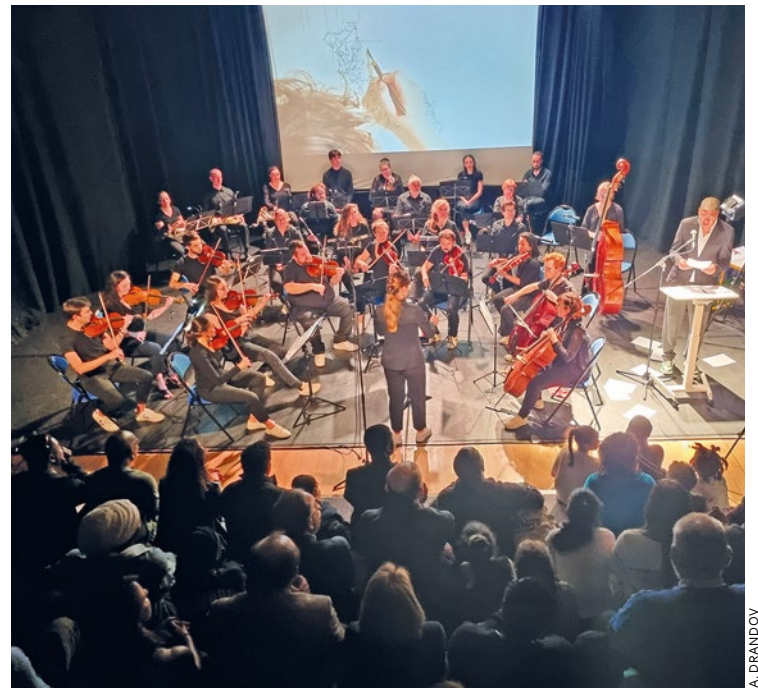
Un orchestre symphonique s'est déplacé au Chaplin pour la restitution de Tour à Tour.