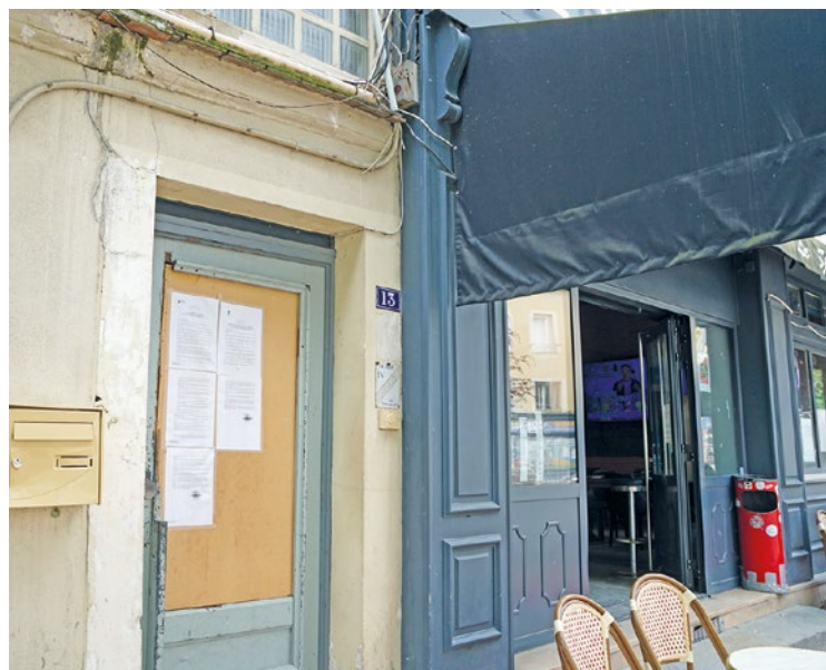
Les portes du Sporting resteront fermées, au moins, pour les deux prochaines semaines.

Cet épisode ne fut que l'épilogue d'une longue série de dérives. Entre nuisances sonores répétées et tensions avec le voisinage, la municipalité avait déjà dû supprimer la terrasse dès 2023. D'ailleurs, les problèmes de sécurité ne s'arrêtent pas au comptoir : en avril 2025, l'hôtel avait été évacué en urgence pour des risques d'incendie et de graves manquements électriques. Tant d'événements qui ont convaincu la Préfecture d'ordonner une fermeture administrative des lieux jusqu'au 24 janvier prochain. Si des travaux de rénovation ont été aperçus fin décembre, l'avenir de l'enseigne reste très incertain. ■