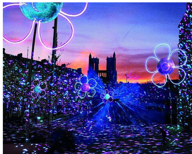
11 artistes seront représentés lors de cette édition.

Sans oublier le spectacle de drones qui illuminera le ciel le samedi 17 janvier à 19h30 au rythme de la bande son de Camille Rocailleux, tandis que deux concerts en lumière sont programmés les vendredi 23 et 30 janvier. ■