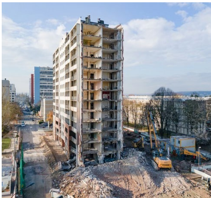
La technique du grignotage a déjà été utilisée par Melchiorre SA lors d'un chantier à Massy (Essonne).

Le président de Label Histoire aimerait une revitalisation de la forêt car « c'est le témoignage d'un Val-Fourré qu'on connaît très peu » tandis que la sexagénaire aurait bien vu un parc avec des jeux : « Il y en a quelques-uns rue Blériot, il me semble. Mais ce serait bien pour que les enfants puissent revivre ce qu'on a connu. » Par ailleurs, des symboles pourraient aussi être conservés afin d'indiquer leur ancien emplacement, comme le sapin en face de la tour 4 puisque celui-ci a été planté lors de la construction des deux immeubles. ■