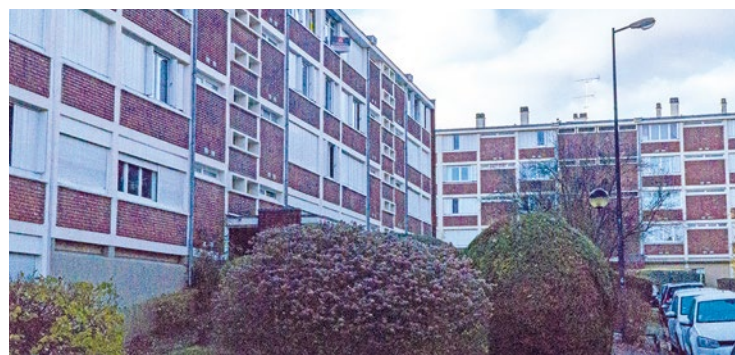
Pour contacter le collectif, il suffit d'envoyer un mail à l'adresse 212325alleedesbois@gmail.com.

Mais l'affaire a pris encore une autre tournure ces dernières semaines.