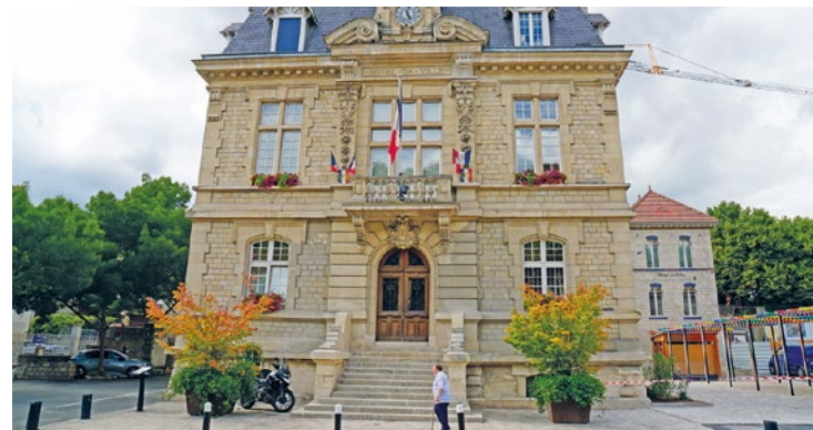
La municipalité s'engage à réaliser le projet lauréat dans les 2 prochaines années.

La Mairie a révélé le 5 janvier le nom des 15 projets éligibles au budget participatif de la Ville. Les habitants ont jusqu'au 31 janvier pour voter pour leur préféré. Celui recueillant le plus de suffrages verra le jour.