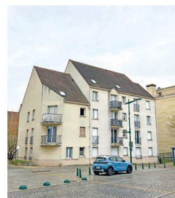
Dans quelques mois, des antennes seront installées sur le toit du 123 Route de Houdan... mais d'une manière particulièrement discrète.

optimale et de maintenir de bons débits sur le territoire communal, notamment en désaturant le réseau 4G grâce à la 5G. Pour en savoir plus, un Dossier d'Information Mairie (DIM) est mis à disposition sur le site internet de la municipalité (manteslaville.fr). ■