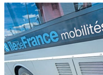
Pour retrouver l'ensemble des modifications, rendez-vous sur www.iledefrance-mobilités.fr.

Enfin, la sécurité des retours tardifs est renforcée avec l'ajout de nombreux arrêts pour le bus de soirée à Carrières-sous-Poissy et Poissy Est. Pour les scolaires, les lignes vers les lycées François Villon et Le Corbusier sont simplifiées. Attention, de nombreux itinéraires étant modifiés, il est vivement conseillé de consulter les nouveaux horaires sur les plateformes numériques d'Île-de-France Mobilités. ■