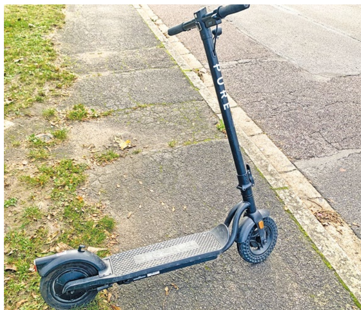
La Mairie a indiqué que cet arrêté serait en vigueur « tant que la sécurité des élèves l'exige ».