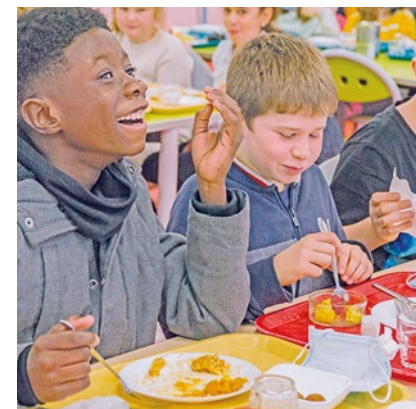
Chaque jour, C'midy confectionne 50 000 repas servis dans les collèges yvelinois.

en fin de mois sur la base des repas réellement consommés et non plus en préfacturation comme cela était le cas avec l'ancien contrat. Elior devra également consolider la qualité des produits utilisés, avec notamment un renforcement de l'achat des produits locaux (30% des achats actuellement). ■