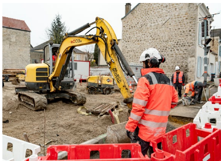
Une chaîne Whatsapp a été mise en place par Île-de-France Mobilités pour permettre aux riverains de suivre l'actualité des travaux.

Vers Achères, le boulevard de l'Europe poursuit sa percée vers la RD30. Aux abords des rues Saint-Sébastien et Adrienne Bolland, la construction du mur de soutènement définitif s'accompagne de travaux de réseaux imposant un alternat jusqu'à début mai. Enfin, sur le pont Saut-de-Mouton, des finitions sont prévues ces deux prochaines semaines, sans conséquence pour la circulation automobile. ■