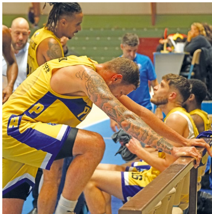
La défense friable du Poissy Basket a une nouvelle fois été exposée au grand jour.

Les Jaunes et bleus ont encore une fois encaissé plus de 100 points lors d'une rencontre de NM1, le week-end dernier face à Besançon (87-103). Ils restent 12 èmes de la poule A.