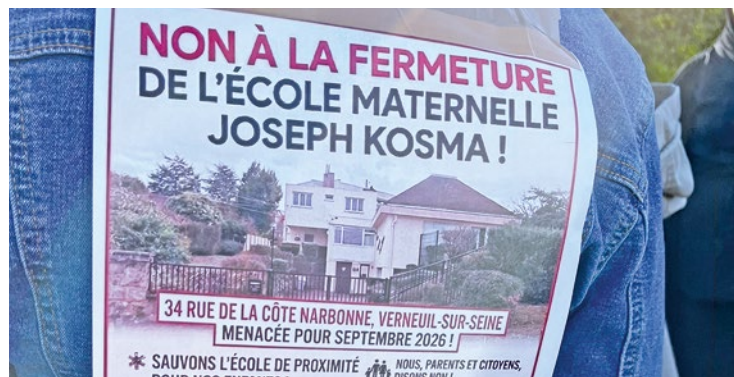
Une pétition circule depuis le 3 avril et a déjà recueilli plus de 1100 signatures.

Si la décision de fermer l'école semble donc bien entérinée – le vote doit avoir lieu lors du conseil municipal du 16 avril (à 15h) « et il n'y aura pas assez d'opposition » soupire Pauline – les parents poursuivent le combat. Ils se sont entretenus avec le député de la circonscription Aurélien Rousseau et promettent de poursuivre le combat jusqu'à ce que « la Mairie fasse machine arrière ». ■