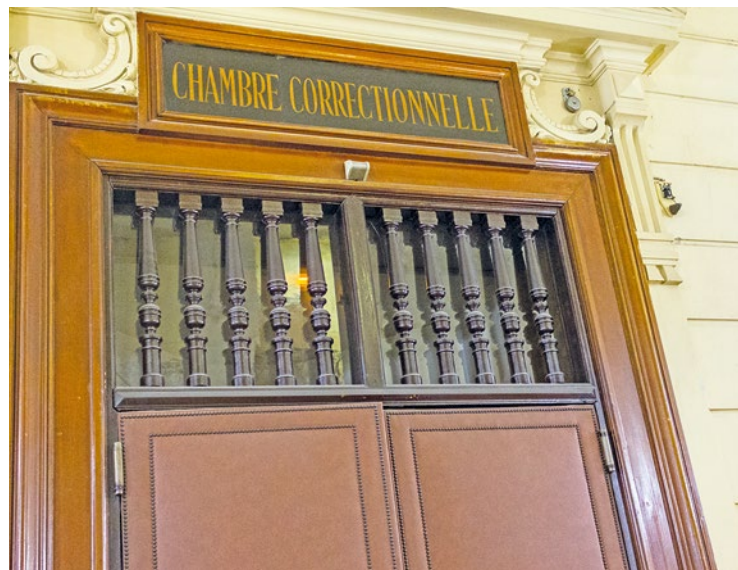
« J'avais besoin de passer mes nerfs » a expliqué devant les juges l'homme de 28 ans.

28 est présenté devant le tribunal de Versailles le 8 avril. Cure-dent dans des cheveux en bataille, il peine à reconnaître les faits. À la barre, il justifie sa fureur « à cause de son chômage » et aussi « aux amendes » quand il s'endort dans le train. « J'avais besoin de passer mes nerfs » résume-t-il devant les juges. Ceux-ci décident à l'issue de l'audience de lui infliger une peine de 6 mois de prison et il aura interdiction de paraître dans les Yvelines pour les 3 prochaines années. ■