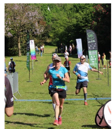
Les zones de départ et d'arrivée se situent toujours dans le parc du château d'Issou.

mètres, sans parler d'animations pour les enfants sur 1 kilomètre. Pour rappel, il n'y aura que 500 dossards toutes courses confondues pour le trail et la marche nordique, et aucune inscription ne se fera sur place. Pour participer, direction le site trail-portes-du-vexin-2026.onsinscrit.com. ■