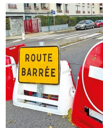
Les travaux ont nécessité un investissement de 1 022 500 € HT.

bile est maintenue hors des horaires de chantier (8h-17h), tandis que le stationnement est restreint : il est conseillé de se garer du côté de la place du 8 Mai 1945. Pour la collecte des déchets, les bacs doivent être déposés à l'angle de la rue Pasteur jusqu'au 24 avril. ■