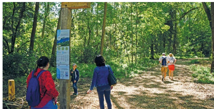
Bien qu'une grande partie de l'île demeure inaccessible à l'homme pour protéger la biodiversité, un sentier pédagogique a été créé pour guider les visiteurs.

jusqu'au 27 septembre prochain. L'accès à l'île se fait via la navette fluviale « La Conflanette », dont la réservation est gratuite sur le site Internet de l'Office de tourisme intercommunal Terres de Seine : ( www.terres-de-seine.fr ). D'ailleurs, à quelques kilomètres de là, la commune d'Andrésy a également rouvert l'accès à l'Île Nancy la semaine dernière. ■