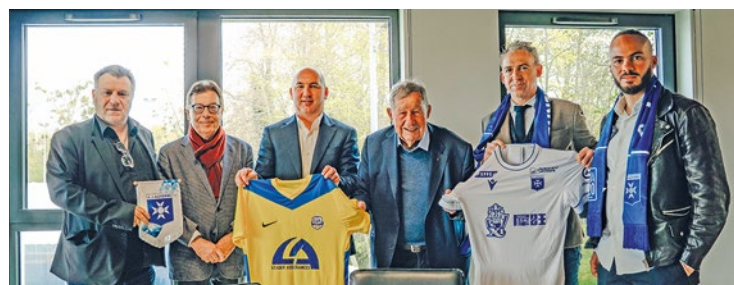
Dorénavant, le pensionnaire de R3 peut créer une « story » auprès de ces jeunes pousses.

Dorénavant, le pensionnaire de R3 peut créer une « story » auprès de ces jeunes pousses. « Si tu es sérieux, fidèle, tu peux éventuellement rentrer à l'AJA » assure l'entrepreneur, qui aurait pourtant pu se tourner vers une autre équipe attirant nettement plus la lumière : son voisin le PSG. Avec son centre d'entraînement et le projet de nouveau stade, le