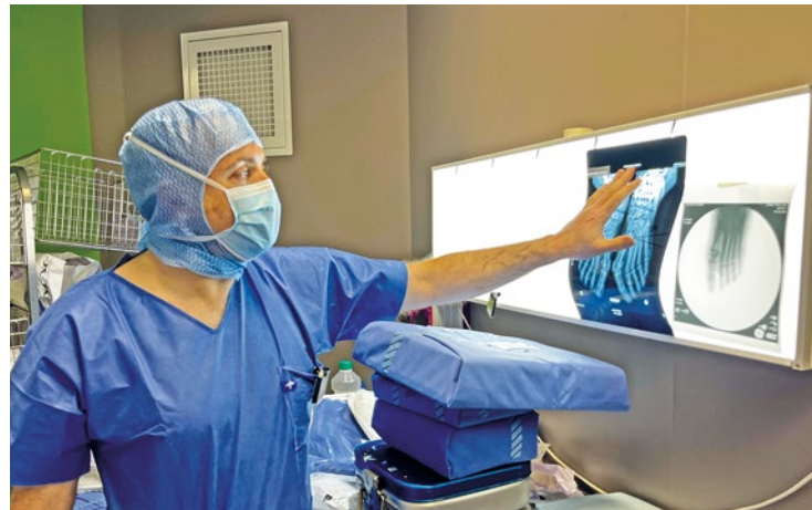
L'angle de déformation de l'hallux valgus peut parfois dépasser les 40°.