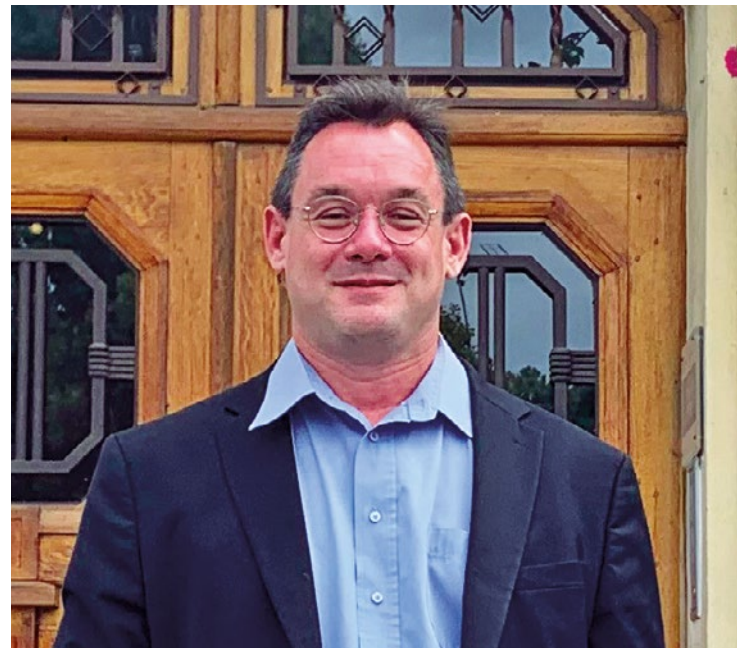
Être utile à sa commune : voilà précisément ce qui anime l'ancien maire d'Issou au moment de commencer son nouveau mandat d'élu minoritaire, qu'il promet constructif.

Si certains maires yvelinois vaincus lors des dernières élections municipales ont préféré jeter l'éponge et prendre du recul sur la vie politique, d'autres poursuivront leur engagement pour leur commune en endossant le costume d'élu minoritaire.