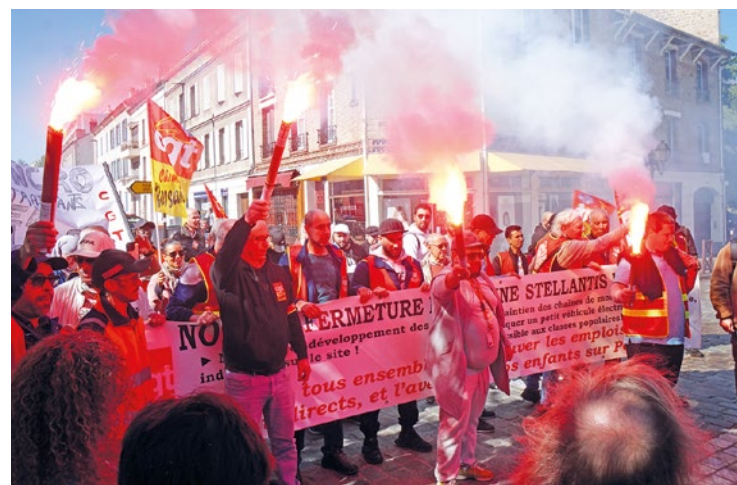
Le cortège est parti aux alentours de 11h30 de place de la République à Poissy pour finir au niveau de l'usine de Stellantis.