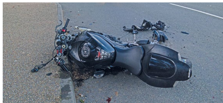
Un journaliste d'Actu.fr a assisté à une partie de la prise en chasse de la motocross.

Un grave accident a éclaté le 25 avril. Un motard a percuté une voiture de la gendarmerie à l'intersection de la D113 à Ecquevilly. À l'heure où nous écrivons ses lignes, ses jours sont toujours en danger.