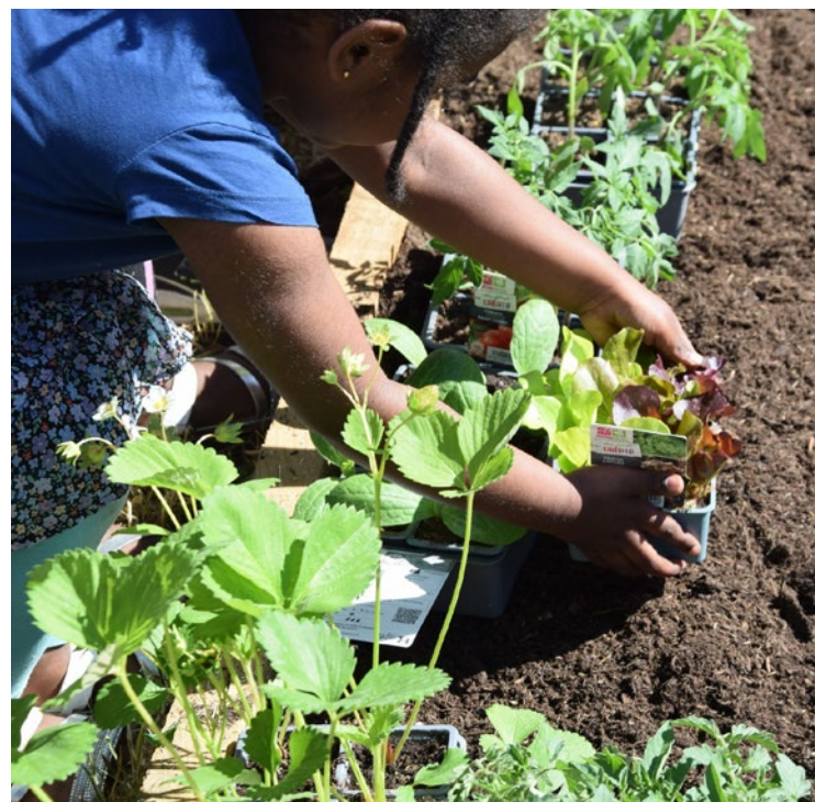
Les jeunes du Conseil Municipal des Enfants ont mis la main à la pâte aux côtés d'élus et de bénévoles.

La Ville de Chanteloup-les-Vignes inaugurerait, le jeudi 23 avril dernier, des jardins partagés aux côtés des Résidences Yvelines Essonne.