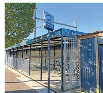
Les deux gares conflanaises sont désormais dotées de parkings vélos sécurisés.

sécurisés. Côté tarifs, la priorité est donnée aux abonnés réguliers. L'accès aux consignes fermées est totalement gratuit pour les détenteurs d'un passe Navigo annuel ou Imagine R. Pour les usagers occasionnels, les tarifs restent attractifs avec des formules à 2 euros la journée, 10 euros par mois ou 30 euros pour l'année complète. ■