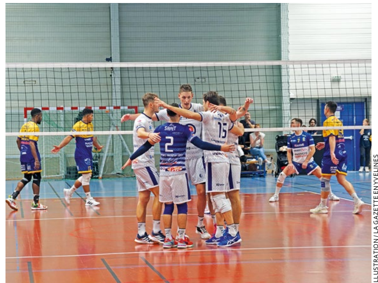
À deux matchs du terme, le CAJVB compte 43 en 23 journées, 12 points derrière le 3 ème .

saires ont sonné la révolte pour remporter les deux manches suivantes (25-23, 25-23). S'ils se sont offerts un sursis dans la fourlée (23-25), les Grenoblois ont fini par craquer lors du set décisif, remporté 15 à 6 par les locaux. Pour tenter de se rapprocher du podium, le CAJVB se déplacera à Harnes, 2 ème , le 2 mai dans un choc du haut de tableau qui promet d'être brûlant. ■