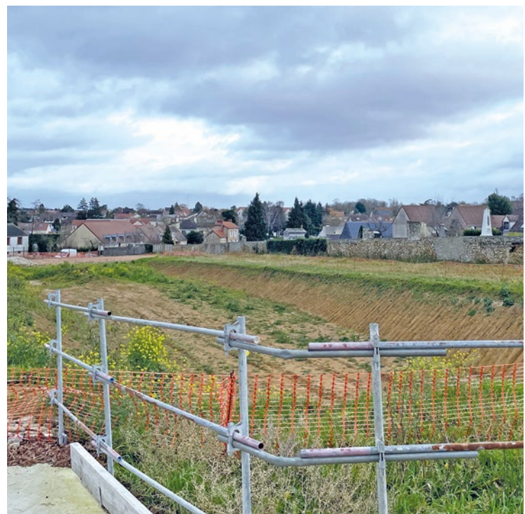
La nouvelle majorité orgevalaise n'a pas attendu pour annoncer des changements importants, tant dans les projets que dans la gouvernance.

La municipalité d'Orgeval a acté, lors du conseil municipal du 17 avril dernier, l'abandon du projet de groupe scolaire initié par l'ancienne majorité. L'école Pasteur sera quant à elle rénovée.