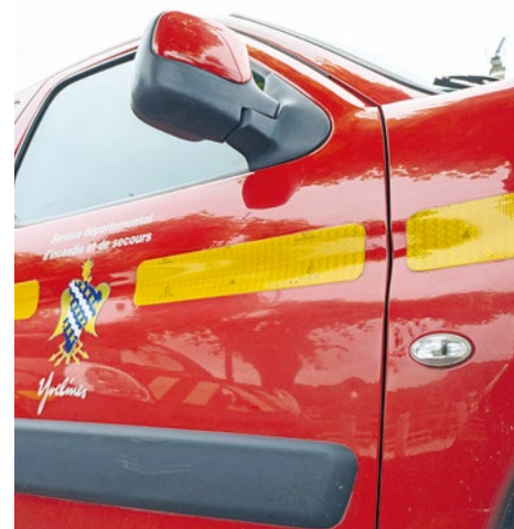
Les deux femmes ont été transportées à l'hôpital François-Quesnay en urgence relative.

première fois que des accidents se déroulent autour de Limay. En septembre 2025, sur le pont reliant cette commune à Mantes-la-Jolie, un automobiliste avait mortellement percuté une personne sur une trottinette électrique. ■