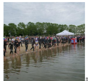
Le premier départ, celui du contre-la-montre en équipe, sera donné à 9h30.

mat S, CLM par équipes de 3 à 5), puis celui du triathlon S en individuel avec drafting (SuperLIFT et Open) sous les coups de 14h. Enfin, l'après-midi, place au triathlon XS en individuel avec drafting (SuperLIFT et Open) à partir de 16h30. Les plus jeunes ne sont pas oubliés avec des épreuves spécifiquement adaptées à leur âge. ■