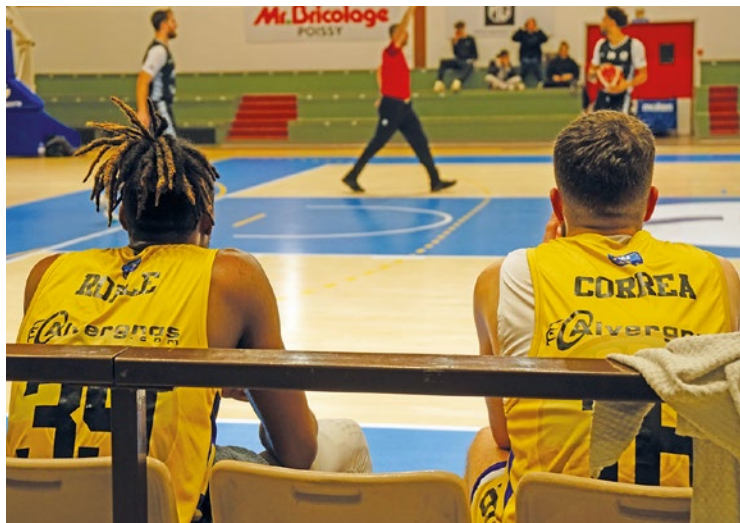
Le PBA vit une nouvelle fin de saison angoissante en cette année 2026.

Alors que la fin de la saison approche à grands pas, le Poissy Basket a toujours le plus grand mal à se donner de l'air en bas du classement. Les Jaunes et bleus ont en effet enchaîné une