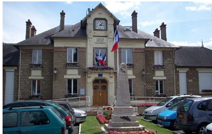
Suite à ce vol et ces dégradations, la Ville a décidé de porter plainte.

Le véhicule des services techniques d'Issou a été vandalisé le 21 avril alors que les agents réalisaient une opération d'entretien dans le secteur de la coulée verte.