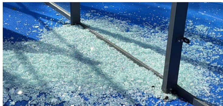
Le maire de Bois d'Arcy voudrait infliger des travaux d'intérêt général à l'auteur des faits.

Une vitre du terrain de padel de Bois d'Arcy a été réduite en miettes dans la nuit du 19 au 20 avril. Il s'agit de la deuxième dégradation en quelques mois. Le maire de la commune a déjà annoncé avoir identifié le coupable grâce aux caméras de surveillance.