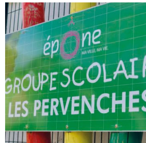
Il y a 160 demi-pensionnaires dans l'école élémentaire des Pervenches.

deleine Vernet. La Ville n'a pas encore communiqué de date pour les futurs travaux mais espère pouvoir les « commencer au plus tôt ». Par ailleurs, l'espace jeune sera déplacé en centre-ville, dans le bâtiment de l'ancien hôtel de ville. ■