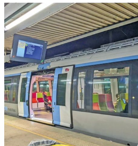
De nombreux travaux vont impacter le réseau ferroviaire en week-end ces prochaines semaines.

des éditions précédentes » a déclaré la Maison de fer, organisatrice de l'événement. Si les trains font défaut, la Mairie assure que l'agenda culturel reste dense avec le maintien de la Fête de la Nature et de la Nuit des Musées. ■