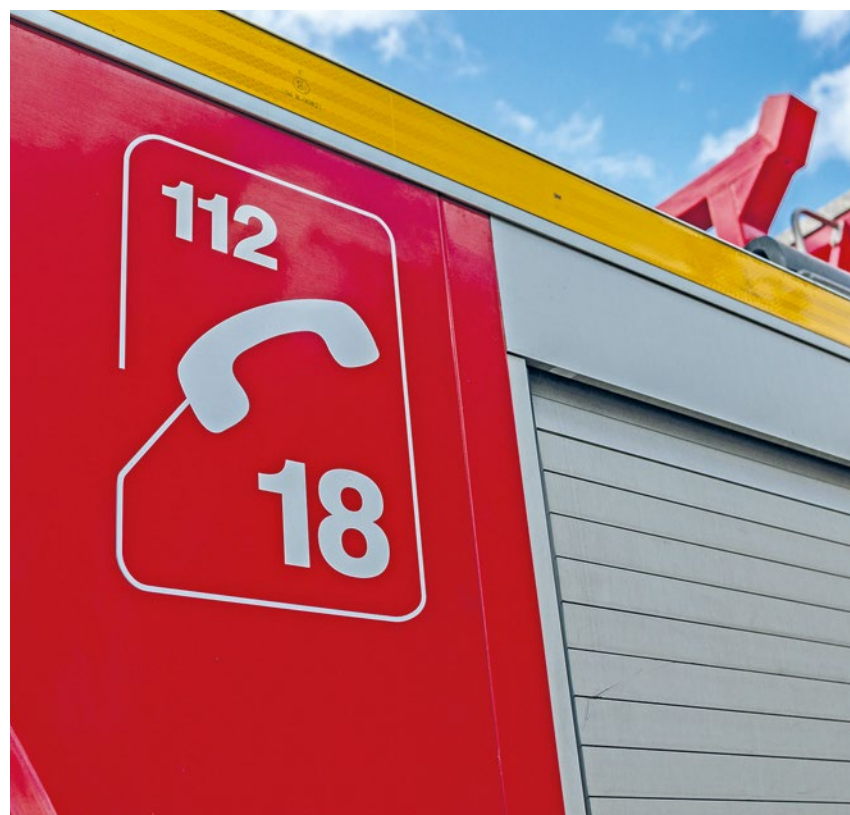
Les pompiers n'ont pas pu réanimer le septuagénaire.