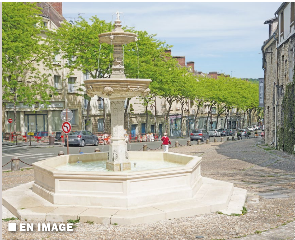
■ EN IMAGE

Le premier volet des travaux concerne la sente piétonne menant à l'école Le Centre. Ce passage fait l'objet d'une rénovation complète afin d'offrir « plus de confort et de sécurité » aux familles lors des trajets quotidiens. En parallèle, les équipes techniques procèdent à la requalification des bordures végétalisées situées aux abords immédiats de la médiathèque Octave-Mirbeau. Bien que le chantier se déroule du 27 au 30 avril, les services municipaux précisent que l'accès à la médiathèque est intégralement maintenu sur toute la durée de l'intervention. ■