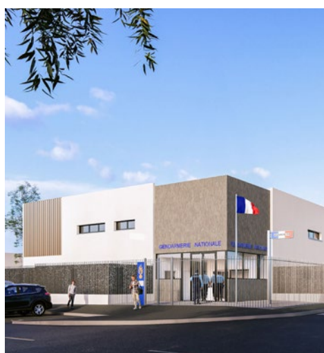
L'actuelle gendarmerie, vieille de près d'un siècle, a fait son temps.

Cette opération, dont la maîtrise d'ouvrage est assurée par Les Résidences Yvelines Essonne, doit démarrer concrètement au début de l'année 2027. Si le calendrier est respecté, les forces de gendarmerie pourront prendre possession de leurs nouveaux locaux dès la fin 2028. ■