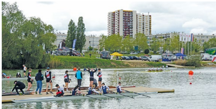
De nombreux curieux se rendent chaque année sur le bassin mantais pour observer les rameurs.

Les 16 et 17 mai, le Stade Nautique International Didier Simond accueillera la Régate Internationale de Masse, événement accessible à tous gratuitement.