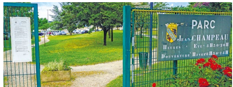
À Chanteloup-les-Vignes, le rendez-vous est donné le dimanche 7 juin de 8h à 17h du côté du parc Champeau.

place au parc du gymnase le 30 mai, tandis que le lendemain aura lieu ceux de l'Arpent du Prieur de Carrières-sous-Poissy, d'Ecqueville ou encore d'Issou et de Porcheville. À Chanteloup-les-Vignes, le rendez-vous est donné le dimanche 7 juin de 8h à 17h du côté du parc Champeau, avec restauration et buvette sur place, en parallèle de celles de Buchelay, au centre commercial Mon Beau Buchelay, ou encore de Flins-sur-Seine au parc Jean Boileau. Si avec ça, vous ne trouvez pas la perle rare... ■