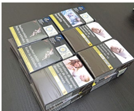
La société Philip Morris France s'était portée partie civile et touchera un euro symbolique au titre du préjudice d'image.

Le tribunal l'a condamné à trois ans d'emprisonnement avec maintien en détention. Il devra s'acquitter de deux amendes : une amende douanière de 4 000 euros plus une de 1 000 euros pour son refus d'obtempérer. ■