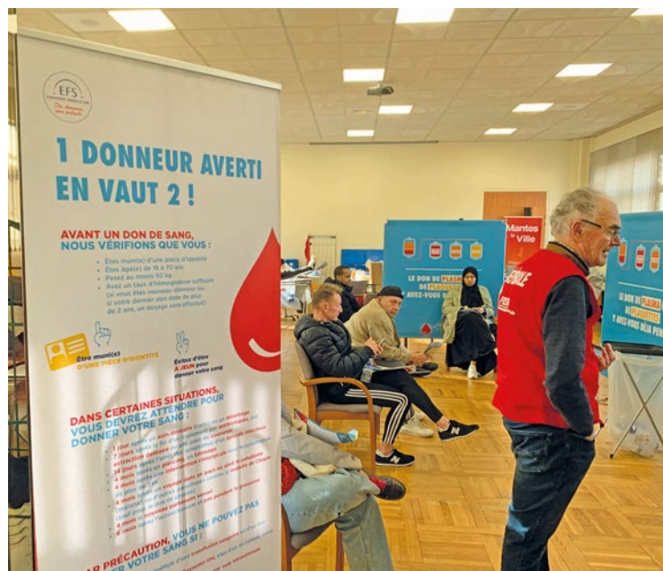
Le don de sang en collecte mobile nécessite de prendre rendez-vous en ligne en amont.

possible de donner son sang à l'espace Michel Colucci de Carrières-sous-Poissy le 7 juin, à l'espace des arts de Villennes-sur-Seine le 8, et au 49 avenue de la République des Mureaux le 15 juin. Pour plus d'informations, rendez-vous sur le site de l'Établissement Français du Sang ( dondesang.efs.sante.fr ). ■