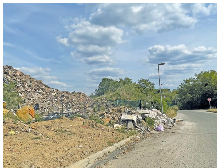
Une inspection d'avril 2024 relevait encore une quantité « préoccupante » de déchets, débordant par endroits sur la voie publique.

l'absence d'évacuation des déchets. La société a été placée en liquidation judiciaire quelques mois plus tard, en juin 2023. C'est donc son mandataire liquidateur qui devra