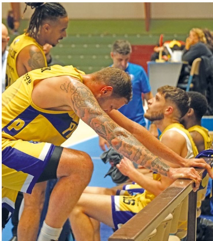
Le Poissy Basket sera-t-il une nouvelle fois sauvé administrativement ?

Battus par Charleville-Mézières sur le score de 109 à 100 lors de la dernière journée de NM1, les Jaunes et Bleus sont relégués sportivement en Nationale 2.