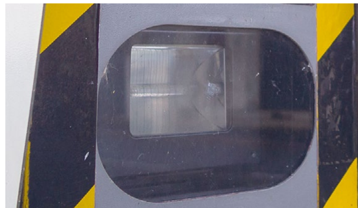
La prudence sera de mise pour les prochaines semaines.

Il faudra être d'autant plus vigilant que la vitesse maximale est limitée à 90 km/h sur ce tronçon temporairement réaménagé. En effet, le dispositif vise à sécuriser cette zone et à inciter les véhicules à lever le pied en approchant de la zone de travaux. Il devrait ainsi être retiré à la fin du chantier, soit le 19 juin prochain. ■