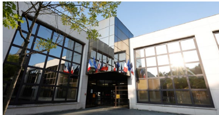
Les conclusions seront présentées aux parents prochainement.

Mi-avril, les parents d'une petite fille de 3 ans avaient porté plainte contre un animateur soupçonné de lui avoir infligé des sévices sexuels. La Mairie a indiqué dans une conférence de presse le 4 mai avoir ouvert sa propre enquête administrative qui s'ajoutent à celle de la police et du Service départemental à la jeunesse, à l'engagement et aux sports (SDJES).