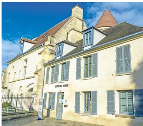
L'occasion de découvrir les établissements culturels du territoire sous un autre jour.

Plus à l'ouest, à Mantes-la-Jolie, le Musée de l'Hôtel-Dieu abritera un escape game, une visite de l'exposition « Les animaux de Mantes », ou encore la découverte des collections de l'établissement. Pour plus de détails sur les programmes, rendez-vous sur le site nuitdesmusees.culture.gouv.fr . ■