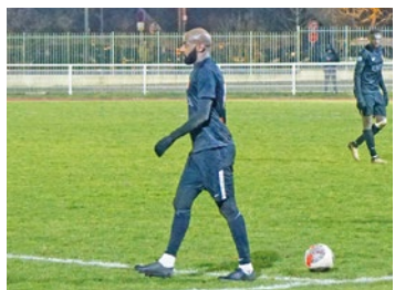
Comme la saison dernière, le FC Mantois pourrait bien nourrir de gros regrets à l'issue de la saison.

Alors qu'une victoire aurait pu leur permettre de rêver à la montée suite à la défaite du leader, les joueurs du FC Mantois n'ont pas su prendre le meilleur sur la réserve sur Paris Atletico (0-0), le samedi 9 mai.