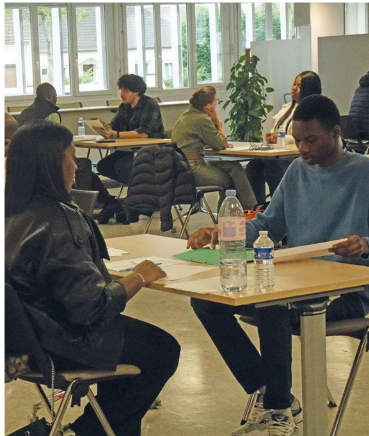
Plusieurs raisons peuvent expliquer l'afflux massif de demandeurs d'emplois en ce mardi 5 mai.

En juin prochain, le géant de l'ameublement suédis inaugurer sa nouvelle plateforme logistique à Limay. Pour recruter ses futurs employés, un job dating s'est tenu le 5 mai à l'Agora de Mantes-la-Jolie. Un engouement massif, révélateur d'un projet qui dépasse largement les frontières du bassin d'emploi local.