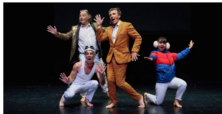
En 25 ans, la Compagnie Zygomatic a donné plus de 2000 représentations aux quatre coins de la France.

ties, chorégraphies et chansons s'entremêlent pour dresser un portrait sans concession d'un monde au bord du gouffre. La compagnie fait le pari audacieux de l'humour absurde pour aborder ce qui constitue le défi majeur du siècle : la crise climatique et la raréfaction des ressources. Pour découvrir cette création artistique pas comme les autres, vous pouvez prendre vos billets sur andresy.notre-billetterie.com , proposés à des tarifs allant de 16 à 25 euros, et rendez-vous le 28 mai prochain à l'Espace Julien-Green d'Andrésey, sous les coups de 20 heures. ■