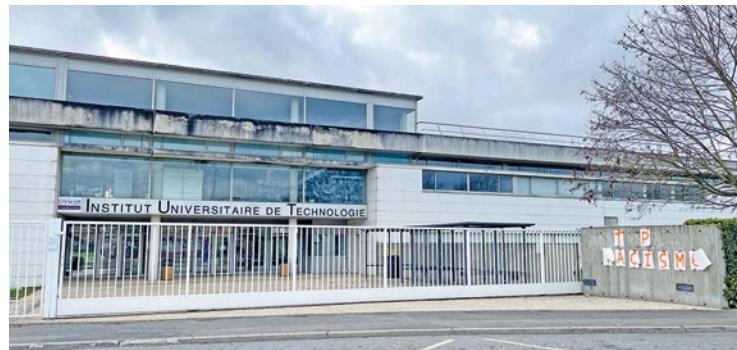
L'accord repose sur une volonté de renforcer l'adéquation entre les parcours de formation et les futurs métiers de l'industrie.

Le mardi 19 mai, l'établissement scolaire et le groupe automobile international signeront une charte d'objectifs partagés. Elle permettra le développement de l'apprentissage et de l'insertion professionnelle des étudiants.