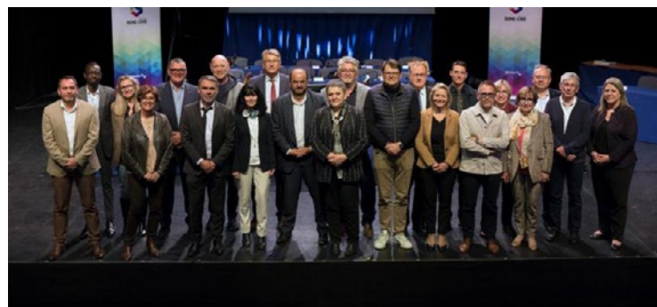
12 Vice-président et 6 conseillers délégués composent le bureau exécutif de la communauté urbaine.