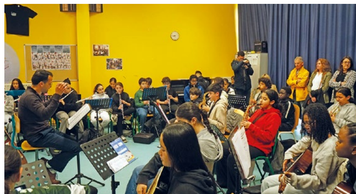
La classe orchestre participe aussi à des événements organisés par la Ville.

« Il y a une synergie différente. Leurs travaux pratiques se passent mieux,