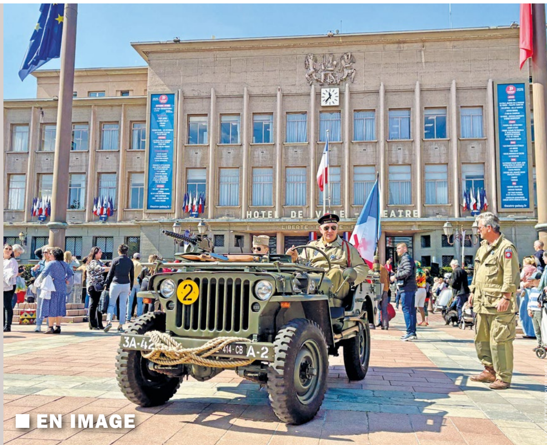
■ EN IMAGE

À l'occasion de la Journée de l'Europe le 9 mai, le Département des Yvelines met en lumière Mouv'in Europe, un programme qui aide des jeunes à reprendre confiance et construire leur avenir grâce à une expérience à l'étranger. Il s'adresse aux personnes entre 18 et 30 ans, en rupture scolaire, professionnelle ou sociale, engagés dans une démarche de réorientation, d'ouverture et d'autonomie. Les heureux élus seront sélectionnés sur la base de leur motivation et si l'expérience à l'étranger est cohérente avec leur souhait d'orientation. Les stages dureront trois ou quatre mois et peuvent s'effectuer en Allemagne, Espagne ou Irlande. Chaque participant bénéficiera d'une aide financière de 500 euros par mois de la part du Département. La Maison De l'Europe Yvelines – Centre Europe Direct soutient également ce dispositif et peut aider les jeunes intéressés à trouver leur stage. ■