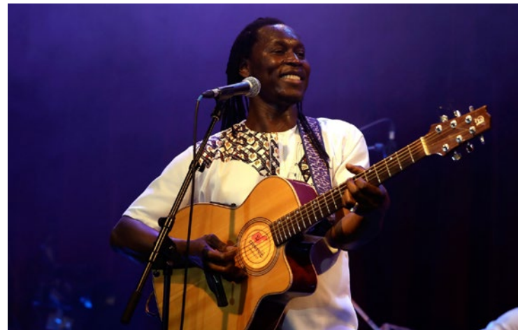
Après le concert de Malick Diaw, l'exposition de peinture sénégalaise et de Batik restera accessible jusqu'au 6 juin.

communautaire GPSEO depuis le 19 mai. Exposition de peinture et de batik, atelier cuisine, ronde des contes pour les enfants, projection du documentaire Les gardiens du temple de Bertrand Paquez... Autant d'entrées différentes dans une culture riche et souvent mal connue des Yvelinois. Pour en avoir un aperçu, le concert de Malick Diaw est gratuit sur réservation de 15h30 à 16h30. Pour assurer votre présence, rendez-vous sur biblios.gpseo.fr , ou appelez le 01 73 01 86 80. ■