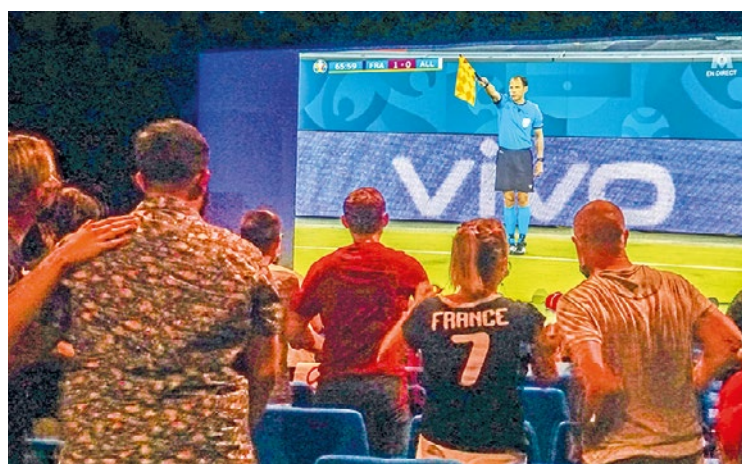
Attention, le coup d'envoi est prévu dès 18h ce samedi 30 mai.