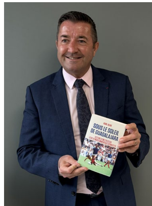
Michel Drucker était déjà au micro d'Antenne 2 pour commenter ce match.