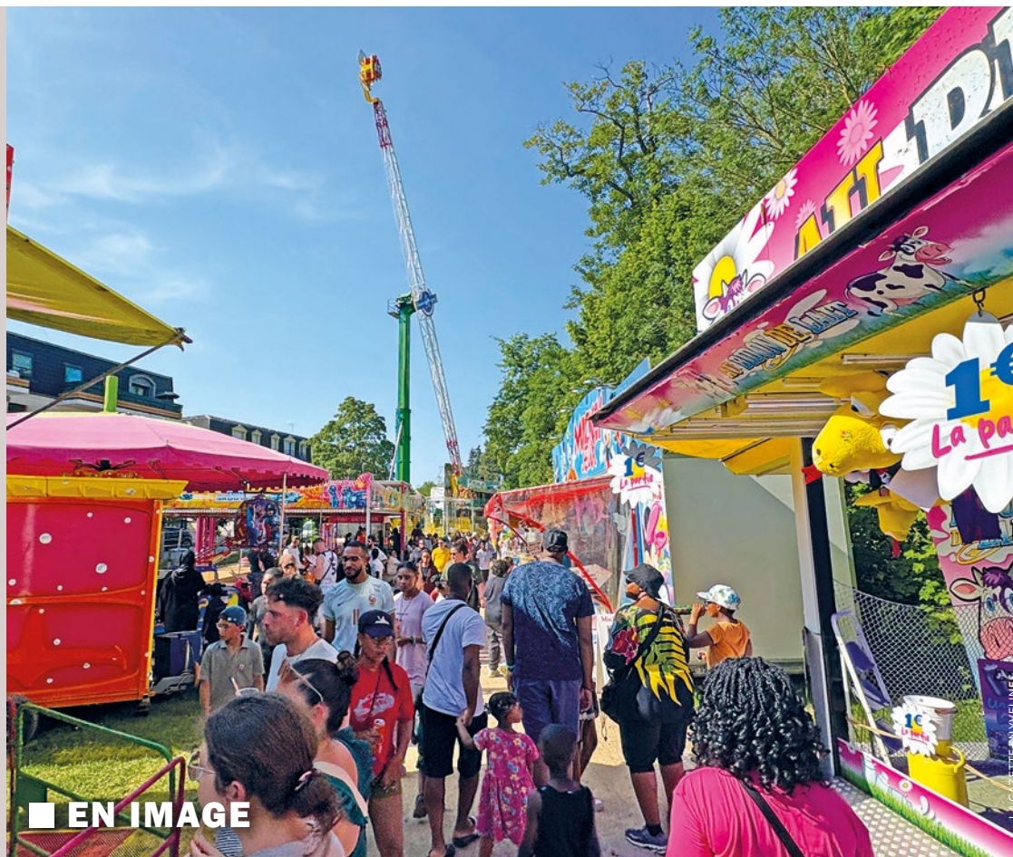
■ EN IMAGE

L'initiative rassemble habitants, familles et partenaires du quartier autour d'un objectif simple : ramasser les déchets, améliorer le cadre de vie et sensibiliser au respect de l'environnement. Les enfants sont particulièrement bienvenus. L'action est en effet pensée pour leur faire découvrir, de manière concrète et ludique, l'importance de prendre soin de leur environnement. Au-delà du coup de propre, l'opération est aussi une occasion de renforcer les liens de voisinage et de montrer que l'engagement collectif peut changer, même modestement, le visage d'un quartier. Les inscriptions se font auprès de l'accueil du CVS au 01 30 33 00 33. ■