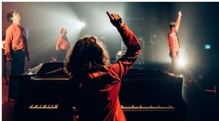
Accompagnés d'un orchestre, ils revisitent la variété française, le rap et les tubes des années 80 en abordant des thèmes d'actualité avec humour.

Accompagnés d'un orchestre varié, ils enrichissent le tout de parodies théâtrales. Pour prendre vos billets, accessibles à des tarifs allant de 25 à 35 euros, et ainsi assister au spectacle de ces joyeux lurons, cela se passe sur le site andresy.notrebilletterie.com . ■