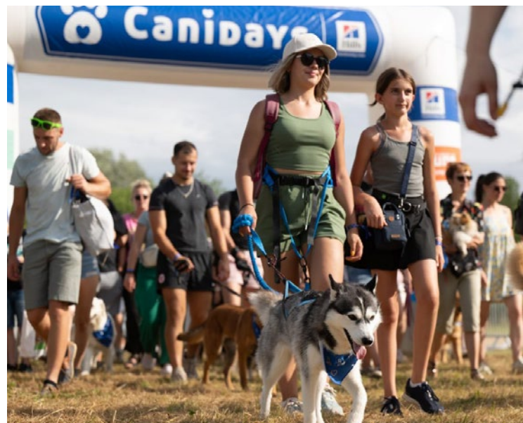
À noter que la laisse est obligatoire sur l'ensemble du site, et les chiens de catégorie 1 ne sont pas admis.

transformera, ce week-end des 29, 30 et 31 mai, en terrain de jeu géant pour les chiens et leurs propriétaires.