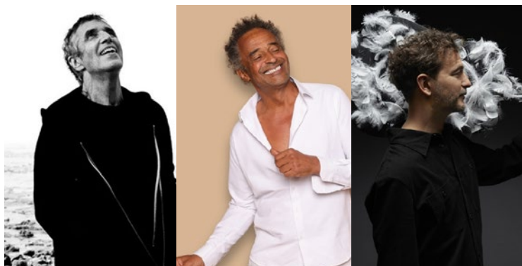
Pour en savoir plus sur l'intégralité des dates de cette nouvelle saison, cela se passe sur www.theatre-simone-signoret.fr .

établissements municipaux les plus fréquentés d'Île-de-France avec près de 40 spectacles par an, a misé sur une programmation plurielle, entre concerts, humour, magie, danse et théâtre.