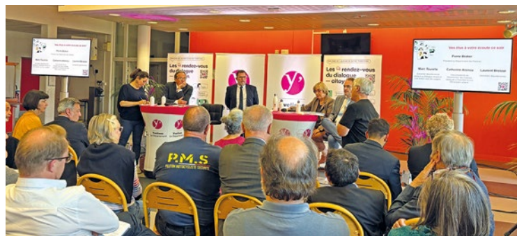
Le prochain Rendez-vous du dialogue citoyen aura lieu le 1 er juillet à Rambouillet.