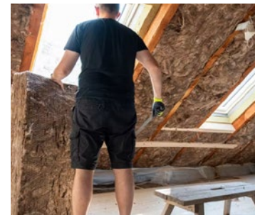
L'arrivée de l'été est l'occasion de trouver des solutions pour mieux vivre les fortes chaleurs... et réduire ses factures.

Pour ceux qui envisagent des travaux, des conseillers France Rénov' seront disponibles pour orienter sur les aides financières et les solutions adaptées à chaque logement. Pour retrouver le programme complet, cela se passe sur gpseo.fr ■