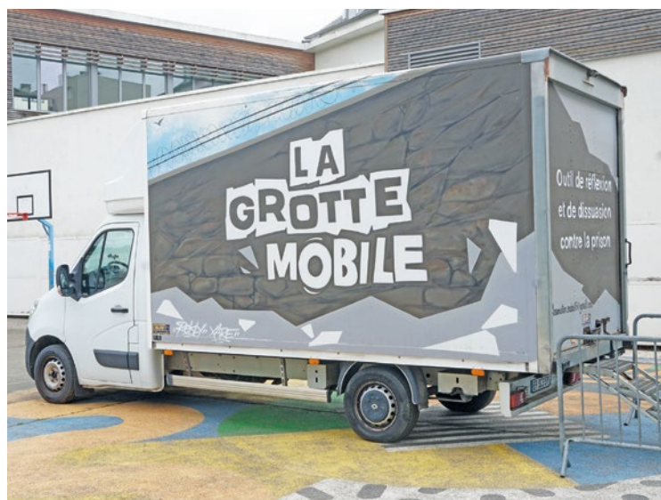
Depuis 2025, l'association SADA utilise la Grotte mobile pour montrer la réalité de la prison.

En fin d'après-midi, l'acteur de prévention repart. Demain il sera dans une autre ville francilienne. « Mon récit leur permet de se remettre en cause et avoir le choix. Mais après ça, ils restent responsables de leurs actes » rappelle l'ancien prisonnier. La réalité vient brusquer son discours : le soir même une rixe a éclaté à Guyancourt et un adolescent a dû être transporté en urgence à cause d'une blessure à l'arme blanche. ■