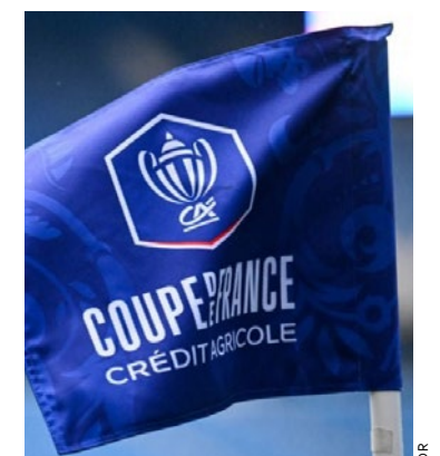
Vacances méritées, désormais, pour les équipes du territoire.

but face à Marcouville City (1-1, 5 t.a.b. 4). Le Poissy FC sera lui aussi au rendez-vous (3-0 face à Saint-Vrain), tout comme Saint-Germain-en-Laye (5-3 face au Tremplin Foot) et le FC Conflans (1-1, 2 t.a.b. 4). ■