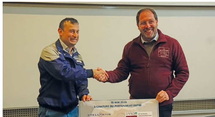
Stellantis embauchera 5 apprentis par an.

Par ailleurs, Stellantis n'exclut pas à l'avenir d'autres partenariats universitaires avec l'Université Versailles-Saint-Quentin qui gère l'IUT de Mantes-en-Yvelines mais aussi son voisin de l'Institut des Sciences et Techniques des Yvelines (ISTY, basé à Mantes-la-Ville) qui propose des formations d'ingénieur. « C'est un sujet en réflexion », confie Éric Haan, rappelant au passage que « la force ingénieur la plus forte au monde de Stellantis est basée à Poissy ». ■