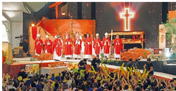
Les années paires, le FRAT se déroule à Jambville et les années impaires à Lourdes.