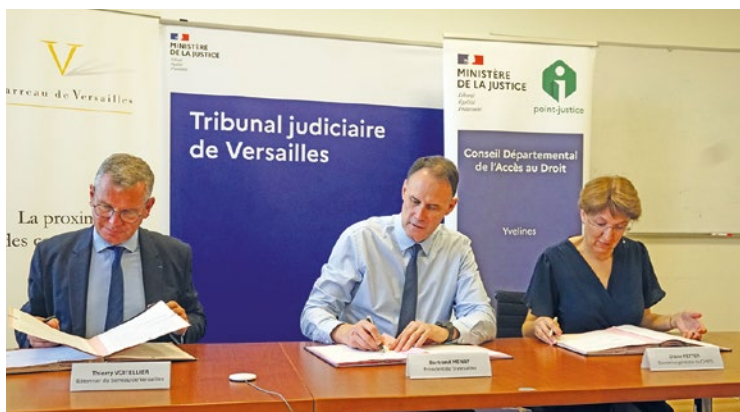
La première permanence aura lieu dès le 2 juillet à Poissy, soit un petit mois après la signature de la convention.

Un premier bilan sera effectué au bout de six mois afin de mener des actions correctives derrière. Un autre se tiendra également au bout d'un an et pourrait donner lieu à une augmentation du nombre de rendez-vous. Cette convention est conclue pour une durée de deux ans. Ce n'est pas la première fois que le tribunal de Versailles instaure des permanences particulières pour des personnes fragiles. En effet, depuis décembre 2024, une permanence inclusive avec des avocats formés pour la communication avec des personnes présentant un handicap est présente le vendredi matin. ■