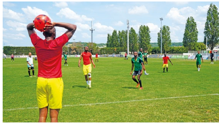
C'est parti pour quatre week-ends de compétition au Val-Fourré.

Ce week-end des 6 et 7 juin marque le début de deux tournois de football qui font battre le cœur des quartiers populaires de la Vallée de Seine. À Mantes-la-Jolie, la septième édition de la Coupe des Nations mantaise ouvre ses portes samedi au Val-Fourré, tandis qu'aux Mureaux, la CAN LMX lance sa nouvelle édition au stade Léo Lagrange.