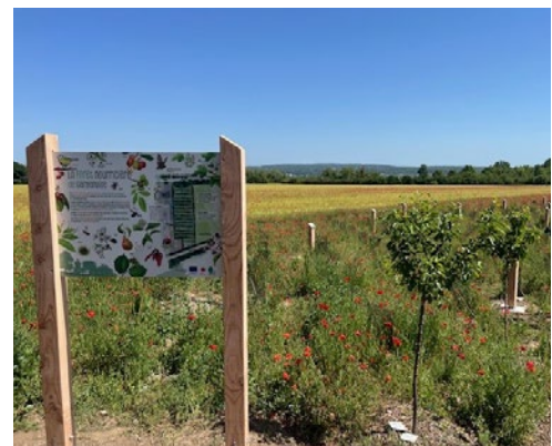
Un nouvel espace de nature à Gargenville.

plantations, l'équipe des espaces verts de la Ville est fortement mobilisée. Un arrosage régulier est maintenu plusieurs fois par semaine tout au long de l'été. Désormais ouvert au public, ce nouvel écrin de nature appelle au respect de chacun pour préserver cet écosystème en devenir. ■