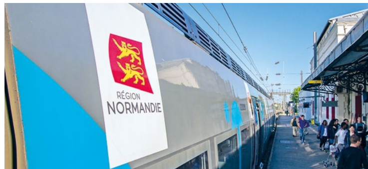
Mi-mai, c'est 11 arrêts qui avaient été rétablis sur à la grogne des représentants des usagers.

Depuis le 1 er juin, les 21 arrêts supprimés du Mantois sont de nouveau effectifs. La direction de la SNCF Normandie estime cependant qu'il faudra attendre la mi-juin pour voir une situation « quasi-normale ».