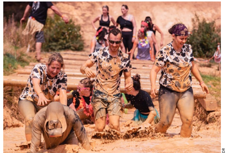
Pour son escale « parisienne », la course prend ses quartiers dans le domaine de Forest Hill, route des Ferrets, à Montalet-le-Bois ce dimanche 7 juin à partir de 8h.

et réserver ses dossards (au tarif de 60 euros) pour cette course de 8 kilomètres pas comme les autres, cela se passe sur ruedesfadas.fr/course-paris-2026/ . Ce sera d'ailleurs votre dernière chance de devenir « Fada » : les organisateurs ont annoncé qu'après 10 années d'aventure, l'édition 2026 serait la dernière en raisons des difficultés économiques rencontrées des suites de la pandémie de Covid-19. ■