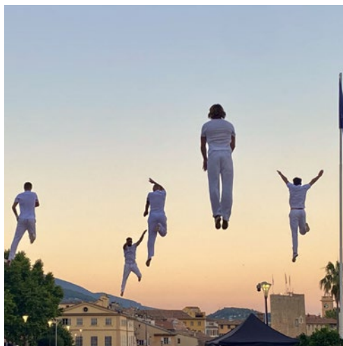
Restauration et animations sont prévues sur place.

Cirque aérien, fanfare et bal électro-folk investiront le parc du château d'Hanneucourt, le dimanche 14 juin, à l'occasion de la clôture de saison du Théâtre de la Nacelle.