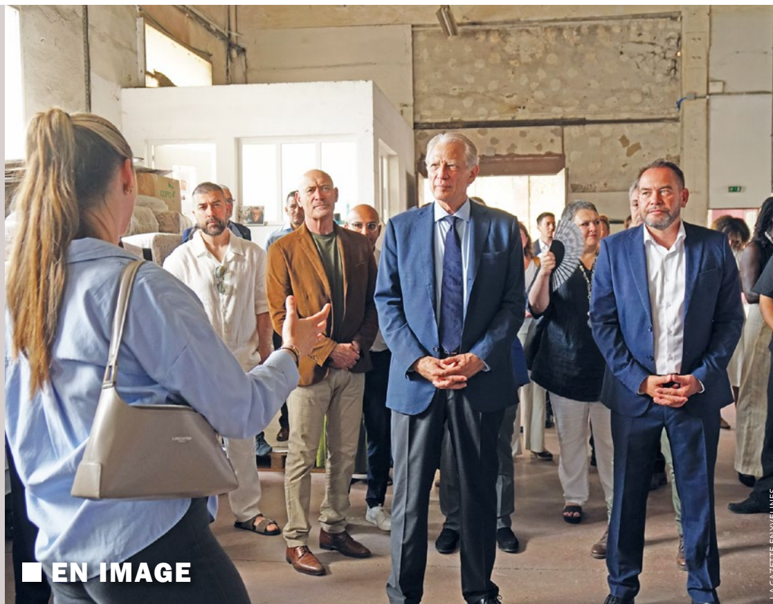
■ EN IMAGE

En effet, il a été voté le 27 mai lors du conseil municipal une délibération actant la rénovation de l'école élémentaire Pierre Brossolette. Elle doit notamment améliorer les performances énergétiques de ce bâtiment datant des années 60. Ce projet sera pris en charge à hauteur de 71 % par des subventions que la commune a obtenues de l'Etat, du département des Yvelines et de la région Île-de-France. Il coûtera plus de 2,6 millions d'euros. Toutes les autres délibérations sont à retrouver sur le site internet de la Ville des Mureaux. ■