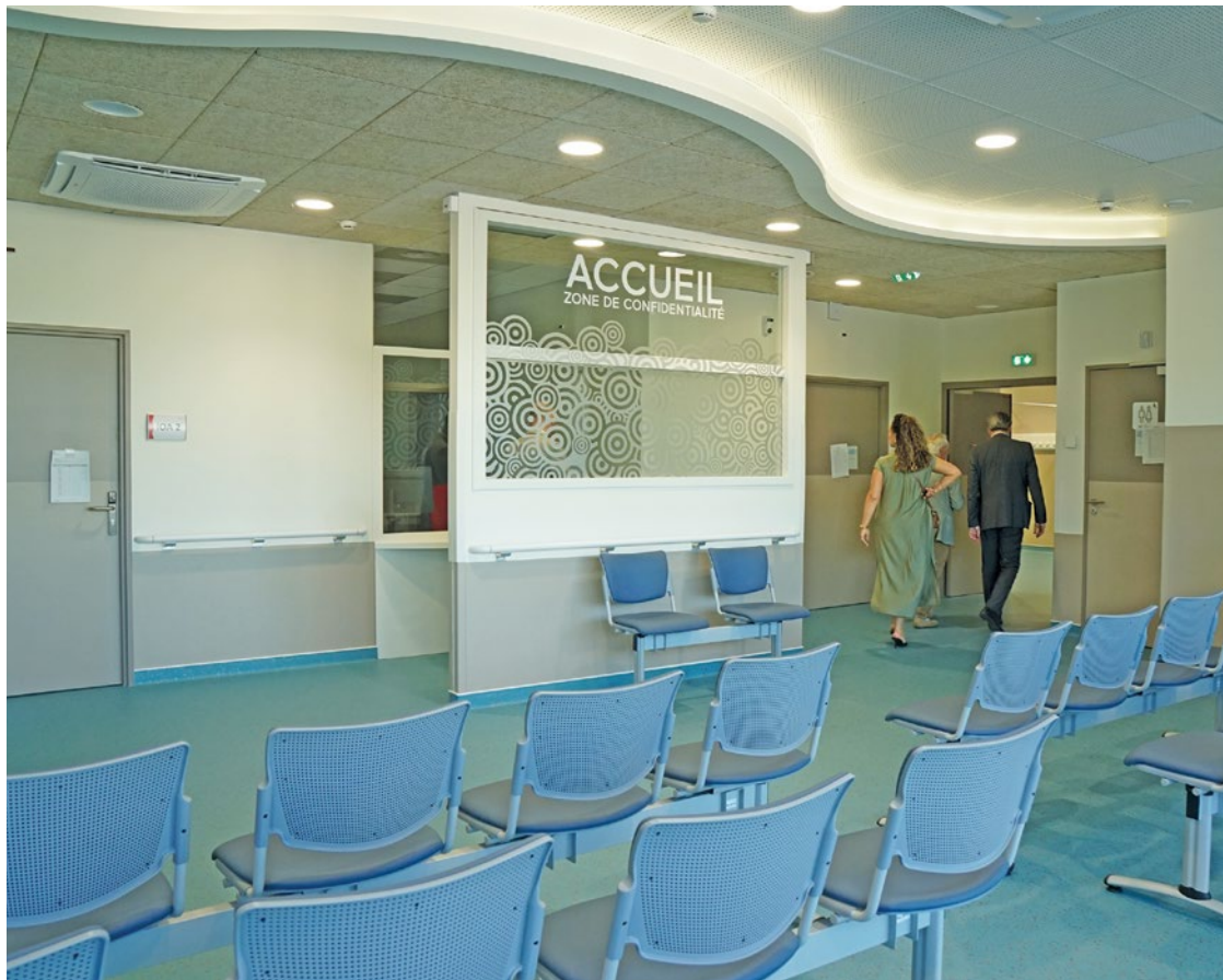
Plus d'espaces, meilleure circulation : les conditions d'attente ont été grandement améliorées.

Le Centre Hospitalier François Quesnay de Mantes-la-Jolie a levé le voile sur son nouveau bâtiment des urgences, qui accueille ses premiers patients ce mercredi 3 juin. Capacité d'accueil doublée, meilleur circuit de soin... Ce nouvel équipement doit permettre au personnel médical de travailler dans de meilleures conditions, et donc aux habitants du Mantois (et au-delà) de bénéficier de meilleurs soins.