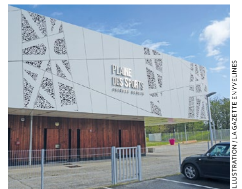
L'entrée est libre et ouverte à tous, avec une petite restauration prévue sur place.

des Sports Grigore-Obreja, avec parmi elles une sélection du Paris Saint-Germain. L'événement est organisé par Délos Apei 78, association médico-sociale yvelinoise engagée depuis plus de 60 ans aux côtés des personnes en situation de handicap mental, psychique, autistique ou polyhandicapées. Elle accompagne aujourd'hui