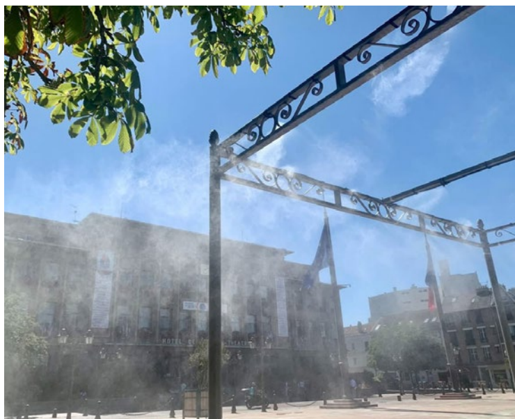
Les Pisciacaises et Pisciacais ont pu profiter de pauses rafraîchissantes bienvenues en centre-ville.

Les parcs et jardins sont même restés ouverts jusqu'à 22h : parc Meissonier, parc du Château de Villiers, parc de la Charmille, promenade du bord de l'eau. Des salles climatisées ont été mises à disposition des aînés à la Maison Bleue et à la résidence Les Ursulines... tandis que les jeunes du quartier Saint-Exupéry ont employé eux-mêmes les grands moyens (voir en page faits-divers). À Conflans-Sainte-Honorine, des brumisateurs ont également été installés sur les marches situées sur les quais de Seine, l'un des espaces les plus fréquentés de la ville... en période estivale. ■