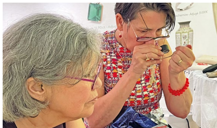
80 % du prix de l'enchère revient au vendeur.

Les Meulanais avaient également ramené des couverts, potentiellement en argent. Finalement, ce n'est que du métal argenté car il n'y avait pas le poinçon caractéristique. Idem pour un œuf d'autruche... qui s'avère être juste de la faïence. « Cela fait partie des