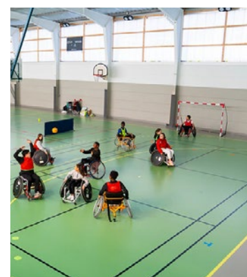
Ces journées favorisent également l'inclusion par la mixité avec la participation de jeunes en situation de handicap.

promotion du sport pour tous. Un exploit dont peut déjà être fier le Département puisqu'il y avait plus de 270 candidatures. Les lauréats pour chacune des 5 catégories seront annoncés lors de la cérémonie de remise des prix à Bruxelles le 23 juin 2026. ■