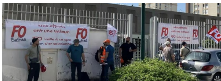
Plusieurs salariés en grève ont occupé le site mantais de Safran le jeudi 28 mai.