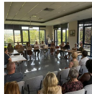
Informer, consulter, concerter : la démarche participative trouve ici une traduction concrète, loin des grandes consultations formelles.

Cette initiative illustre une volonté de l'équipe municipale de dépasser le cadre institutionnel habituel pour associer les Épônoises et Épônois aux réflexions sur l'avenir de leur ville. Si l'expérience se confirme dans la durée, elle pourrait devenir un rendez-vous régulier de la vie locale épônoise. ■