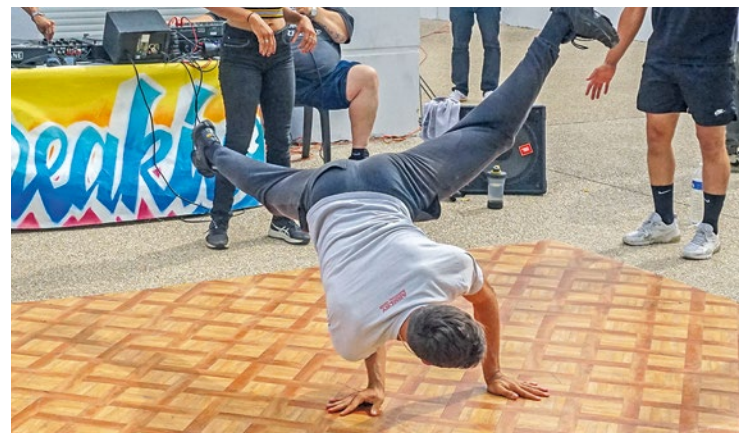
L'entrée est gratuite et une restauration sera proposée sur place.

le jury par leur technique, leur créativité et leur sens du rythme, dans un format directement inspiré des compétitions de culture urbaine. Au-delà de la compétition, le rendez-vous veut aussi mettre en avant la scène hip-hop locale et offrir un espace d'expression à de jeunes pratiquants. Le public pourra suivre les performances dans un décor inspiré du graffiti et dont l'ambiance sera assurée par des animations musicales. ■