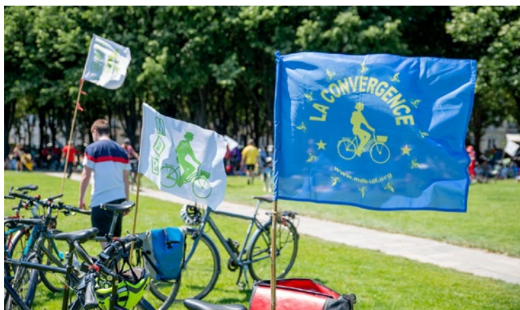
Gratuite et ouverte à tous, La Convergence est organisée localement avec le Collectif Vélo du Mantois.

Si l'événement rassemble chaque année de nombreux amateurs de