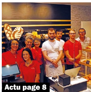
Actu page 8