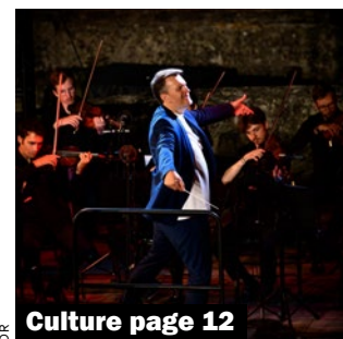
Culture page 12

Cette pâtisserie yvelinoise réputée lance sa boulangerie