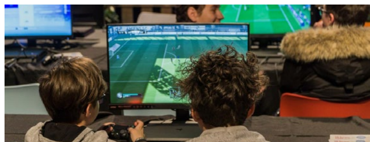
Ce partenariat permettra d'encadrer la pratique de l'esport tout en faisant la promotion d'un bon usage du jeu vidéo.