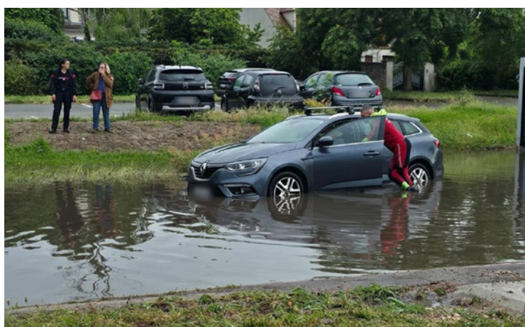
Virginie Meunier a dû gérer deux urgences dans la même matinée.

le ciel. Une semaine après les fortes chaleurs, les Yvelines ont connu de fortes précipitations, notamment