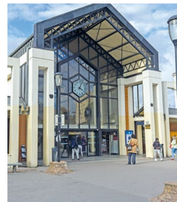
Toutes les informations sont à retrouver sur transilien.com.