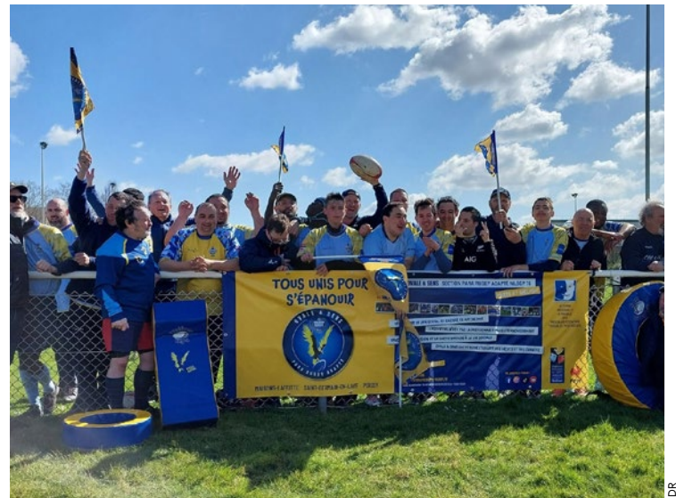
Entre 250 et 300 participants sont attendus.

dan ouvrira ses portes pour une journée mêlant ateliers découverte multi-sports (rugby, judo, football, boxe, tir à l'arc), tournoi adapté et animations, avec fanfare et DJ en continu. Entre 250 et 300 participants sont attendus. La soirée se poursuivra à partir de 19h au Centre de Diffusion Artistique de Poissy, avec dîner, animations et retransmission d'une demi-finale du Top 14. ■