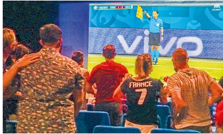
C'est parti pour un mois de compétition.

Alors que le Mondial de football est sur le point de débiter, plusieurs villes de la Vallée de Seine ont d'ores et déjà prévu de diffuser les matchs de l'Équipe de France sur écran géant. On fait le point.