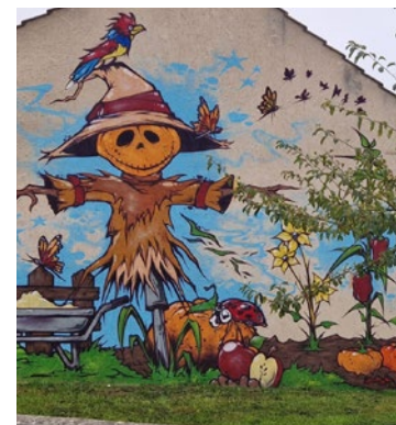
Le Ludipotager a été créé en juin 2022 par l'équipe du Centre socioculturel Oh ! 41.

dimension pédagogique s'est aussi illustrée par la venue de la classe ULIS du collège Sully, dont les élèves ont réalisé les plantations estivales : tomates, concombres, courges et tomates cerises. Tout le monde est invité à passer pour arroser, découvrir et goûter. ■