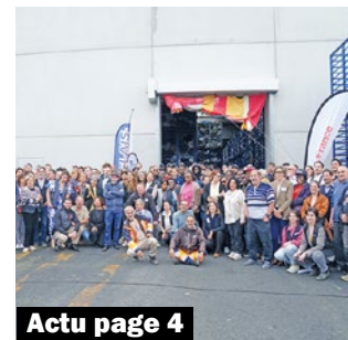
Actu page 4