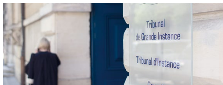
La femme du policier porte encore les stigmates de la violence des coups portés.

En avril dernier, un homme de 39 ans était rentré dans une rage folle et avait frappé plusieurs personnes. Parmi les blessés, se trouvait une femme qui avait dû être transportée à l'hôpital en urgence absolue. Il a pu s'expliquer lors de son procès le 2 juin.