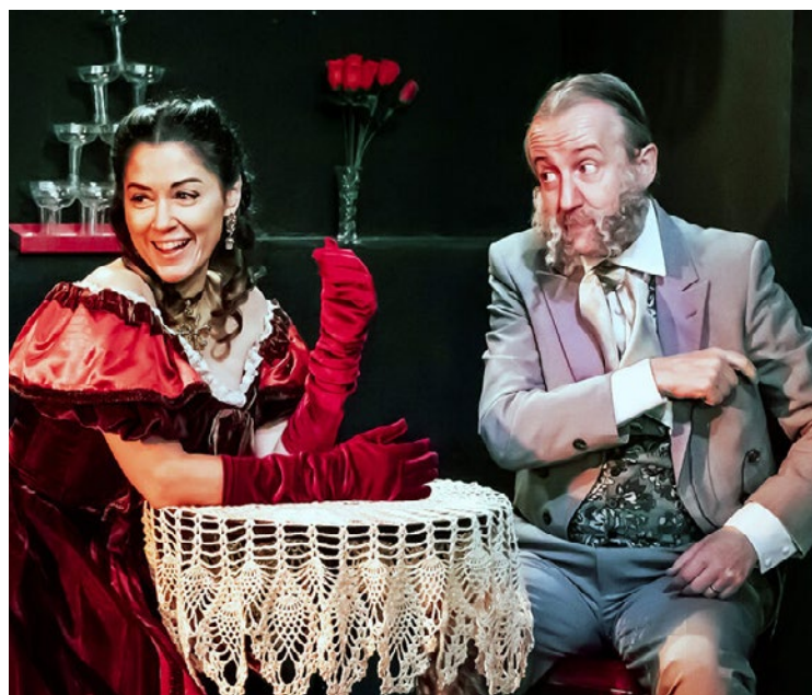
L'association villennoise Studio sur Seine a concocté une 4 ème édition ambitieuse pour son festival.