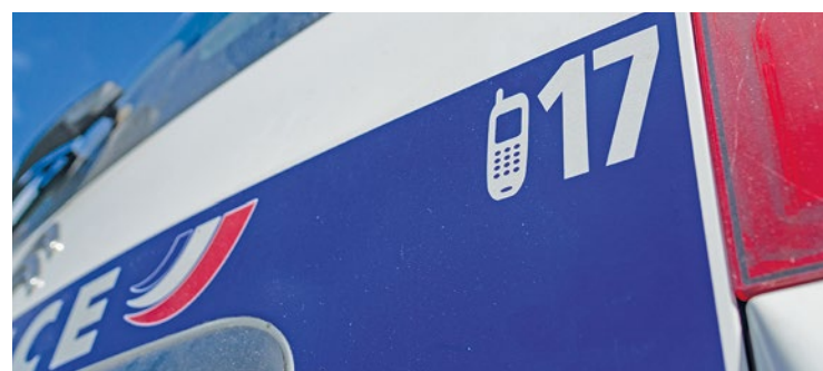
Malgré les coups, aucun fonctionnaire ne s'est déclaré blessé.

Les forces de l'ordre vont à la rencontre de cet homme de 56 ans qui s'est retranché dans sa cabine et qu'il refuse d'ouvrir. Après l'avoir prévenu maintes et maintes fois, les policiers cassent la vitre du camion pour l'interpeller. Ce ne fut pas de tout repos puisque le quinquagénaire se rebelle et porte un coup de tête au bras et des coups de pieds au niveau des jambes d'un policier adjoint. ■