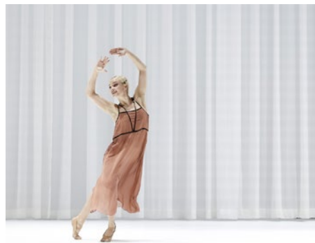
Le chorégraphe mondialement reconnu, Benjamin Millepied, présentera sa nouvelle création intitulée « Barbara, du bout des lèvres » les 11 et 12 janvier.

S'il est difficile de ne sélectionner que quelques dates, on va tout de même mentionner Le Requiem de Mozart, interprété par l'orchestre Les Siècles et Aedes, deux formations d'excellence le 26 février, La disparition de Josef Mengele seul en scène qui fait le récit de l'une des plus grandes chasses à l'homme du XX ème siècle, ou encore la pièce Le Père de Florian Zeller, avec Pierre Arditi et Irène Jacob le mardi 16 mars. Pour retrouver le reste de la programmation, dans laquelle se cache Calogero, une interprétation de West Side Story ou encore une comédie de Laurent Ruquier, cela se passe sur theatre-poissy.fr . ■