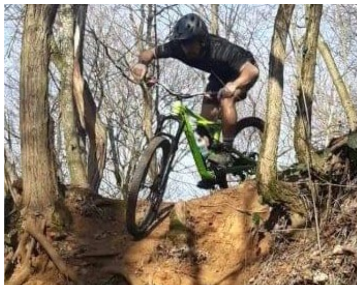
Débutants, confirmés et enfants sont les bienvenus aux Bosses du Vexin.

ans sur le 20 km. Une plaque vélo et un éco-gobelet sont remis à chaque participant au départ. Une station de lavage VTT et un parking sont proposés gratuitement sur place, tandis qu'une buvette attendra les participants à l'arrivée. Les inscriptions se font directement en ligne sur www.helloasso.com/associations/velo-club-issou (inscription sur place possible avec supplément de 2 €). ■