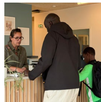
Un démarrage au-delà des espérances, et une équipe qui s'étoffe déjà pour répondre à la demande.

rejoint le centre, avec un dossier en cours pour le remboursement de séances via le dispositif « Mon parcours psy ». Une nouvelle infirmière arrive également le 15 juin. À la rentrée, une psychomotricienne complètera l'équipe, avant l'arrivée attendue d'un médecin généraliste supplémentaire fin octobre, sous validation de l'ARS. ■