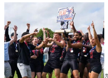
Deux jours de compétition avec des confrontations au plus haut niveau, entre équipes masculines et équipes féminines.

Chez les femmes, les Redlips des Molosses d'Asnières-sur-Seine défendent leur couronne après s'être imposées face au Fenris de Dijon. Références absolues de la discipline en France, les Franciliennes savent que les Dijonnaises ne déplaceront pas jusqu'aux Mureaux pour faire de la figuration. L'entrée est libre et ouverte à tous ceux souhaitant découvrir la discipline. ■