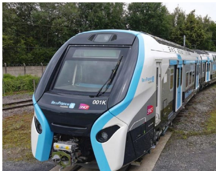
Dans neuf mois, les Mantais monteront dans un RER.

ment allongés. Ces travaux s'inscrivent dans le calendrier du prolongement du RER E, dont la fin des travaux en gare de Poissy est prévue pour juin 2026, avant un lancement commercial à Mantes-la-Jolie le 28 février 2027 (voir ci-contre). ■