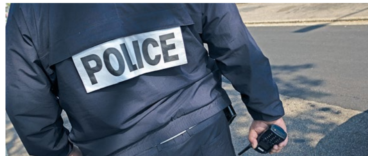
Le mis en cause a indiqué avoir fait usage des ciseaux car la victime l'avait insulté.

La police municipale de Poissy a dû intervenir le 18 mai lors d'une rixe qui se déroulait au niveau de la gare. Un homme de 36 ans a donné plusieurs coups de ciseaux sur le visage d'un autre homme, lui laissant des cicatrices pour le restant de ses jours.