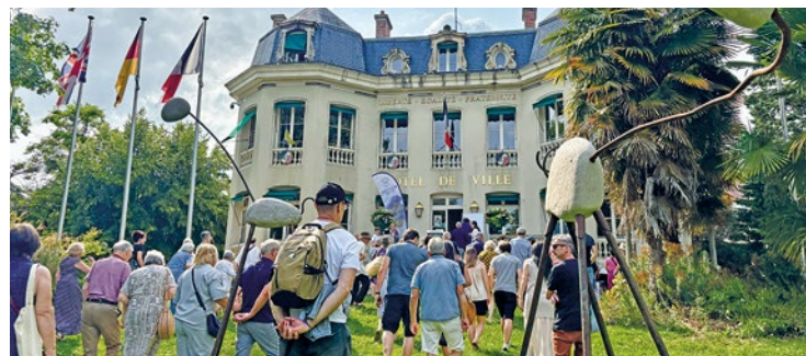
Le vernissage s'est déroulé en fin de semaine dernière.

Jusqu'au 28 septembre, la ville d'Andrésy accueille la nouvelle édition de son exposition d'art contemporain à ciel ouvert. Un parcours culturel gratuit sur l'île Nancy.