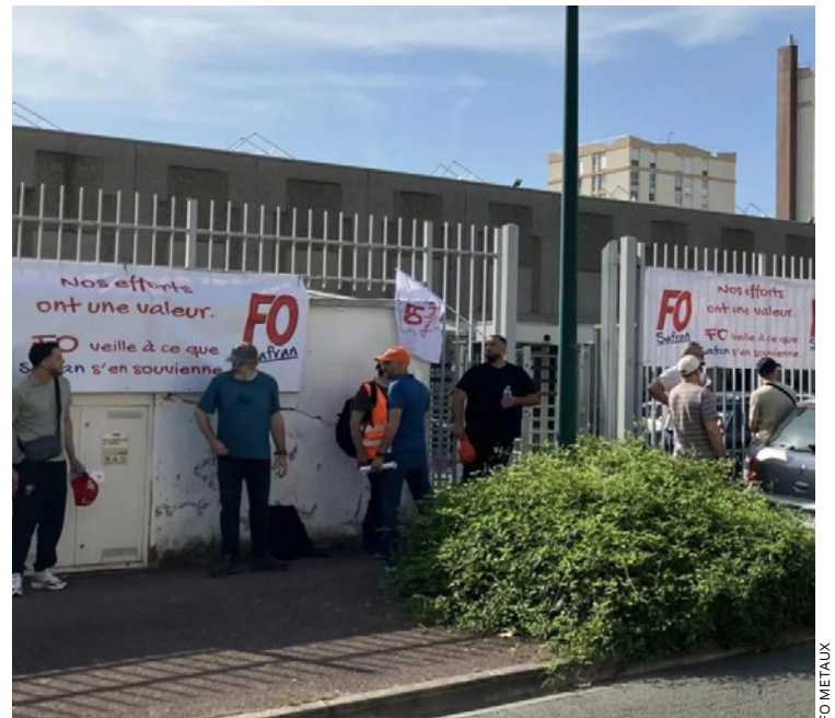
Le site mantevillois de Safran devrait être vide d'ici 2030. Plusieurs salariés avaient donc manifesté le 28 mai.

Après Stellantis qui ne produira plus de voitures, c'est le site mantevillois de Safran qui serait sur le point de fermer à l'horizon 2030. Depuis de nombreuses années, la Vallée de Seine est touchée par la désindustrialisation. Quelles sont les causes mais surtout, quels leviers disposent les pouvoirs publics pour renverser la vapeur ?